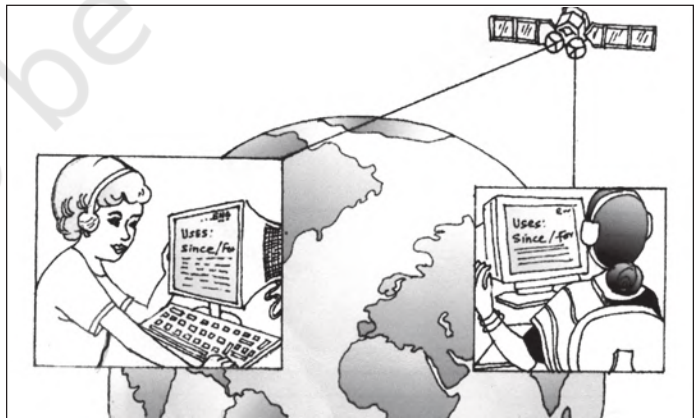
चित्र 3.1 बाह्य प्रापण : बड़े शहरों में रोजगार का एक नया अवसर

सरकार ने सार्वजनिक उपक्रमों को प्रबंधकीय निर्णयों में स्वायत्तता प्रदान कर उनकी कार्यकुशलता को सुधारने का प्रयास किया है। उदाहरण के लिए, कुछ सार्वजनिक उपक्रमों को 'महारत्न', 'नवरत्न' और 'लघुरत्न' का विशेष दर्जा दिया गया है (देखें बॉक्स 3.1)।