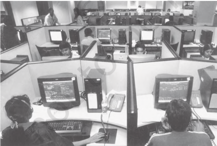
चित्र 3.2 सूचना प्रौद्योगिकी उद्योग का भारत के निर्यात में प्रमुख योगदान

कुछ विद्वानों को आशंका है कि विश्व व्यापार संगठन में भारत की सदस्यता का कोई औचित्य नहीं है, क्योंकि विश्व व्यापार का अधिकांश भाग तो विकसित देशों के बीच ही होता है। उनका यह भी मानना है कि विकसित देश अपने देशों में जहाँ कृषि सहायिकी दिये जाने को लेकर शिकायत करते हैं, वहीं विकासशील देश अपने बाजारों को विकसित देशों के लिए खोले जाने को