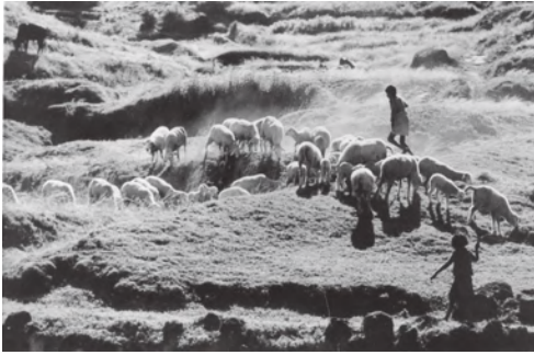
चित्र 6.3 ग्रामीण क्षेत्रों में भेड़ पालन आय वृद्धि का महत्वपूर्ण स्रोत है

आदि। यद्यपि, अधिकांश ग्रामीण महिलाएँ कृषि में रोजगार प्राप्त करती हैं, जबकि पुरुष गैर-कृषि रोजगार की तलाश में हैं। किंतु, हाल के वर्षों में ग्रामीण महिलाएँ भी गैर कृषि कार्यों की ओर अग्रसर होने लगी हैं (देखें बॉक्स 6.2)।