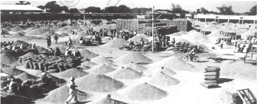
चित्र 6.1 नियमित अनाज मंडियाँ किसानों और उपभोक्ताओं को लाभ पहुँचाती हैं

आइए, हम कृषि विपणन के विभिन्न पहलुओं को सुधारने के लिए किए गए चार प्रमुख उपायों को विस्तारपूर्वक समझने का प्रयास करें। पहला कदम व्यवस्थित एवं पारदर्शी विपणन की दशाओं