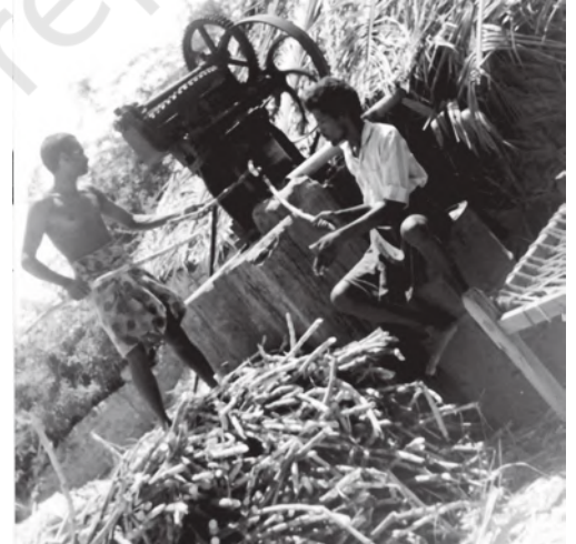
चित्र 6.2 गुड़ निर्माण कृषि क्षेत्रक का एक संबद्ध क्रियाकलाप है

विविधीकरण के दो पहलू हैं: एक पहलू तो फसलों के उत्पादन की प्रणाली में परिवर्तन से संबंधित है। दूसरा पहलू श्रम शक्ति को खेती से हटाकर अन्य संबंधित कार्यों (जैसे पशुपालन, मुर्गी और मत्स्य पालन आदि) तथा गैर-कृषि क्षेत्रक में लगाना है। इस विविधीकरण की आवश्यकता इसलिए उत्पन्न हो रही है, क्योंकि सिर्फ खेती के आधार पर आजीविका कमाने में जोखिम बहुत अधिक हो जाता है। अतः विविधीकरण द्वारा हम न केवल खेती से जोखिम को कम करने में सफल होंगे बल्कि ग्रामीण जन समुदाय को उत्पादक और वैकल्पिक धारणीय आजीविका के अवसर भी उपलब्ध हो पाएँगे। देश में अधिकांश