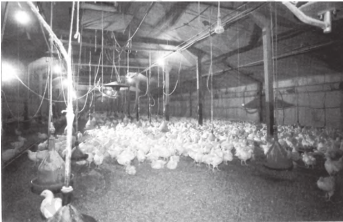
चित्र 6.4 भारत में मुर्गी पालन का पशुधन में सबसे अधिक भाग है

किया है। उसी के आधार पर भारत ने अनेक प्रकार के बागान उत्पादों को अपना लिया है। इनमें प्रमुख हैं – फल-सब्जियाँ, रेशेदार फसलें, औषधीय तथा सुगंधित पौधे, मसाले, चाय, कॉफी इत्यादि। ये सभी फसलें रोजगार के साथ-साथ भोजन और पोषण उपलब्ध कराने में भी बड़ा योगदान दे रही हैं। भारत में बागवानी क्षेत्रक समस्त कृषि उत्पाद का लगभग एक तिहाई और सकल घरेलू उत्पाद का 6 प्रतिशत है। भारत आम, केला, नारियल, काजू जैसे फलों और अनेक मसालों के उत्पादन में तो आज विश्व का अग्रणी देश माना जाता है। कुल मिलाकर फल-सब्जियों के उत्पादन में हमारा विश्व में दूसरा स्थान है। बागवानी में लगे कितने ही कृषकों