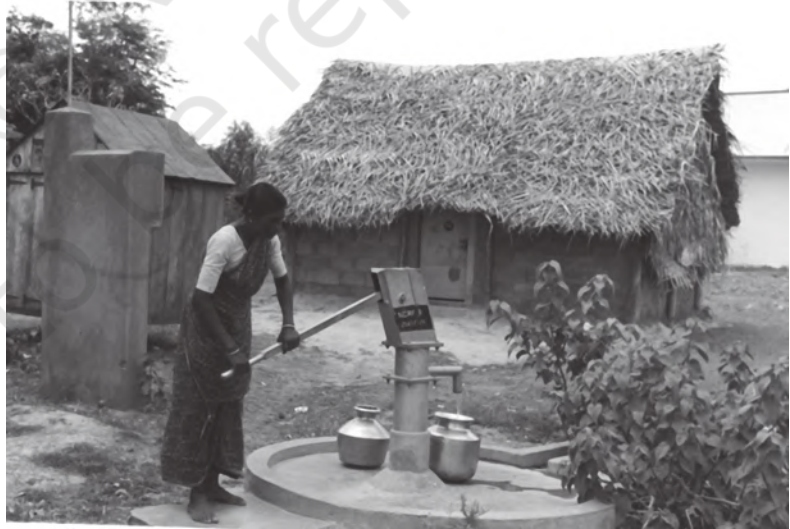
चित्र 8.4 पक्के घर के साथ स्वच्छ पेय जल: अभी भी एक स्वप्न

हमारी बहुसंख्य आबादी ग्रामीण क्षेत्रों में निवास करती है। विश्व में अत्यधिक तकनीकी उन्नति के बावजूद ग्रामीण महिलाएँ अपनी ऊर्जा की आवश्यकताओं की पूर्ति हेतु फसल का बचा-खुचा, गोबर और जलाऊ लकड़ी जैसे जैव ईंधन का आज भी