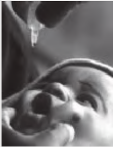
शिशु को पोलियो ड्रॉप दिया जाना

तृतीयक क्षेत्र में ऐसे प्रमुख संस्थान भी शामिल हैं जो कि न केवल उत्तम मेडिकल शिक्षा प्रदान करते और अनुसंधान करते हैं बल्कि वे विशिष्ट स्वास्थ्य सेवाएँ भी प्रदान करते हैं। इनमें से कुछ हैं- मेडिकल इंस्टीट्यूट, नयी दिल्ली, पोस्ट ग्रेजुएट इंस्टीट्यूट, चंडीगढ़; नेशनल इंस्टीट्यूट ऑफ मेंटल हेल्थ और न्यूरो साइंस, बंगलौर और ऑल इंडिया इंस्टीट्यूट ऑफ हाइजीन एंड पब्लिक हेल्थ, कोलकाता।