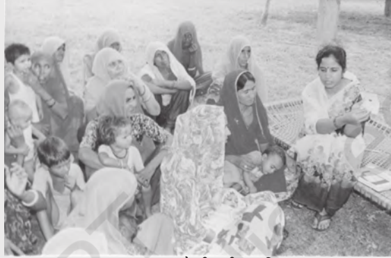
स्वास्थ्य जागरूकता गोष्ठी की प्रगति पर

भारत की स्वास्थ्य आधारिक संरचना और स्वास्थ्य सुविधाओं की तीन स्तरीय व्यवस्था है- प्राथमिक, द्वितीयक और तृतीयक। प्राथमिक क्षेत्रक सुविधाओं में प्रचलित स्वास्थ्य समस्याओं का ज्ञान तथा उन्हें पहचानने, रोकने और नियंत्रित करने की विधि, खाद्य पूर्ति तथा उचित पोषण और जल की पर्याप्त पूर्ति तथा मूलभूत स्वच्छता, शिशु एवं मातृत्व देखभाल, प्रमुख संक्रामक बीमारियों और चोटों से प्रतिरोध तथा मानसिक स्वास्थ्य का संवर्द्धन और आवश्यक दवाओं का प्रावधान शामिल है। ऑक्सीलियरी नर्सिंग मिडवाइफ (ए.एन.एम.) पहला व्यक्ति है, जो ग्रामीण इलाके में प्राथमिक स्वास्थ्य देखभाल प्रदान करता है। प्राथमिक चिकित्सा प्रदान करने के लिए गाँवों तथा छोटे कस्बों में अस्पताल बनाये गये हैं। आमतौर पर यहां एक डॉक्टर, एक नर्स और सीमित मात्रा में दवाएँ उपलब्ध होती हैं। इन्हें प्राथमिक चिकित्सा केंद्र, सामुदायिक चिकित्सा केंद्र और उपकेंद्रों के नाम से जाना जाता है। जब एक रोगी की हालत में प्राथमिक चिकित्सा केंद्र में सुधार नहीं हो पाता, तो उन्हें द्वितीयक या मध्य या उच्च श्रेणी के अस्पतालों में भेजा जाता है। जिन अस्पतालों में शल्य-चिकित्सा, एक्सरे, इ.सी.जी. जैसी बेहतर सुविधाएं होती हैं, उन्हें माध्यमिक चिकित्सा संस्थाएँ कहते हैं। वे प्राथमिक चिकित्सा और बेहतर स्वास्थ्य सुविधाएँ, दोनों ही प्रदान करते हैं। वे प्रायः जिला मुख्यालय और बड़े कस्बों में होते हैं। ऐसे सभी अस्पताल जहाँ उच्च-स्तर के उपकरण और दवाइयाँ उपलब्ध हों और जो कि ऐसे गंभीर स्वास्थ्य समस्याओं का निपटान करें जिसकी सुविधाएँ प्राथमिक या माध्यमिक अस्पतालों में हो, तृतीयक क्षेत्र में आते हैं।