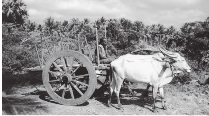
चित्र 8.6 बैलगाड़ी अभी भी ग्रामीण परिवहन बाजार का महत्वपूर्ण माध्यम

हमें ऊर्जा की आवश्यकता क्यों पड़ती है? किन स्वरूपों में यह उपलब्ध है? किसी राष्ट्र की