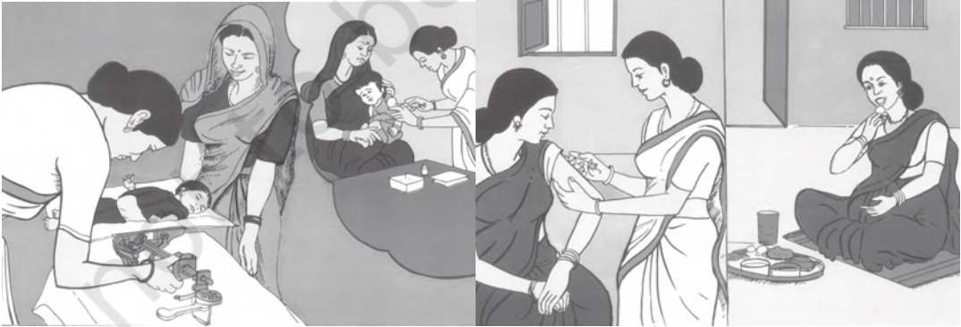
चित्र 8.10 कई प्रकार की चिकित्सा सुविधाओं के बावजूद महिलाओं की चिंताजनक स्थिति

वर्तमान में 20 प्रतिशत से भी कम जनसंख्या जन स्वास्थ्य सुविधाओं का उपभोग करती है। एक अध्ययन से पता चला कि केवल 38 प्रतिशत प्राथमिक चिकित्सा केंद्रों में डॉक्टरों की