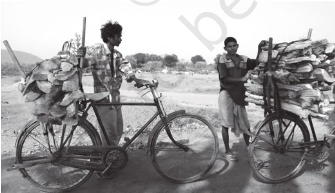
चित्र 8.5 ऊर्जा का महत्वपूर्ण स्रोत ईंधन की लकड़ी

ऊर्जा के स्रोत: ऊर्जा के व्यावसायिक और गैर व्यावसायिक स्रोत होते हैं। व्यावसायिक स्रोतों में ईंधन की लकड़ी, पेट्रोल और बिजली आते हैं क्योंकि उन्हें खरीदा और बेचा जाता है। ऊर्जा के गैर-व्यावसायिक स्रोतों में जलाऊ लकड़ी, कृषि का कूड़ा-कचरा (Waste) और