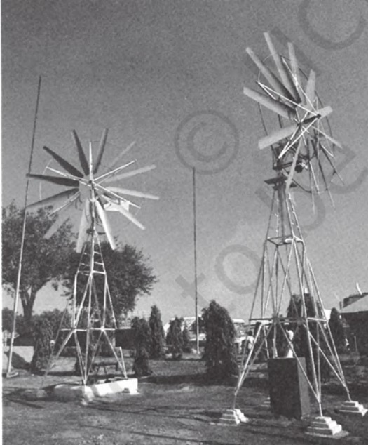
चित्र 8.7 ऊर्जा का अन्य स्रोत पवन चक्की

ऊर्जा के व्यावसायिक और गैर-व्यावसायिक स्रोतों को हम ऊर्जा के पारंपरिक स्रोत कहते हैं।