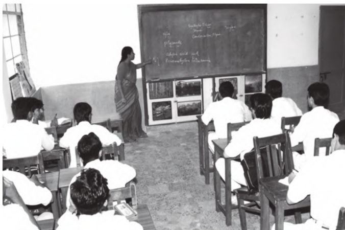
चित्र 8.2 विद्यालय किसी देश की महत्वपूर्ण आधारिक संरचना