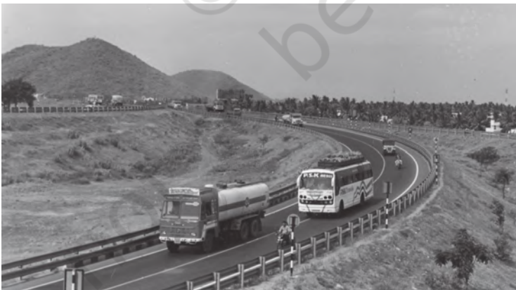
चित्र 8.1 समृद्धि के मार्गों को जोड़ने वाली सड़कें

आधारिक संरचना औद्योगिक व कृषि उत्पादन, घरेलू व विदेशी व्यापार और वाणिज्य के प्रमुख क्षेत्रों में सहयोगी सेवाएँ उपलब्ध कराती हैं। इन सेवाओं में सड़क, रेल, बंदरगाह, हवाई अड्डे, बाँध, बिजली घर, तेल व गैस, पाईपलाइन, दूरसंचार सुविधाएँ, स्कूल-कॉलेज सहित देश की शैक्षिक व्यवस्था, अस्पताल