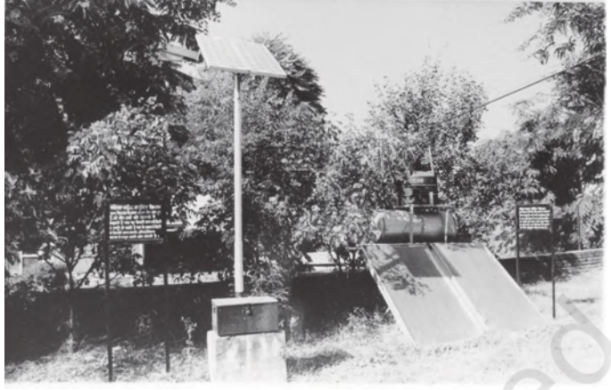
चित्र 8.8 सौर ऊर्जा के लिए बड़ी संभावनाएँ

ऊर्जा के तीन और स्रोत हैं जिन्हें हम आमतौर पर गैर-पारंपरिक स्रोत कहते हैं, वे हैं-सौर ऊर्जा, पवन ऊर्जा और ज्वार ऊर्जा। उष्ण प्रदेश होने के कारण भारत में इन तीनों प्रकार की ऊर्जाओं का उत्पादन करने की असीमित संभावनाएँ हैं। ऐसा तभी संभव होगा जबकि कोई सस्ती प्रौद्योगिकी का उपयोग किया जाये या और भी सस्ती प्रौद्योगिकी विकसित की जाये।