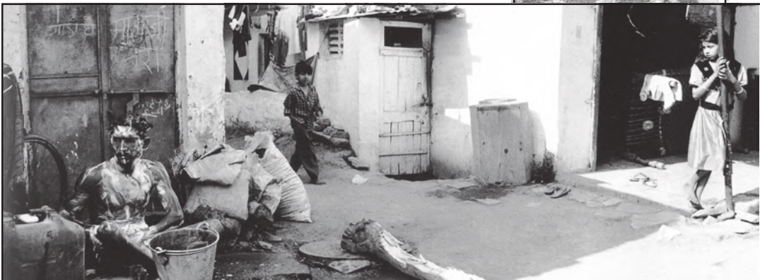
आस-पड़ोस के कामकाजी वर्ग से गंदी बस्तियों तक