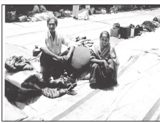
एक गृहविहीन दंपति

वर्ष 1999-2000 से आरंभ हुई इंदिरा आवास योजना सरकार के ग्रामीण विकास मंत्रालय (एम.ओ.आर.डी.) तथा भवन एवं शहरी विकास निगम (हुडको) द्वारा संचालित एक विशाल योजना है, जो गरीब और गृहविहीन लोगों के लिए मुफ्त आवास मुहैया कराएगी। क्या आप ऐसे अन्य मुद्दे बता सकते हैं जो व्यक्तिगत समस्याओं और जनहित के मुद्दों में संबंध दर्शाते हैं?