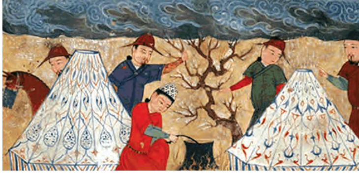
कुबलई खान और चाबी, शिविर में