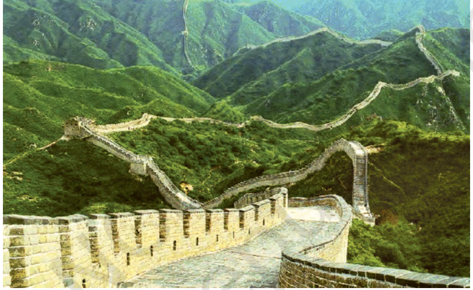
चीन की महान दीवार।

स्थायी समाज कमजोर पड़ने लगे। उन्होंने कृषि को अव्यवस्थित कर दिया और नगरों को लूटा। दूसरी ओर यायावर, लूटपाट कर संघर्ष क्षेत्र से दूर भाग जाते थे जिससे उन्हें बहुत कम हानि होती थी। अपने संपूर्ण इतिहास में चीन को इन यायावरों से विभिन्न शासन-कालों में बहुत अधिक क्षति पहुँची। यहाँ तक कि आठवीं शताब्दी ई.पू. से ही अपनी प्रजा की रक्षा के लिए चीनी शासकों ने किलेबंदी करना प्रारंभ कर दिया था। तीसरी शताब्दी ई.पू. से इन किलेबंदियों का एकीकरण सामान्य रक्षात्मक ढाँचे के रूप में किया गया जिसे आज 'चीन की महान दीवार' के रूप में जाना जाता है। उत्तरी चीन के कृषक समाजों पर यायावरों द्वारा लगातार हुए हमलों और उनसे पनपते अस्थिरता और भय का यह एक प्रभावशाली चाक्षुष साक्ष्य है।