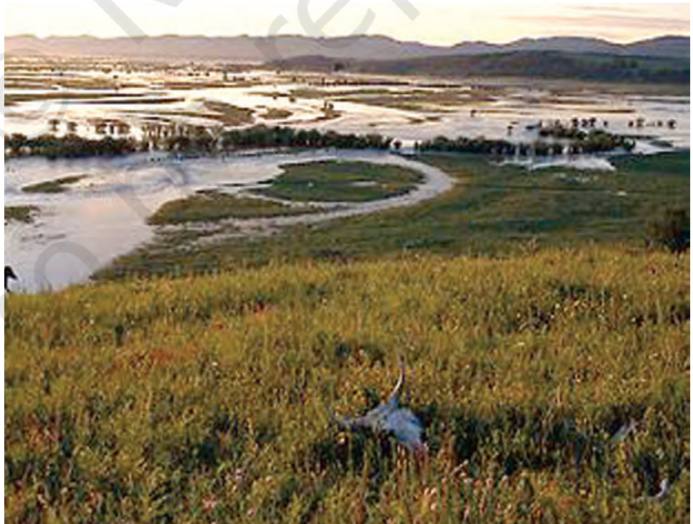
ओनोन नदी के मैदान में बाढ़।

मंगोल विविध जनसमुदाय का एक निकाय था। ये लोग पूर्व में तातार, खितान और मंचू लोगों से और पश्चिम में तुर्की कबीलों से भाषागत समानता होने के कारण परस्पर सम्बद्ध थे। कुछ मंगोल पशुपालक थे और कुछ शिकारी संग्राहक थे। पशुपालक घोड़ों, भेड़ों और कुछ हद तक अन्य पशुओं जैसे बकरी और ऊँटों को भी पालते थे। उनका यायावरीकरण मध्यएशिया की चारण भूमि (स्टेपीज) में हुआ जोकि आज के आधुनिक मंगोलिया राज्य का भूभाग है। इस क्षेत्र का परिदृश्य आज जैसा ही अत्यंत मनोरम था और क्षितिज अत्यंत विस्तृत और लहरिया मैदानों से घिरा था जिसके पश्चिमी भाग में अल्ताई पहाड़ों की बर्फ़ीली चोटियाँ थीं। दक्षिण भाग में शुष्क गोबी का मरुस्थल इसके उत्तर और पश्चिम क्षेत्र में ओनोन और सेलेंगा जैसी नदियों और बर्फ़ीली पहाड़ियों से निकले सैकड़ों झरनों के पानी से सिंचित हो रहा था। पशुचारण के लिए यहाँ पर अनेक हरी घास के मैदान और प्रचुर मात्रा में छोटे-मोटे शिकार अनुकूल ऋतुओं में उपलब्ध हो जाते थे। शिकारी-संग्राहक लोग, पशुपालक कबीलों के आवास-क्षेत्र के उत्तर में साइबेरियाई वनों में रहते