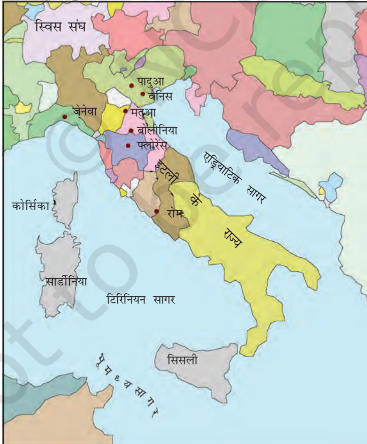
मानचित्र 1 : इटली के राज्य।

बाइज़ेंटाइन साम्राज्य और इस्लामी देशों के बीच व्यापार के बढ़ने से इटली के तटवर्ती बंदरगाह पुनर्जीवित हो गए। बारहवीं शताब्दी से जब मंगोलों ने चीन के साथ 'रेशम-मार्ग' (देखिए विषय 5) से व्यापार आरंभ किया तो इसके कारण पश्चिमी यूरोपीय देशों के व्यापार को बढ़ावा मिला। इसमें इटली के नगरों ने मुख्य भूमिका निभाई। अब वे अपने को एक शक्तिशाली साम्राज्य के अंग