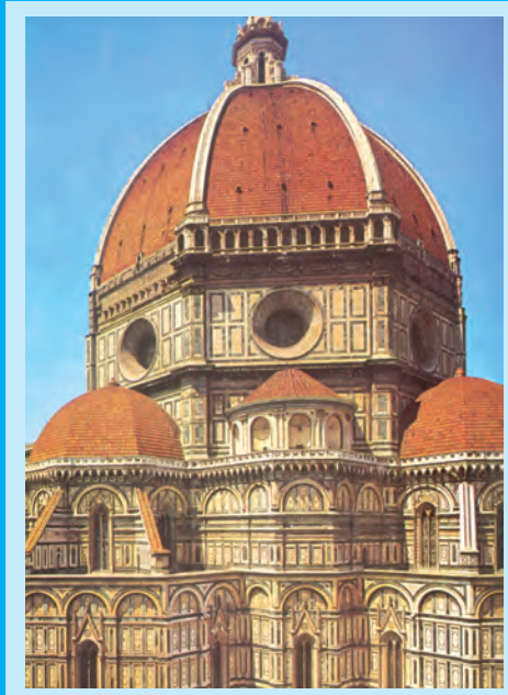
दी ड्युमा (Duomo), फ्लोरेंस के कथीड्रल का गुम्बद, इसका डिजाइन ब्रनेलेशी ने बनाया।

(Filippo Brunelleschi, 1337-1446) जिन्होंने फ्लोरेंस के भव्य गुम्बद (Duomo) का परिरूप प्रस्तुत किया था, ने अपना पेशा एक मूर्तिकार के रूप में शुरू किया। इस काल में एक और अनोखा बदलाव आया। अब कलाकार की पहचान उसके नाम से होने लगी, न कि पहले की तरह उसके संघ या श्रेणी (गिल्ड) के नाम से।