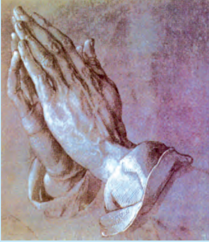
ड्यूरर का तूलिका चित्र 1508- “प्रार्थना रत हस्त”

उस काल के लोगों के विचार को आकार देने का साधन मानवतावादियों के लिए केवल औपचारिक शिक्षा ही नहीं थी। कला, वास्तुकला और ग्रंथों ने मानवतावादी विचारों को फैलाने में प्रभावी भूमिका निभाई।