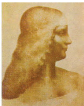
इसाबेला दि इस्ते।

फेदेले की रचनाओं से यह बात सामने आती है कि इस काल में सब लोग शिक्षा को बहुत महत्त्व देते थे। वे वेनिस की अनेक लेखिकाओं में से एक थीं जिन्होंने गणतंत्र की आलोचना “स्वतंत्रता की एक बहुत सीमित परिभाषा निर्धारित करने के लिए की, जो महिलाओं की अपेक्षा पुरुषों की इच्छा का ज्यादा समर्थन करती थी।” इस काल की एक अन्य प्रतिभाशाली महिला मंटुआ की मार्चिसा ईसाबेला दि इस्ते (Isabella d' Este, 1474-1539) थीं। उन्होंने अपने पति की अनुपस्थिति में अपने राज्य पर शासन किया। यद्यपि मंटुआ, एक छोटा राज्य था तथापि उसका राजदरबार अपनी बौद्धिक प्रतिभा के लिए प्रसिद्ध था। महिलाओं की रचनाओं से उनके इस दृढ़ विश्वास का पता चलता है कि उन्हें पुरुष-प्रधान समाज में अपनी पहचान बनाने के लिए अधिक आर्थिक स्वायत्तता, संपत्ति और शिक्षा मिलनी चाहिए।