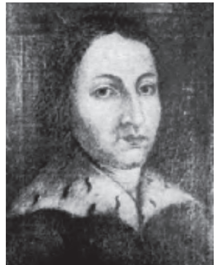
कोपरनिकस का आत्म-चित्र।

खगोलीय का अर्थ दैवी या स्वर्गीय है जबकि पार्थिव में दुनियावी गुण अंतर्निहित है।