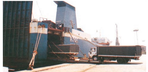
चित्र 7.6 – मुंबई पत्तन में जहाज पर ट्रकों को ले जाते हुए

मुंबई वृहत्तम पत्तन है जिसके प्राकृतिक खुले, विस्तृत व सुचारु पोताश्रय हैं। मुंबई पत्तन के अधिक परिवहन को ध्यान में रखकर इसके सामने जवाहरलाल नेहरू पत्तन विकसित किया गया जो इस पूरे क्षेत्र को एक समूह