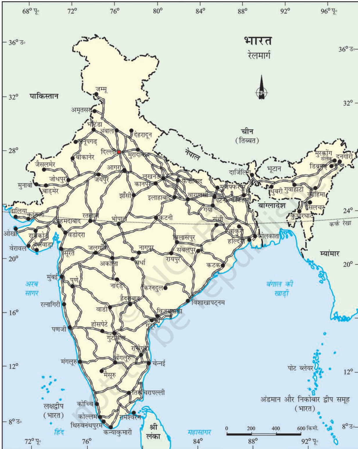
भारत - रेलमार्ग

क्या आप जानते हैं? रेलवे लाइन कश्मीर घाटी में बनिहाल से बारामुला तक बिछाई जा चुकी है। इन दोनों शहरों को भारत के मानचित्र पर चिह्नित करें।