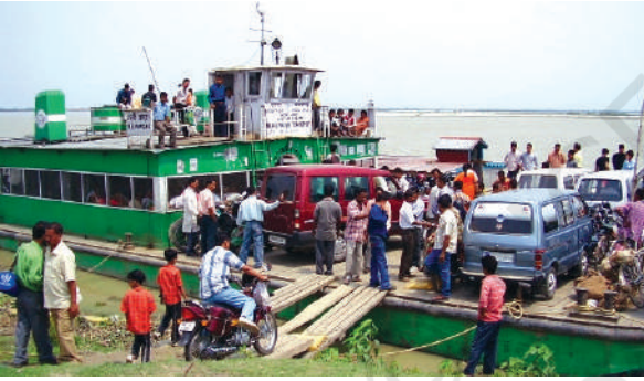
चित्र 7.5 – उत्तर-पूर्वी राज्यों में आंतरिक जलमार्ग परिवहन अधिक महत्वपूर्ण है

भारत के लोग प्राचीनकाल से समुद्री यात्राएँ करते रहे हैं। इसके नाविकों ने दूर तथा पास के क्षेत्रों में भारतीय संस्कृति व व्यापार को फैलाया है। जल परिवहन, परिवहन का सबसे सस्ता साधन है। यह भारी व स्थूलकाय वस्तुएँ ढोने में अनुकूल है। यह परिवहन साधनों में ऊर्जा सक्षम तथा पर्यावरण अनुकूल हैं। भारत में अंतः स्थलीय नौसंचालन जलमार्ग 14,500 किमी. लंबा है। इसमें केवल 5,685 किमी. मार्ग ही मशीनीकृत नौकाओं द्वारा तय किया जाता है।