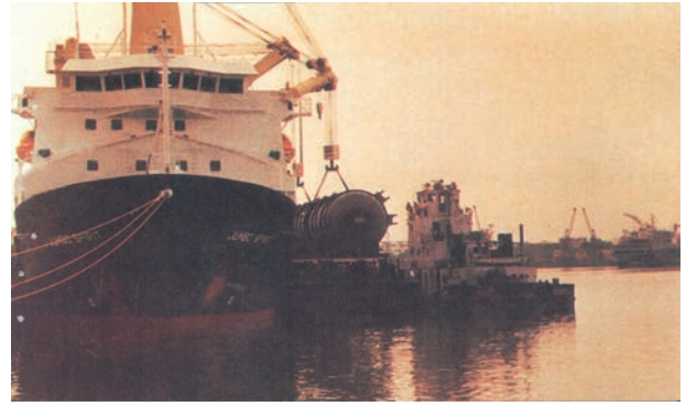
चित्र 7.8 – बड़े आकार के कार्गो को उताने-रखने की सुविधाओं से युक्त तूतीकोरन पत्तन

पूर्वी तट के साथ तमिलनाडु में दक्षिण-पूर्वी छोर पर तूतीकोरन पत्तन है। यह एक प्राकृतिक पोताश्रय है तथा इसकी पृष्ठभूमि भी अत्यंत समृद्ध है। अतः यह पत्तन हमारे पड़ोसी देशों जैसे – श्रीलंका, मालदीव आदि तथा भारत के तटीय क्षेत्रों की भिन्न वस्तुओं के व्यापार को संचालित करता है। चेन्नई हमारे देश का प्राचीनतम कृत्रिम पत्तन है। व्यापार की मात्रा तथा लदे सामान के संदर्भ में इसका मुंबई के बाद दूसरा स्थान है। विशाखापट्टनम स्थल से घिरा, गहरा व सुरक्षित पत्तन है। प्रारम्भ में यह पत्तन लौह-अयस्क निर्यातक के रूप में विकसित किया गया था। ओडिशा में स्थित पारादीप पत्तन विशेषतः लौह-अयस्क का निर्यात करता है। कोलकाता एक अंतःस्थलीय नदीय (Riverine) पत्तन है। यह पत्तन गंगा-ब्रह्मपुत्र बेसिन के वृहत् व समृद्ध पृष्ठभूमि को सेवाएँ प्रदान करता है। ज्वारीय (Tidal) पत्तन होने के कारण तथा हुगली के तलछट जमाव से इसे नियमित रूप से साफ करना पड़ता है। कोलकाता पत्तन पर बढ़ते व्यापार को कम करने हेतु हल्दिया सहायक पत्तन के रूप में विकसित किया गया है।