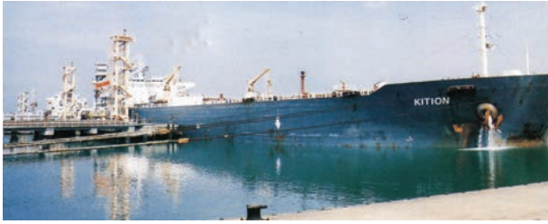
चित्र 7.7 – न्यू-मंगलौर पत्तन पर टैंकर द्वारा कच्चे तेल का निर्वहन

पत्तन की सुविधा भी प्रदान कर सके। लौह-अयस्क के निर्यात के संदर्भ में मारमागाओ पत्तन देश का महत्वपूर्ण पत्तन है। यहाँ से देश के कुल निर्यात का आधा (50 प्रतिशत) लौह-अयस्क निर्यात किया जाता है। कर्नाटक में स्थित न्यू-मैंगलोर पत्तन कुद्रेमुख खानों से निकले लौह-अयस्क का निर्यात करता है। सुदूर दक्षिण-पश्चिम में कोची पत्तन है; यह एक लैगून के मुहाने पर स्थित एक प्राकृतिक पोताश्रय है।