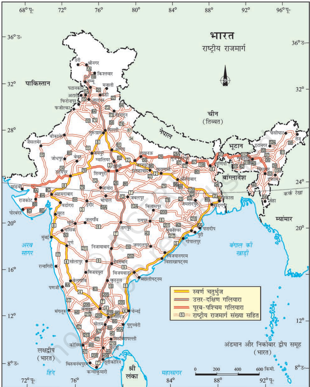
भारत - राष्ट्रीय राजमार्ग