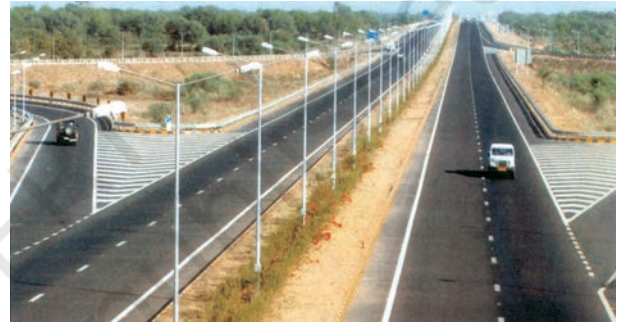
चित्र 7.1 – अहमदाबाद-वडोदरा द्रुतमार्ग