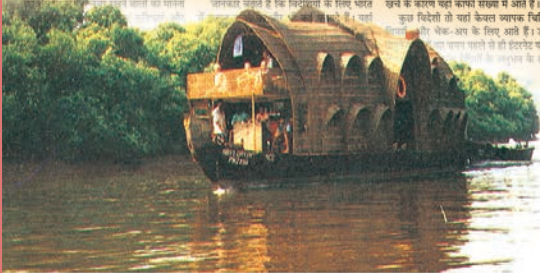
गोआ के मैंग्रोव वन में पारि-पर्यटन

का अनुमान लगाया होटलों के साथ करार होता है और केरल और महाराष्ट्र जैसे पर्यटन के विकास में अग्रणी राज्यों पर अन्य छोटे राज्यों का अर्थव्यवस्था में भी काफी तेज वृद्धि दर का अनुमान है। यहाँ अपने पहले लोगों अफिरका संस्था भारतीय, इंडोनेशिया, जहाँ वृद्धि और डिटेर के लोगों को होती है। यह एक विकास का नाम है कि यहाँ प्रभाव करने। डिटेर का अर्थव्यवस्था के लोगों को यहाँ के विदेशियों के अर्थव्यवस्था सुविधाओं और खर्च के कारण यहाँ काफी संख्या में आते हैं।