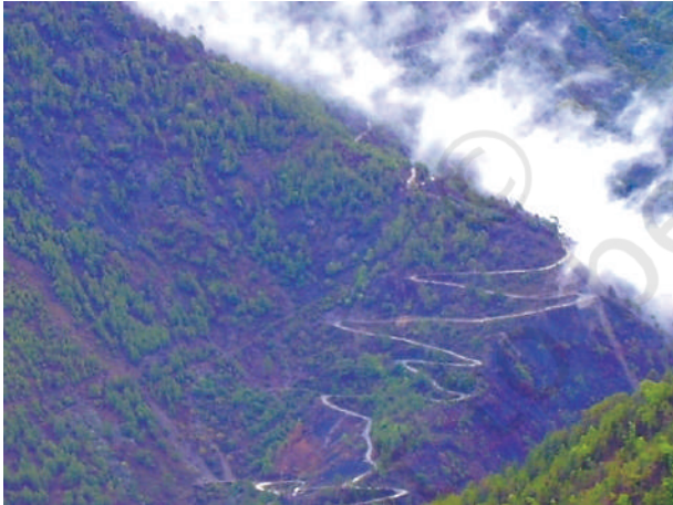
चित्र 7.3 – पहाड़ी रास्ते