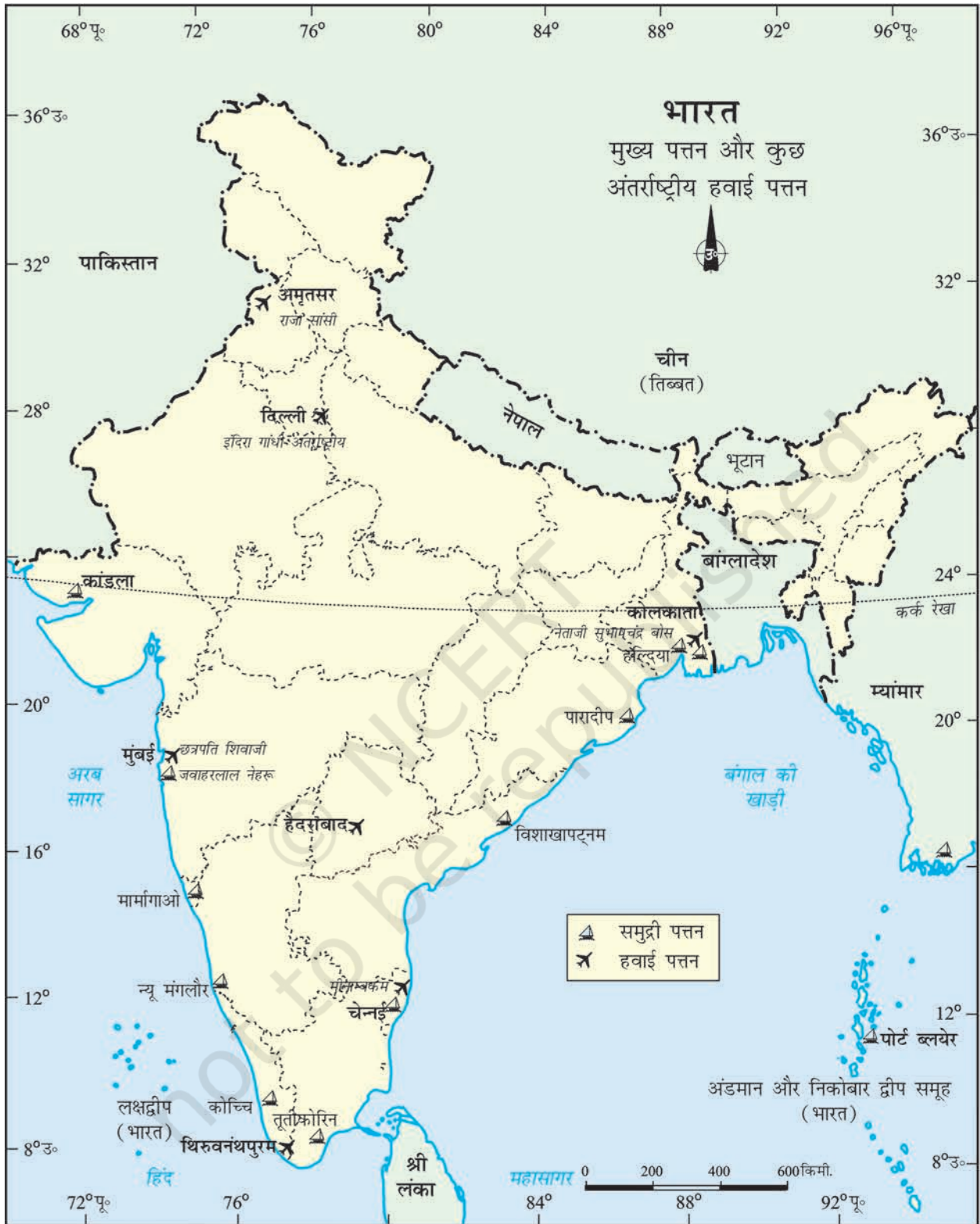
भारत - मुख्य पत्तन और कुछ अंतर्राष्ट्रीय हवाई पत्तन