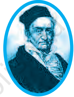
कार्ल फ्रैड्रिक गॉस (1777 – 1855)

अंकगणित की आधारभूत प्रमेय के रूप में विख्यात होने से पहले, प्रमेय 1.2 का संभवतया सर्वप्रथम वर्णन यूक्लिड के एलीमेंट्स की पुस्तक IX में साध्य (proposition) 14 के रूप में हुआ था। परंतु इसकी सबसे पहले सही उपपत्ति कार्ल फ्रैड्रिक गॉस (Carl Friedrich Gauss) ने अपनी कृति डिसक्वीशंस अरिथिमेटिकी (Disquisitiones Arithmeticae) में दी। कार्ल फ्रैड्रिक गॉस को प्रायः 'गणितज्ञों का राजकुमार' कहा जाता है तथा उनका नाम सभी समयकालों के तीन महानतम गणितज्ञों में लिया जाता है, जिनमें आर्किमिडीज़ (Archimedes) और न्यूटन (Newton) भी सम्मिलित हैं। उनका गणित और विज्ञान दोनों में मौलिक योगदान है।