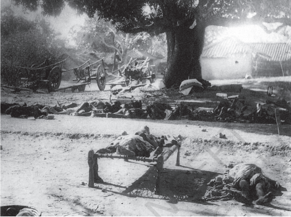
चित्र 5 - चौरा-चौरा, 1922

आदिवासियों ने गांधीजी के नाम का नारा लगाया और 'स्वतंत्र भारत' की हुंकार भरी तो वे एक अखिल भारतीय आंदोलन से भी भावनात्मक स्तर पर जुड़े हुए थे। जब वे महात्मा गांधी का नाम लेकर काम करते थे या अपने आंदोलन को कांग्रेस के आंदोलन से जोड़कर देखते थे तो वास्तव में एक ऐसे आंदोलन का अंग बन जाते थे जो उनके इलाके तक ही सीमित नहीं था।