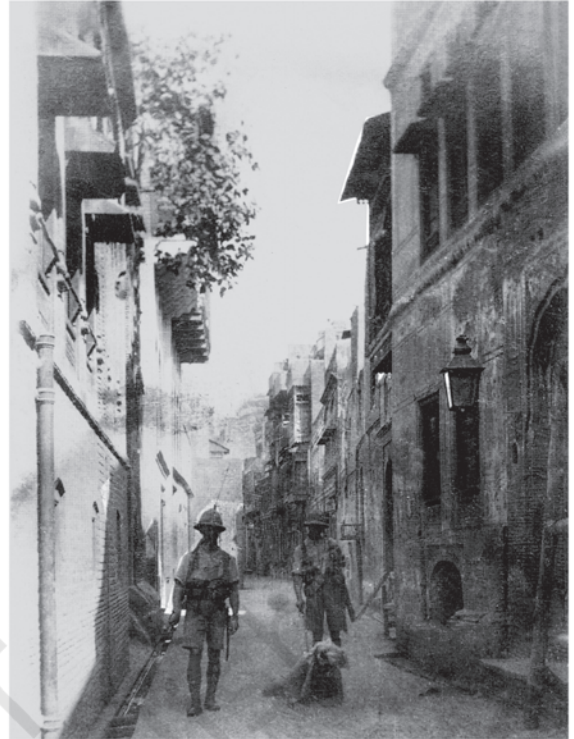
चित्र 3 - जनरल डायर के हुक्म से सिपाही लोगों को घिसट कर चलने के लिए मजबूर कर रहे हैं, पंजाब, 1919

अपनी प्रसिद्ध पुस्तक हिंद स्वराज (1909) में महात्मा गांधी ने कहा था कि भारत में ब्रिटिश शासन भारतीयों के सहयोग से ही स्थापित हुआ था और यह शासन इसी सहयोग के कारण चल पा रहा है। अगर भारत के लोग अपना सहयोग वापस ले लें तो साल भर के भीतर ब्रिटिश शासन ढह जाएगा और स्वराज की स्थापना हो जाएगी।