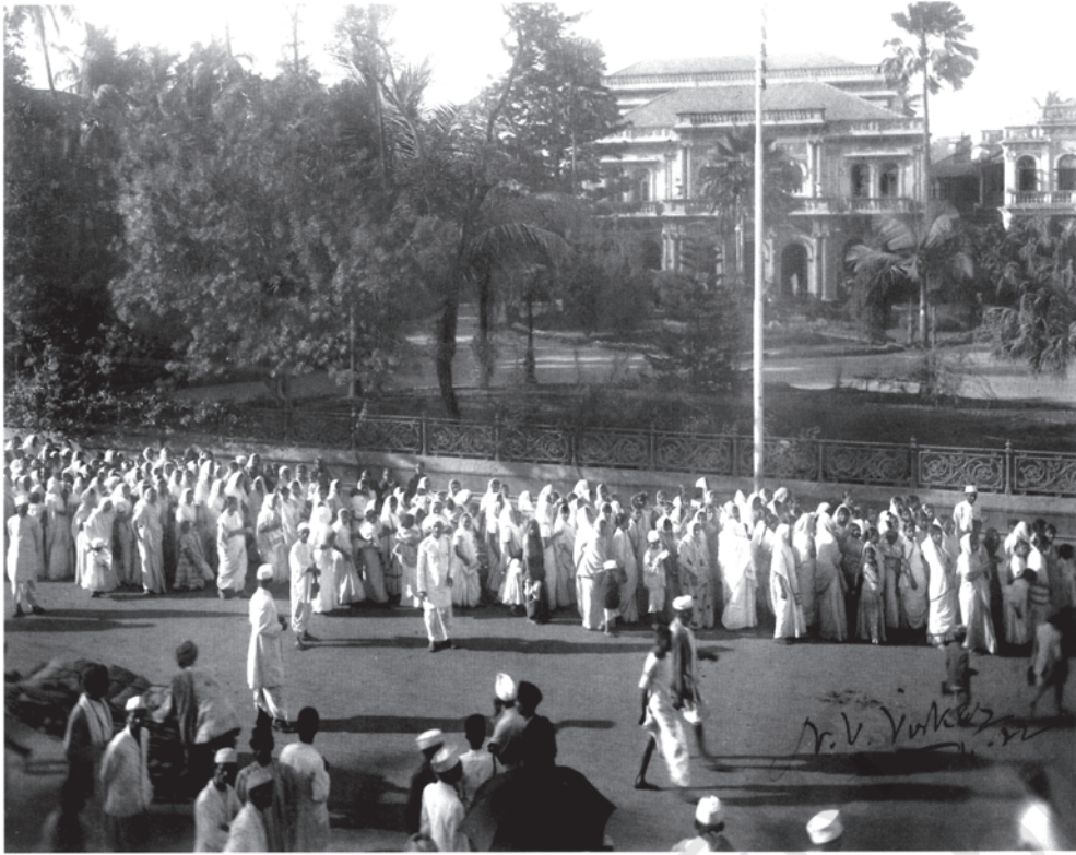
चित्र 9 - राष्ट्रवादी जुलूसों में औरतें भी शामिल थीं।

राष्ट्रीय आंदोलन के दौरान बहुत सारी औरतें अपनी जिदगी में पहली बार अपने घर से निकलकर सार्वजनिक क्षेत्र में आई थीं। इस चित्र में आप बच्चों को गोद में लिए बहुत सारी ज्यादा उम्र वाली औरतों और माँओं को भी जुलूस में देख सकते हैं।