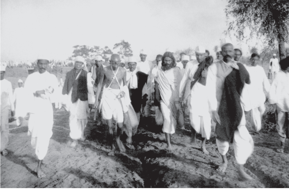
चित्र 7 - दांडी मार्च।

नमक यात्रा के दौरान महात्मा गांधी के साथ उनके 78 सहयोगी भी गए थे। रास्ते में हजारों लोग इस यात्रा में जुड़ते गए।