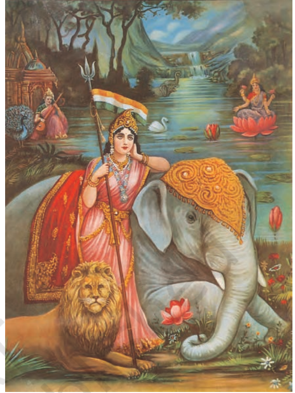
चित्र 14 - भारत माता।

लोगों को एकजुट करने की इन कोशिशों की अपनी समस्याएँ थीं। जिस अतीत का गौरवगान किया जा रहा था वह हिंदुओं का अतीत था। जिन