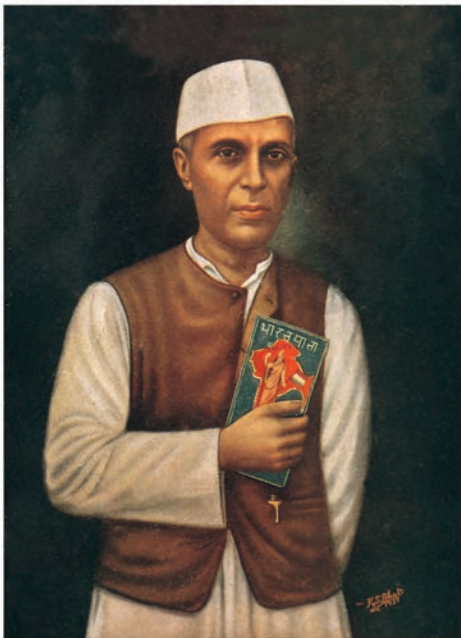
चित्र 13 - जवाहरलाल नेहरू, एक लोकप्रिय चित्र।

इस चित्र में नेहरू भारत माता और भारत के नक्शे को हृदय के पास रखे दिखाई दे रहे हैं। बहुत सारे चित्रों में राष्ट्रवादी नेताओं को अपना सिर भारत माता के चरणों में चढ़ाते हुए दर्शाया गया है। माँ के लिए बलिदान का विचार लोगों की कल्पना में बहुत महत्वपूर्ण था।