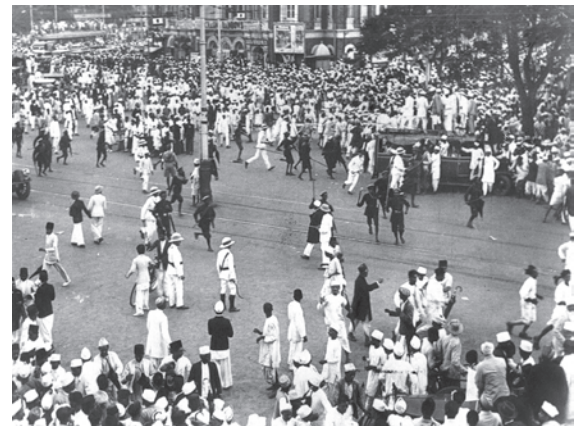
चित्र 8 - सत्याग्रहियों पर हमला करती पुलिस, 1930

महात्मा गांधी ने एक बार फिर आंदोलन वापस ले लिया। 5 मार्च 1931 को उन्होंने इरविन के साथ एक समझौते पर दस्तख़त कर दिए। इस गांधी-इरविन समझौते के ज़रिए गांधीजी ने लंदन में होने वाले दूसरे गोलमेज़ सम्मेलन में हिस्सा लेने पर अपनी सहमति व्यक्त कर दी (पहले