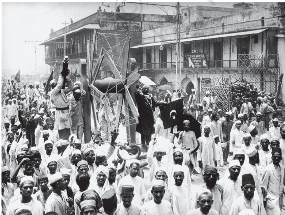
चित्र 4 - विदेशी कपड़े का बहिष्कार, जुलाई 1922 विदेशी कपड़ों को पश्चिमी आर्थिक एवं सांस्कृतिक प्रभुत्व का प्रतीक माना जाता था।

बहिष्कार : किसी के साथ संपर्क रखने और जुड़ने से इनकार करना या गतिविधियों में हिस्सेदारी, चीजों की खरीद व इस्तेमाल से इनकार करना। आमतौर पर यह विरोध का एक रूप होता है।