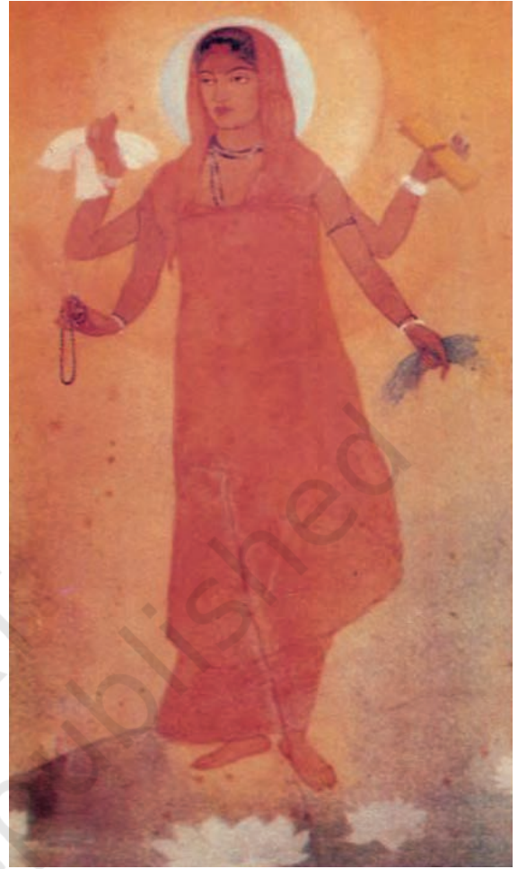
चित्र 12 - भारत माता, अबनीन्द्रनाथ टैगोर, 1905 ध्यान से देखें कि यहाँ दर्शाई गई माँ की छवि शिक्षा, भोजन और कपड़े दे रही है। एक हाथ में माला उसके संन्यासी गुण को रेखांकित करती है। अपने पूर्ववर्ती रवि वर्मा की भांति अबनीन्द्रनाथ टैगोर ने भी ऐसी चित्र शैली विकसित करने का प्रयास किया जिसे सच्चे अर्थों में भारतीय माना जा सके।

राष्ट्रवाद का विचार भारतीय लोक कथाओं को पुनर्जीवित करने के आंदोलन से भी मजबूत हुआ। उन्नीसवीं सदी के आखिर में राष्ट्रवादियों ने भाटों व चारणों द्वारा गाई-सुनाई जाने वाली लोक कथाओं को दर्ज करना शुरू कर दिया। वे लोक गीतों व जनश्रुतियों को इकट्ठा करने के लिए गाँव-गाँव घूमने लगे। उनका मानना था कि यही कहानियाँ हमारी उस परंपरागत संस्कृति की सही तसवीर पेश करती हैं जो बाहरी ताकतों के प्रभाव से भ्रष्ट और दूषित हो चुकी है। अपनी राष्ट्रीय पहचान को दूढ़ने और अपने अतीत में गौरव का भाव पैदा करने के लिए इस लोक परंपरा को बचाकर रखना जरूरी था। बंगाल में खुद रबीन्द्रनाथ टैगोर भी लोक-गाथा गीत, बाल गीत और मिथकों