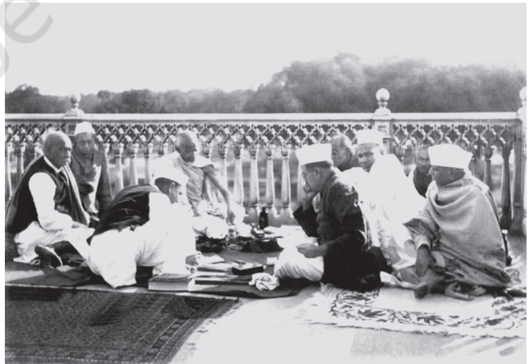
चित्र 6 - इलाहाबाद में कांग्रेस के नेताओं की बैठक, 1931

साइमन कमीशन के खिलाफ शांतिपूर्ण प्रदर्शन के दौरान ब्रिटिश पुलिस ने लाला लाजपत राय पर हमला किया। प्रदर्शन के दौरान मिले गये जख्मों के कारण उन्होंने दम तोड़ दिया।