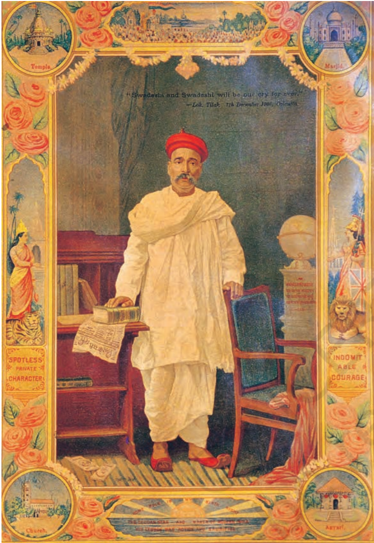
चित्र 11 - बालगंगाधर तिलक, बीसवीं सदी के शुरू की तसवीर।

ध्यान से देखें कि तिलक एकता के प्रतीकों से घिरे हुए हैं। चित्र के चारों ओर विभिन्न धर्मों के पवित्र स्थान (मंदिर, चर्च, मस्जिद) चित्रित किए गए हैं।