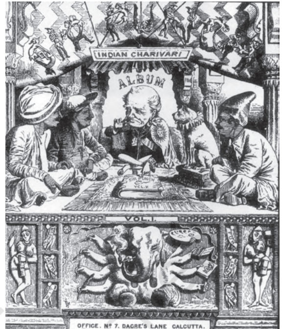
चित्र 18 – इंडियन शारिवारी का आवरण पृष्ठ।

उर्दू, तमिल, बंगाली और मराठी प्रिंट-संस्कृति पहले विकसित हो गई थी, पर गंभीर हिंदी छपाई की शुरुआत 1870 के दशक से ही हुई। जल्द ही इसका एक बड़ा हिस्सा नारी-शिक्षण को समर्पित हुआ। बीसवीं सदी के आरंभ में महिलाओं के लिए मुद्रित, और कभी-कभी उनके द्वारा संपादित पत्रिकाएँ