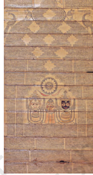
चित्र 14 – जयदेव के गीत गोविंद के कुछ पन्ने, अठारहवीं सदी।

लेकिन पांडुलिपियाँ नाजुक होती थीं, काफ़ी मँहगी भी। एक तो उन्हें बड़ी सावधानी से पकड़ना होता था, दूसरे, लिपियों के अलग-अलग तरीक़े से लिखे जाने के चलते उन्हें पढ़ना भी आसान नहीं था। इसलिए उनका व्यापक