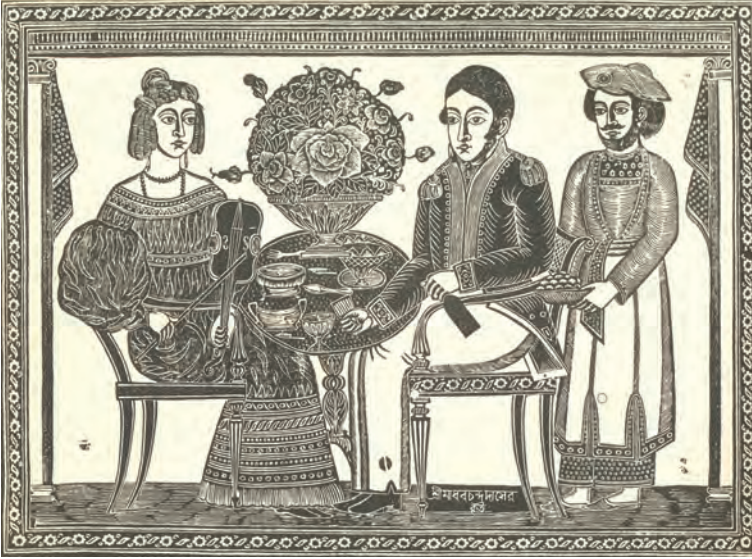
चित्र 21 – एक यूरोपीय दंपति, उन्नीसवीं सदी का काष्ठचित्र इस तस्वीर में पारंपरिक भूमिकाओं का निरूपण है। साहब शराब की बोतल थामे हैं, और मेमसाहब वायलिन बजा रही हैं।

स्थिति में आ गए थे। बीसवीं सदी के आरंभ से सार्वजनिक पुस्तकालय खुलने लगे थे, जिससे किताबों की पहुँच निस्संदेह बढ़ी। ये पुस्तकालय अकसर शहरों या क़स्बों में होते थे, या यदा-कदा संपन्न गाँवों में भी। स्थानीय अमीरों के लिए पुस्तकालय खोलना प्रतिष्ठा की बात थी।