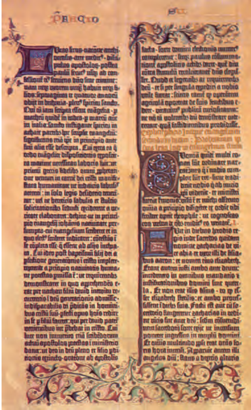
चित्र 7 – यूरोप की पहली छपी किताब, गुटेन्बर्ग की बाइबिल से कुछ पन्ने। गुटेन्बर्ग ने कुल 180 प्रतियाँ छपी थीं, पर उनमें से 50 ही बच पाई हैं। आइए गुटेन्बर्ग की बाइबिल के इन पन्नों को ध्यान से देखें। ये केवल नयी तकनीक की देन नहीं थे। इन्हें गुटेन्बर्ग प्रेस की धातुई टाइप से छपा जरूर गया था, पर इनके हाशिए पर कलाकारों ने हाथ से टीकाकारी और सुघड़ चित्रकारी की थी। कोई दो प्रतियाँ एक-जैसी नहीं थीं। हर प्रति का हर पन्ना अलग था। जहाँ पहली नज़र में वे एक-जैसे लगे भी, गौर से तुलना करने पर फ़र्क पता चल जाएगा। हर जगह पर कुलीन तबकों ने इस विशिष्टता को पसंद किया। जो उनके पास था, वह अनोखा था, वे यह दावा कर सकते थे, क्योंकि किसी और के पास उसकी हू-ब-हू नकल नहीं थी। आप इबारात में देखेंगे कि कई जगहों पर अक्षरों के अंदर रंग भरे गए हैं। इसके दो फ़ायदे थे। पन्ना रंगीन हो जाता था, और साथ ही सारे पवित्र शब्द ज्यादा दर्शनी और महत्वपूर्ण बन जाते थे। लेकिन हर पन्ने पर रंग हाथ से भरे जाते थे। गुटेन्बर्ग ने इबारात या पाठ को काले में छपा और बाद में रंग भरे जाने के लिए जगह छोड़ दी।