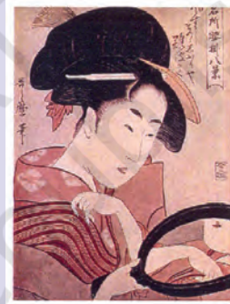
चित्र 3 - कितागावा उतामारो की एक उकियो रचना।

कितागावा उतामारो, 1753 ई. में एदो में पैदा हुए उतामारो ने उकियो (तैरती दुनिया के चित्र) नाम की एक नयी चित्रकला शैली में अहम योगदान किए, जिनमें आम शहरी जीवन का चित्रण किया गया। इनकी छपी प्रतियाँ यूरोप और अमेरिका पहुँची और माने, मोने और वान गॉग जैसे चित्रकारों को प्रभावित किया। त्सुताया जुज़ाबूरो जैसे प्रकाशकों ने विषय चुनकर कलाकारों से उन पर चित्र बनाने का करार किया जाता फिर चित्रकार विषय की रूपरेखा बनाते थे। इसके बाद हुनरमंद वुडब्लॉक शिल्पी चित्रकार द्वारा बनाई गई रूपरेखा को तख़्ती पर चिपकाकर उसकी आकृति को उकेर लेते थे। इस प्रक्रिया में मूल आरेख तो ग़ायब हो जाता था, पर उसकी छपी नक़ल बच जाती थी।