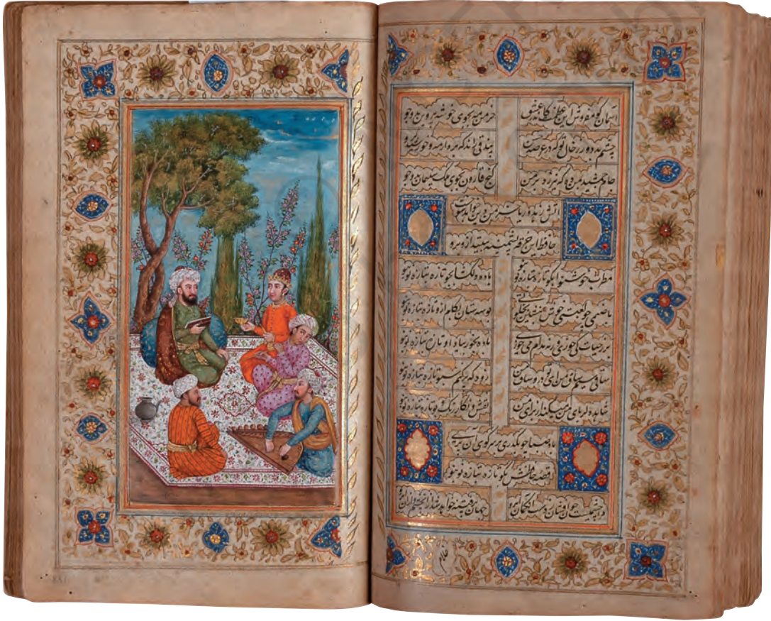
चित्र 15 – हाफ़िज़ के दीवान के कुछ पन्ने, 1824

यह एकोर्डियन शैली में हाथ से लिखी पांडुलिपि का एक नमूना है।