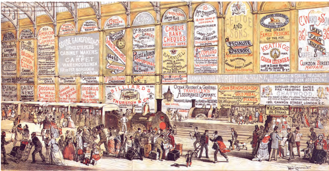
चित्र 13 – इंग्लैंड के एक रेलवे स्टेशन पर लगे विज्ञापन, अल्फ्रेड कॉन्कानेन द्वारा बनाया गया लिथोग्राफ, 1874 छपी हुई सूचनाएँ और इश्तेहार सड़कों की दीवारों, प्लैटफॉर्म और सार्वजनिक इमारतों पर लगाए जाते थे।

चित्र 13 को देखें। ऐसे विज्ञापनों का लोगों के मन पर क्या असर पड़ता होगा? क्या आपको लगता है कि छपी हुई चीज़ को देखकर हर व्यक्ति की एक-जैसी प्रतिक्रिया होती है?