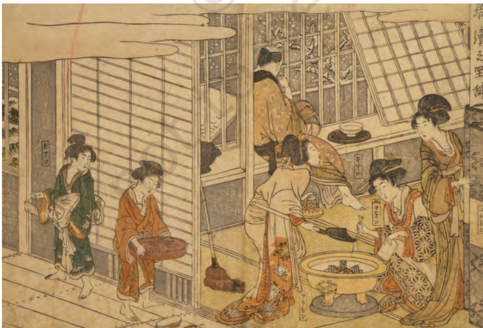
चित्र 4 - सुबह का नज़ारा। रचयिता : शुन्मन कुबो, अठारहवीं सदी के अंत में।