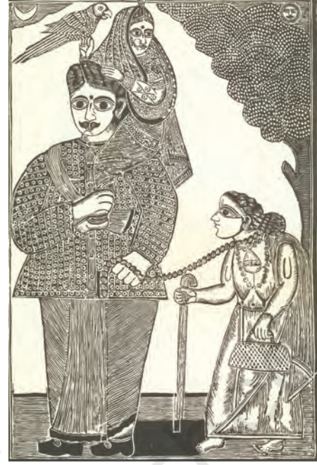
चित्र 19 - घोर कलि (प्रलयकाल), उन्नीसवीं सदी के अंत का रंगीन काष्ठचित्र। पारिवारिक संबंधों के नष्ट-भ्रष्ट होने की कल्पना। पत्नी, जैसा कि मुहावरे में कहा जाता है, पति के सिर पर सवार है। और वह खुद अपनी माँ को जंजीर पहनाकर जानवरों की तरह रखता है।

उन्नीसवीं सदी के मद्रासी शहरों में काफ़ी सस्ती किताबें चौक-चौराहों पर बेची जा रही थीं, जिसके चलते ग़रीब लोग भी बाज़ार से उन्हें ख़रीदने की