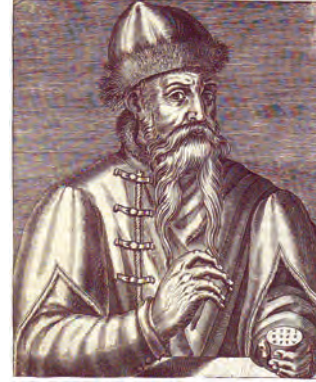
चित्र 5 – योहान गुटेन्बर्ग का चित्र (1584)।

करीब सौ सालों के दरम्यान (1450-1550) यूरोप के ज़्यादातर देशों में छापेखाने लग गए थे। जर्मनी के प्रिंटर या मुद्रक दूसरे देश जाकर नए छापेखाने खुलवाया करते थे। छपाईखाने की संख्या में वृद्धि के साथ-साथ पुस्तक उत्पादन में कमाल की बढ़ोत्तरी हुई। पंद्रहवीं सदी के दूसरे हिस्से में यूरोप के बाज़ार में 2 करोड़ मुद्रित किताबें आईं। यह संख्या सोलहवीं सदी में 20 करोड़ हो गई। हाथ की छपाई की जगह यांत्रिक मुद्रण के आने पर ही मुद्रण क्रांति संभव हुई।