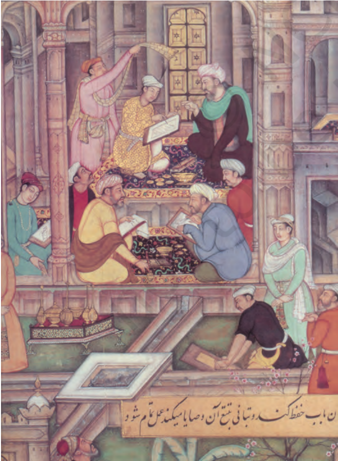
चित्र 1 – प्रिंट के आने से पहले पुस्तक-निर्माण, अख़लाक़-ए-नसीरी, 1595, से।

इस अध्याय में हम मुद्रण के इसी इतिहास को देखेंगे-कैसे यह पूर्वी एशिया से शुरू होकर यूरोप और भारत में फैला। हम मुद्रण तकनीक के प्रसार और प्रभाव को सामाजिक जीवन में आए बदलाव से जोड़कर समझने की कोशिश करेंगे।