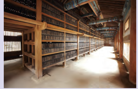
चित्र 2(ख) - त्रिपीटका कोरियाना

13वीं शताब्दी के मध्य में, त्रिपीटका कोरियाना, वुडब्लॉक्स (woodblocks) मुद्रण के रूप में बौद्ध ग्रंथों का कोरियाई संग्रह है। इन ग्रंथों को लगभग 80,000 वुडब्लॉक्स पर उकेरा गया था। इन्हें 2007 में यूनेस्को मेमोरी ऑफ़ द वर्ल्ड रजिस्टर में अंकित किया गया।