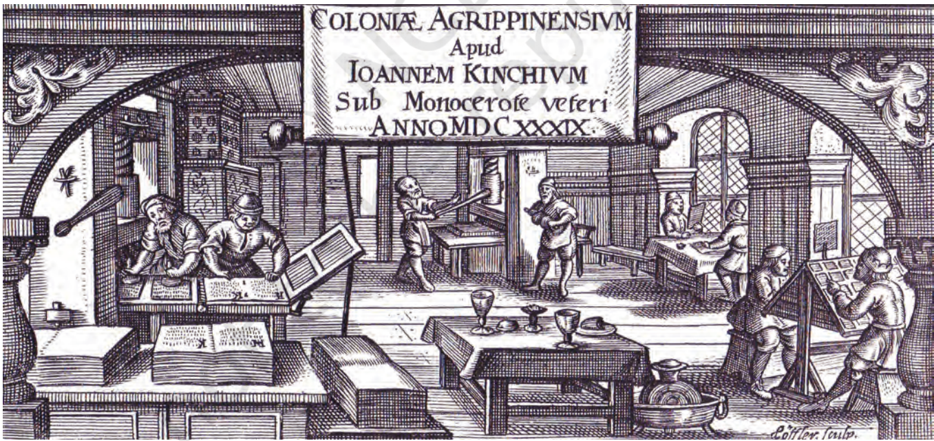
चित्र 8 – एक मुद्रक की वर्कशॉप, सोलहवीं सदी। इस तसवीर से पता चलता है कि सोलहवीं सदी में मुद्रक का कार्यस्थल कैसा दिखायी देता था। सारे काम एक ही छत के नीचे चल रहे हैं। दाएँ छोर पर अगले हिस्से में कम्पोज़ीटर काम कर रहे हैं। बाएँ सिरे पर गैलीज़ तैयार किए जा रहे हैं और धातुई अक्षरों पर स्याही लगाई जा रही है। पृष्ठभूमि में प्रिंटेर्स प्रेस के पेंच कस रहे हैं और उन्हीं के पास प्रूफ़रीडर काम में जुटे हैं। बिलकुल अगले भाग में तैयार माल पड़ा है। ये दो-दो पृष्ठ वाले छपे हुए पन्ने हैं जिनकी बाईंडिंग होनी है।

नए शब्द कम्पोज़ीटर : छपाई के लिए इबारात कम्पोज़ करने वाला व्यक्ति। गैली : धातुई फ़्रेम, जिसमें टाइप बिछाकर इबारात बनाई जाती थी।