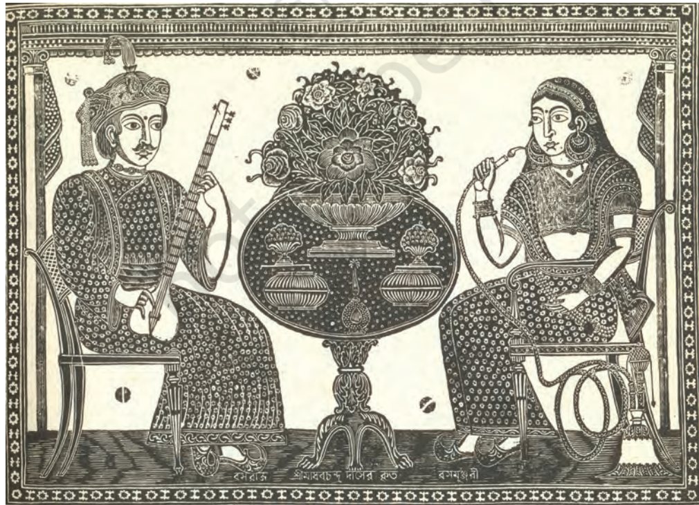
चित्र 20 - एक भारतीय दंपति, सफ़ेद-स्याह काष्ठचित्र। इसमें कलाकार का यह डर उजागर होता है कि पश्चिमी हमले से पारिवारिक व्यवस्था उलट-पुलट गई है। मर्द वीणा बजा रहा है, और औरत हुक्का खींच रही है। उन्नीसवीं सदी में महिलाओं की शिक्षा की पहल के बाद पारंपरिक पारिवारिक भूमिकाओं के छिन्न-भिन्न हो जाने की आशंका तेज़ हो गई।