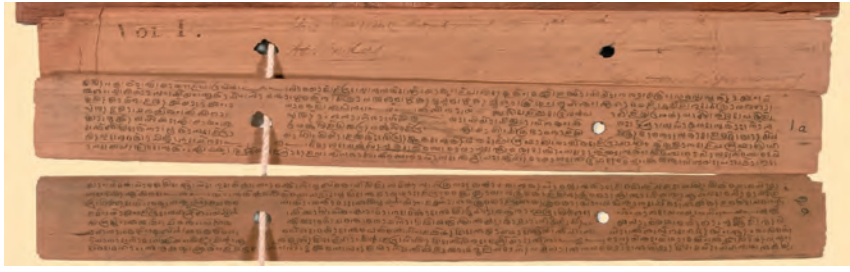
चित्र 16 - ऋग्वेद के कुछ पन्ने।

दैनिक इस्तेमाल नहीं होता था। हालाँकि पूर्व-औपनिवेशिक बंगाल में ग्रामीण क्षेत्रों में प्राथमिक पाठशालाओं का बड़ा जाल था, लेकिन विद्यार्थी आमतौर पर किताबें नहीं पढ़ते थे। गुरु याददाश्त से किताबें सुनाते थे, और विद्यार्थी उन्हें लिख लेते थे। इस तरह कई-सारे लोग बिना कोई किताब पढ़े साक्षर बन जाते थे।