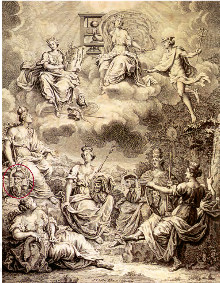
चित्र 9 – जे.वी. श्ले, लाम्प्रीमेरी (छपाखाना) 1739

छपे हुए लोकप्रिय साहित्य के बल पर कम शिक्षित लोग धर्म की अलग-अलग व्याख्याओं से परिचित हुए। सोलहवीं सदी की इटली के एक