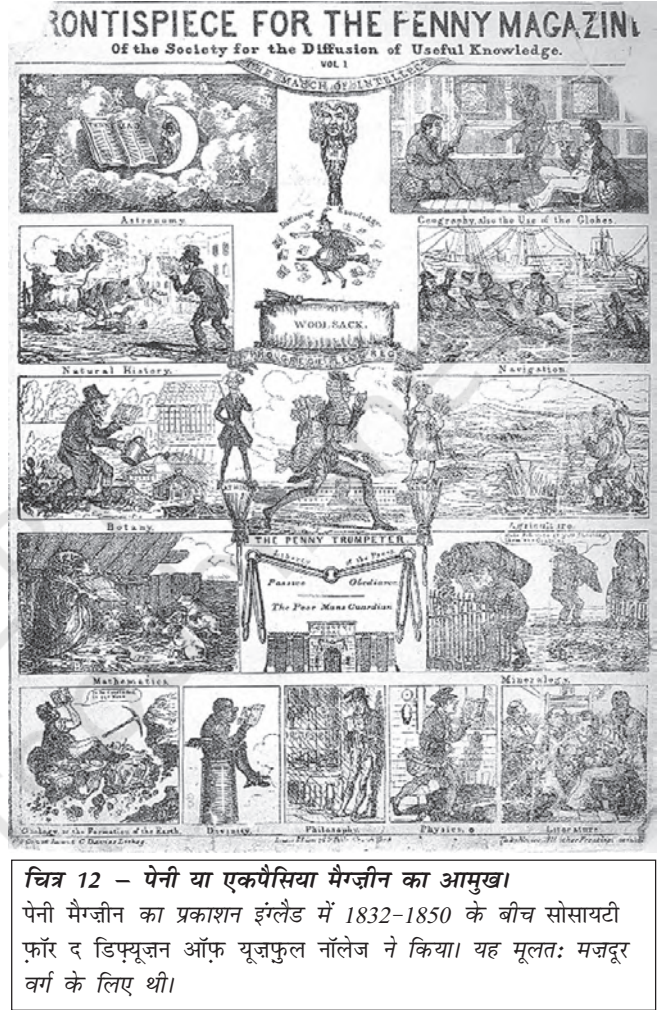
चित्र 12 – पेनी या एकपैसिया मैगज़ीन का आमुख। पेनी मैगज़ीन का प्रकाशन इंग्लैंड में 1832-1850 के बीच सोसायटी फॉर द डिफ्यूजन ऑफ यूज़फुल नॉलेज ने किया। यह मूलतः मजदूर वर्ग के लिए थी।

अठारहवीं सदी के अंत तक प्रेस धातु से बनने लगे थे। पूरी उन्नीसवीं सदी के दौरान छापेखाने की तकनीक में लगातार सुधार हुए। उन्नीसवीं सदी के