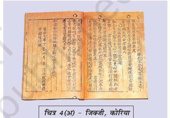
चित्र 4(अ) - जिकजी, कोरिया

वेलम (Vellum) : चर्म-पत्र या जानवरों के चमड़े से बनी लेखन की सतह।