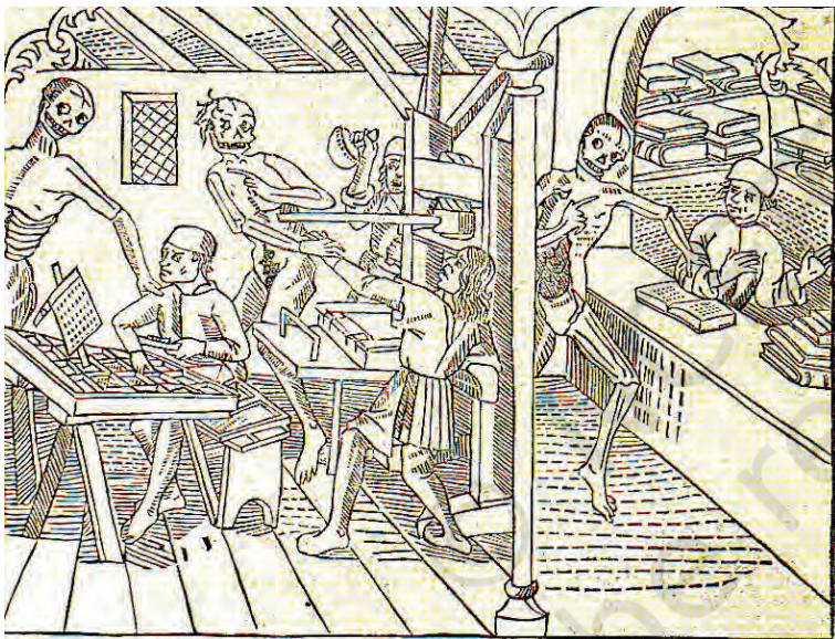
चित्र 10 - द मैकबेर डान्स (वीभत्स नाच)।

किसान मेनोकियो ने अपने इलाके में उपलब्ध किताबों को पढ़ना शुरू कर दिया था। उन किताबों के आधार पर उसने बाइबिल के नए अर्थ लगाने शुरू कर दिए, और उसने ईश्वर और सृष्टि के बारे में ऐसे विचार बनाए कि रोमन कैथलिक चर्च उससे क्रुद्ध हो गया। ऐसे धर्म-विरोधी विचारों को दबाने के लिए रोमन चर्च ने जब इन्क्वीज़ीशन (धर्म-द्रोहियों को दुरुस्त करने वाली संस्था) शुरू किया तो मेनोकियो को दो बार पकड़ा गया और आखिरकार उसे मौत की सज़ा दे दी गई। धर्म के पास ऐसे पाठ और उस पर उठाए जा रहे सवाल से परेशान रोमन चर्च ने प्रकाशकों और पुस्तक-विक्रेताओं पर कई तरह की पाबंदियाँ लगाई, और 1558 ई. से प्रतिबंधित किताबों की सूची रखने लगे।