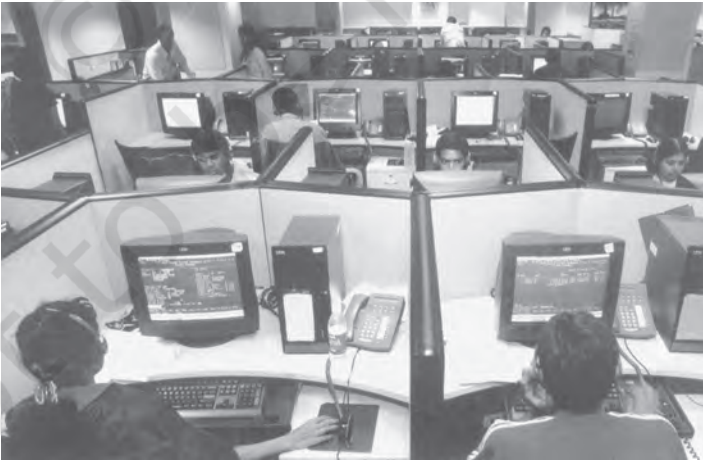
चित्र 3.2 सूचना प्रौद्योगिकी उद्योग का भारत के निर्यात में प्रमुख योगदान

औचित्य नहीं है, क्योंकि विश्व व्यापार का अधिकांश भाग तो विकसित देशों के बीच ही होता है। उनका यह भी मानना है कि विकसित देश अपने देशों में जहाँ कृषि सहायिकी दिये जाने को लेकर शिकायत करते हैं, वहीं विकासशील देश अपने बाजारों को विकसित देशों के लिए खोले जाने को मजबूर करने को लेकर छला हुआ महसूस करते हैं। वे देश विकासशील देशों को अपने बाजारों में किसी न किसी बहाने प्रवेश करने से रोकने का प्रयास भी करते रहते