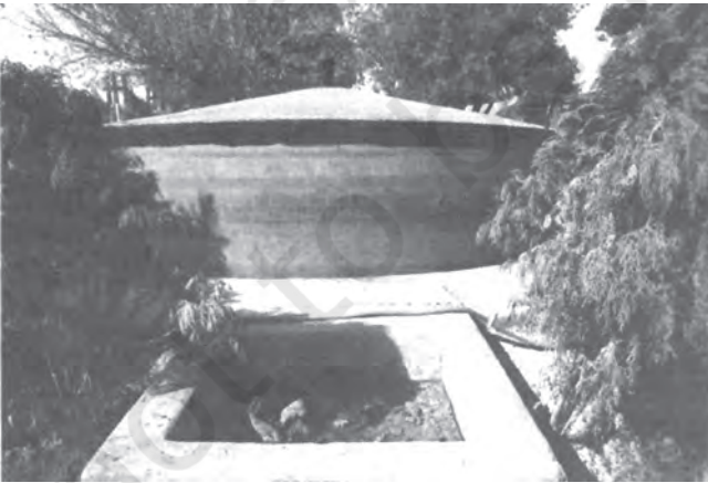
चित्र 7.4 गोबर गैस संयंत्र में ईंधन उत्पादन के लिए गोबर का प्रयोग

ऊर्जा के गैर पारंपरिक स्रोतों का उपयोग : जैसा कि आप जानते हैं कि भारत अपनी विद्युत आवश्यकताओं के लिए थर्मल और हाइड्रो पावर संयंत्रों पर बहुत अधिक निर्भर है। इन दोनों का पर्यावरण पर प्रतिकूल प्रभाव पड़ता है। थर्मल पावर संयंत्र बड़ी मात्रा में कार्बन-डाइऑक्साइड का उत्सर्जन करते हैं, जो एक ग्रीन हाउस गैस है। थर्मल पावर प्लांटों से बड़ी मात्रा में धुएँ के रूप में राख भी निकलती है, जिसका उचित उपयोग न हो तो जल, भूमि और पर्यावरण के अन्य संघटकों के प्रदूषण का कारण हो सकता है। जल-विद्युत परियोजनाओं से वन जलमग्न हो जाते हैं और नदी प्रवाह क्षेत्रों तथा नदी की घाटियों के प्राकृतिक प्रवाह में हस्तक्षेप करते हैं। वायु शक्ति और सौर किरणें पारंपरिक ऊर्जा के अच्छे उदाहरण हैं। हाल के वर्षों में, इन ऊर्जा संसाधनों का लाभ उठाने के लिए कुछ प्रयास किए जा रहे हैं। अपने क्षेत्र में स्थापित किसी भी इकाई का विवरण एकत्र करें (यदि कोई हो) और कक्षा में चर्चा करें।