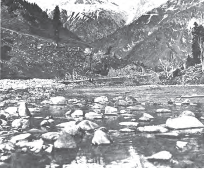
चित्र 7.1 ताजा पानी के कुछ स्रोत जो प्रदूषण रहित हैं

पर्यावरण इन कार्यों को बिना किसी व्यवधान के तभी कर सकता है, जब तक कि ये कार्य उसकी धारण क्षमता की सीमा में हैं। इसका अर्थ है कि संसाधनों का निष्कर्षण इनके पुनर्जनन की दर से अधिक नहीं है और उत्पन्न अवशेष पर्यावरण की समावेशन क्षमता के भीतर है। जब