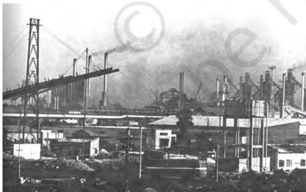
चित्र 7.2 दमोदर घाटी भारत के सर्वाधिक औद्योगिक क्षेत्रों में एक है। भारी उद्योगों से प्रदूषणकारी तत्व दामोदर नदी के किनारे जमा होकर पर्यावरण-संकट उत्पन्न कर रहे हैं

और सेवाएँ उनकी पूर्ति से बहुत कम थी। इसका अर्थ हुआ कि प्रदूषण, पर्यावरण की अवशोषी क्षमता के भीतर था और संसाधन निष्कर्षण की दर इन संसाधनों के पुनः सर्जन की दर से कम थी। इसलिए, पर्यावरण समस्याएँ उत्पन्न नहीं हुई थी। लेकिन, जनसंख्या विस्फोट और जनसंख्या की बढ़ती हुई आवश्यकताओं की पूर्ति के लिए औद्योगिक क्रांति के आगमन से स्थिति बदल गई। परिणामस्वरूप उत्पादन और उपभोग के लिए संसाधनों की माँग संसाधनों की पुनः सर्जन की दर से बहुत अधिक हो गई; पर्यावरण की अवशोषी क्षमता पर दबाव बुरी तरह से बढ़ गया। यह प्रवृत्ति आज भी जारी है। इस तरह से, पर्यावरण की गुणवत्ता के मामले में