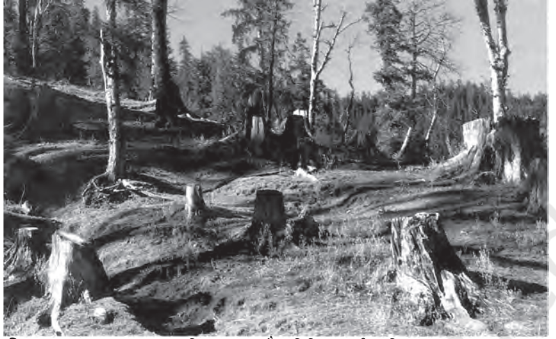
चित्र 7.3 वन-कटाव द्वारा भूमि अपक्षय, जैव विविधता की क्षति तथा वायु प्रदूषण

माँग-पूर्ति संबंध पूरी तरह से उलट गये हैं—अब हमारे सामने पर्यावरण संसाधनों और सेवाओं की माँग अधिक है, लेकिन उनकी पूर्ति सीमित है। जिसके कारण अधिक उपयोग और दुरुपयोग हैं। इसीलिए, अवशिष्ट सृजन और प्रदूषण के पर्यावरण मुद्दे आजकल बहुत गंभीर हो गये हैं।