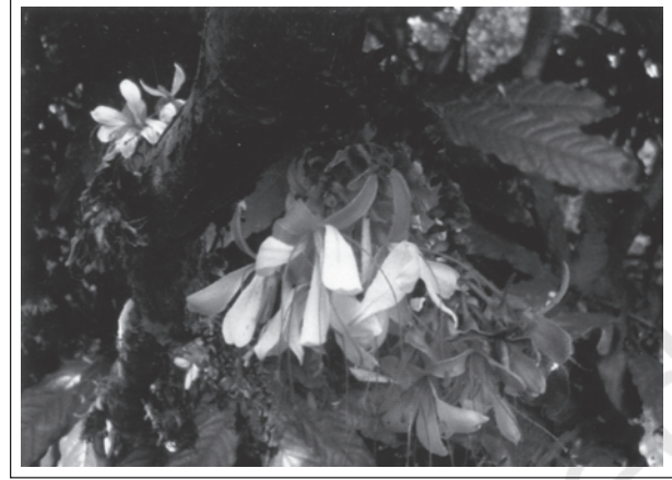
चित्र 14.3: हमबोशिया डेकरेंस बेड- दक्षिण पश्चिमी घाट ( भारत ) की एक दुर्लभ प्रजाति

मानव के अस्तित्व के लिए जैव-विविधता अति आवश्यक है। जीवन का हर रूप एक दूसरे पर इतना निर्भर है कि किसी एक प्रजाति पर संकट आने से दूसरों में असंतुलन की स्थिति पैदा हो जाती है। यदि पौधों और प्राणियों की प्रजातियाँ संकटापन्न होती हैं, तो इससे पर्यावरण में गिरावट उत्पन्न होती है और अन्ततोगत्वा मनुष्य का अपना अस्तित्व भी खतरे में पड़ सकता है।