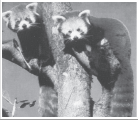
चित्र 14.2: रेड पांडा - एक संकटापन्न प्रजाति

विश्व की सभी संकटापन्न प्रजातियों के बारे में (Red list) रेड लिस्ट के नाम से सूचना प्रकाशित करता है।