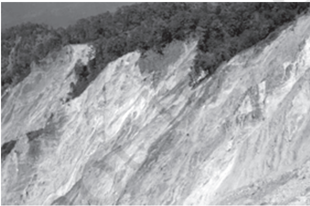
चित्र 5.3 : भारत-नेपाल सीमा, उत्तर प्रदेश में शारदा नदी के निकट शिवालिक हिमालय शृंखलाओं में भूस्खलन स्कार

ढाल, जिसपर संचलन होता है, के संदर्भ में पश्च-आवर्तन (Rotation) के साथ शैल-मलवा की एक या कई इकाइयों के फिसलन (Slipping) को अवसर्पण कहते हैं। पृथ्वी के पिंड के पश्च-आवर्तन के बिना मलवा का तीव्र लोटन (Rolling) या स्खलन मलवा स्खलन कहलाता है। मलवा स्खलन में खड़े (Vertical) या प्रलंबी फलक (Face) से मिट्टी मलवा का प्रायः स्वतंत्र पतन होता है। संस्तर जोड़ या भ्रंश के नीचे पृथक शैल बृहत् के स्खलन को शैल