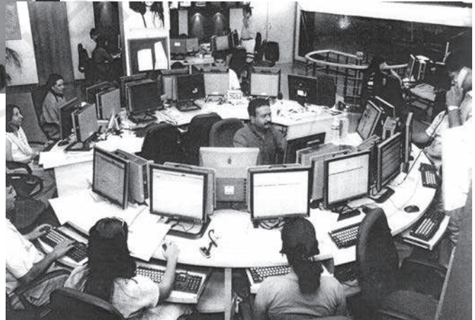
21वीं सदी का दूरदर्शन समाचार कक्ष, भारत

औद्योगिक क्रांति के साथ ही, मुद्रण उद्योग का भी विकास हुआ। कुलीन मुद्रणालय के प्रथम उत्पाद साक्षर अभिजात लोगों तक ही सीमित थे। तत्पश्चात् 19वीं सदी के मध्य भाग में आकर जब प्रौद्योगिकियों, परिवहन और साक्षरता में और आगे विकास हुआ, तभी समाचारपत्र जन-जन तक पहुँचने लगे। देश के विभिन्न क्षेत्रों में रहने वाले लोगों को एक जैसे समाचार पढ़ने या सुनने को मिलने लगे। ऐसा कहा जाता है कि इसी के फलस्वरूप देश के विभिन्न भागों में रहने वाले लोग परस्पर जुड़े