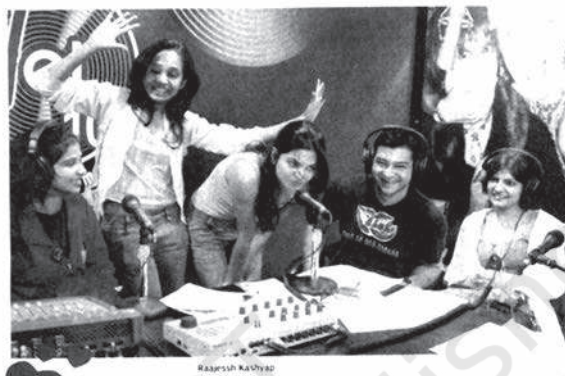
रेडियो गा गा

But what has made RJ-ing the coolest choice? Perhaps, it is the rising level of awareness among youngsters, who want something more and extraordinary when it comes to career. No run of the mill stuff for them because they are willing to risk and experiment. As actress Preity Zinta, who was an RJ in