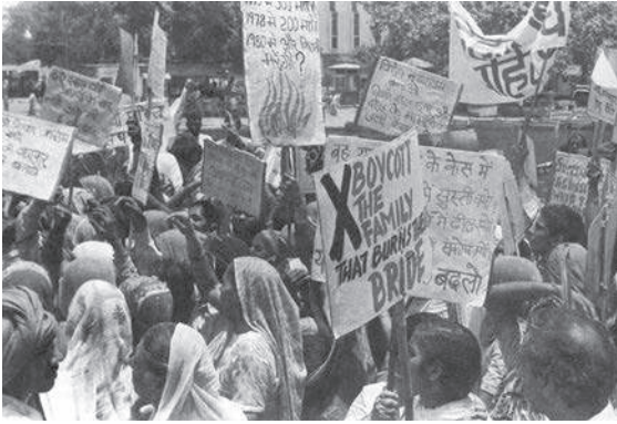
दहेज विरोधी संघर्ष