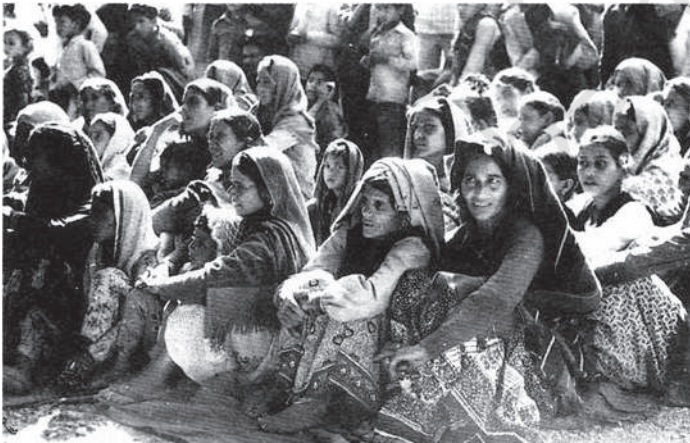
सकलाना में विश्व पर्यावरण दिवस पर एकत्र हुए चिपको आंदोलनकारी, 1986

आधुनिक काल के अधिकतर भाग में सर्वाधिक जोर विकास पर दिया गया है। दशकों से प्राकृतिक संसाधनों के अनियंत्रित उपयोग तथा विकास के ऐसे प्रतिरूप के निर्माण में, जिससे पहले से ही घटते प्राकृतिक संसाधनों के अधिक शोषण की माँग बढ़ती है, के विषय में बहुत चिंता प्रकट की जाती रही है। विकास के इस प्रतिरूप की इसलिए भी आलोचना हुई है, क्योंकि यह मानता है कि विकास से सभी वर्गों के लोग लाभान्वित होंगे। यथा बड़े बाँध लोगों को उनके घरों और जीवनयापन के स्रोतों से अलग कर देते हैं और उद्योग, कृषकों को उनके घरों और आजीविका से। औद्योगिक प्रदूषण के प्रभाव की एक और ही कहानी है। यहाँ हम पारिस्थितिकीय आंदोलन से जुड़े विभिन्न मुद्दों को जानने के लिए उसका केवल एक उदाहरण ले रहे हैं।