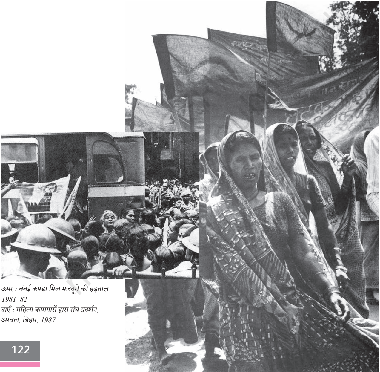
ऊपर : बंबई कपड़ा मिल मजदूरों की हड़ताल 1981-82 दाएँ : महिला कामगारों द्वारा संघ प्रदर्शन, अरवल, बिहार, 1987

हालाँकि मजदूर संघ बाद में बने लेकिन कामगारों ने विरोध पहले भी किया। उस वक्त उनकी कार्यवाही संपोषित के स्थान पर स्वतःस्फूर्त ज्यादा थी। कुछ राष्ट्रवादी नेताओं ने उपनिवेश विरोधी आंदोलन में मजदूरों को भी शामिल किया। युद्ध से देश में उद्योगों का विस्तार हुआ, लेकिन इससे लोगों की पेशानी भी बहुत बढ़ी। वहाँ खाने की कमी हो गई और कीमतें बहुत तेजी से बढ़ीं। वहाँ बंबई (मुंबई) की कपड़ा मिलों में हड़तालों की एक लहर चली। सितंबर-अक्तूबर 1917 में करीब 30 प्रामाणिक हड़तालें हुईं। कलकत्ता के पटसन कामगारों ने काम रोका। मद्रास की बंकिधम और कर्नाटक (बिन्नी की) की मिल के कामगारों ने वेतन