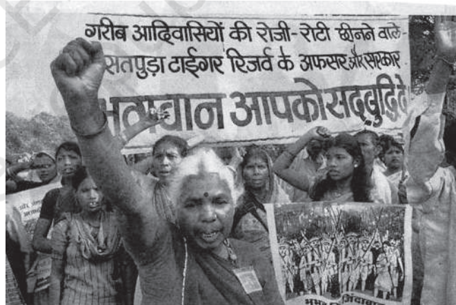
जनजातीय लोगों का संघर्ष जारी

देश भर में फैले विभिन्न जनजातीय समूहों के मुद्दे समान हो सकते हैं, लेकिन उनके विभेद भी उतने ही महत्वपूर्ण हैं। जनजातीय आंदोलनों में से कई अधिकांश रूप से मध्य भारत की तथाकथित ‘जनजातीय बेल्ट’ में स्थित रहे हैं जैसे— छोटानागपुर व संथाल परगना में स्थित संथाल, हो, ओरांव व मुंडा। नए गठित हुए झारखंड प्रदेश का मुख्य भाग इन्हीं से बना है। हमारे लिए विभिन्न आंदोलनों के बारे में विस्तृत विवरण देना संभव नहीं है। हम उदाहरण के रूप में झारखंड की चर्चा करेंगे जहाँ जनजातीय आंदोलन का इतिहास सौ वर्ष पुराना है। हम पूर्वोत्तर राज्यों के जनजातीय आंदोलनों की विशिष्टताओं के बारे में भी संक्षिप्त में चर्चा करेंगे परंतु इनकी भी विस्तृत विवेचना संभव नहीं है क्योंकि एक ही क्षेत्र में जनजातीय आंदोलन के विभिन्न स्वरूप विद्यमान हो सकते हैं।