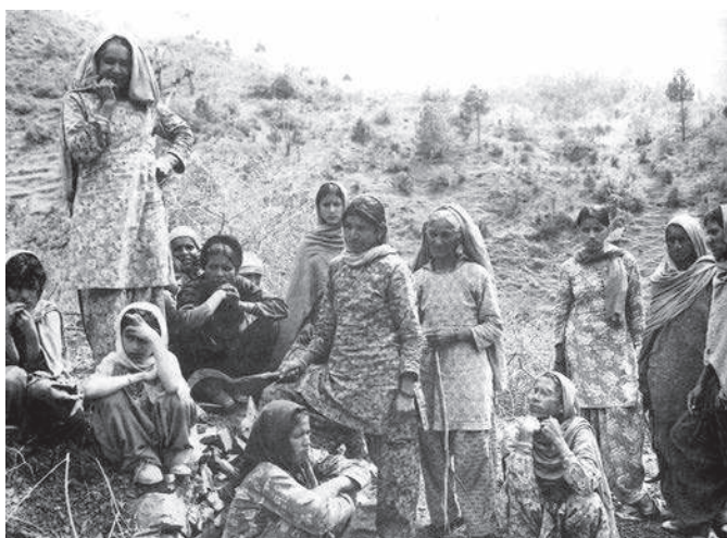
वन विनाश पर विचार विमर्श करते हुए, जूनागढ़, हिमाचल प्रदेश

अन्य दैनिक आवश्यकताओं के लिए जंगलों पर निर्भर थे। इस संघर्ष ने गरीब गाँववासियों को आजीविका की आवश्यकताओं को बेचकर राजस्व कमाने की सरकार की इच्छा के समक्ष खड़ा कर दिया। जीवन-निर्वहन की अर्थव्यवस्था, मुनाफ़े (लाभ) की अर्थव्यवस्था के विपरीत खड़ी थी। सामाजिक असमानता के इस मुद्दे (जिसमें गाँववासियों के समक्ष वाणिज्यिक तथा पूँजीवादी हितों का प्रतिनिधित्व करने वाली सरकार थी) के साथ चिपको आंदोलन ने पारिस्थितिकीय सुरक्षा के मुद्दे को भी उठाया। प्राकृतिक जंगलों का काटा जाना पर्यावरणीय विनाश का एक रूप था जिसके परिणामस्वरूप क्षेत्र में विनाशकारी बाढ़ तथा भूस्खलन हुए। गाँववासियों के लिए ये 'लाल' तथा 'हरे' मुद्दे अन्तःसंबद्ध थे। जबकि उनकी उत्तरजीविता जंगलों के जीवन पर निर्भर थी। वे जंगलों का सबको लाभ देने वाली पारिस्थितिकीय संपदा के रूप में भी आदर करते थे। इसके साथ ही चिपको आंदोलन ने सुदूर मैदानी क्षेत्रों में स्थित सरकार के मुख्यालय जो उनकी चिंताओं के प्रति उदासीन तथा विरुद्ध प्रतीत होता था, के विरुद्ध पर्वतीय गाँववासियों के रोष को भी