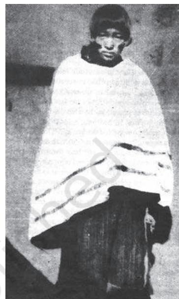
उत्तरी पहाड़ियों की एक महिला नाम गुफिआलो सविनय अवज्ञा आंदोलन में भाग लेकर मशहूर हुईं।

एक मुद्दा जो प्रायः उठाया जाता है कि यदि 1947 से पहले महिला आंदोलन एक सक्रिय आंदोलन था, तो बाद में उसका क्या हुआ। इसकी एक व्याख्या यह दी जाती है कि राष्ट्रीय आंदोलन में भाग लेने वाली बहुत सी महिला प्रतिभागी राष्ट्र निर्माण के कार्य में संलग्न हो गईं। दूसरे लोग विभाजन के आघात को इस ठहराव का उत्तरदायी मानते हैं।