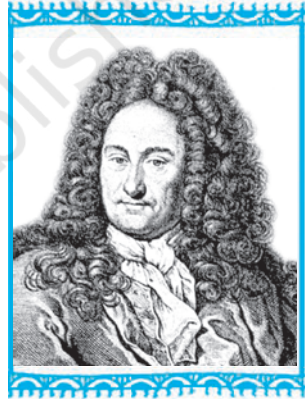
G .W. Leibnitz (1646–1716)