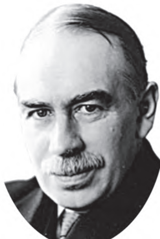
जॉन मेनार्ड कीन्स

ब्रिटिश अर्थशास्त्री जॉन मेनार्ड कीन्स का जन्म 1883 में हुआ था। उनकी शिक्षा किंग्स कॉलेज, कैंब्रिज यूनाइटेड किंगडम में हुई थी और बाद में 'विशेषज्ञ' के रूप में नियुक्त हुए। प्रथम विश्व युद्ध के वर्षों में वे तीक्ष्ण विद्वता के अलावा सक्रिय अंतर्राष्ट्रीय राजनायिक के रूप में भी जुड़े रहे। अपनी पुस्तक 'इकोनॉमिक कंसीक्वेसेज ऑफ द पीस' (1919) में युद्ध की शांति समझौते के भंग होने की भविष्याणी इन्होंने कर दी थी। उनकी पुस्तक 'जनरल थ्योरी ऑफ इंफ्लायमेंट, इंटेरेस्ट एंड मनी' (1936) बीसवीं सदी की अर्थशास्त्र की महत्वपूर्ण पुस्तकों में से एक है। कीन्स विदेशी मुद्रा के समझदार सट्टेबाज थे।