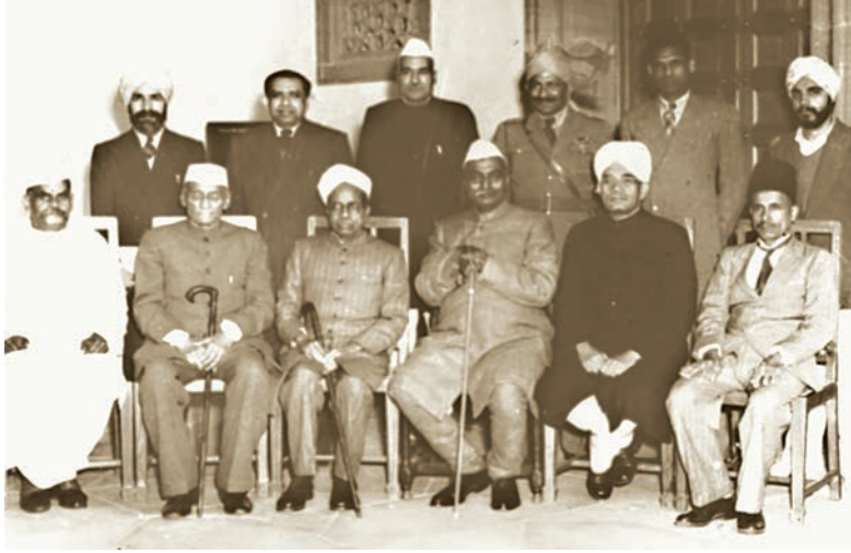
भारत का संविधान लिखने वाली समिति के कुछ सदस्य

थी कि वह गरीबों और मुख्यधारा से अलग-थलग पड़ गए समुदायों को इस समानता के अधिकार के फायदे दिलवाने के लिए विशेष कदम उठाए।