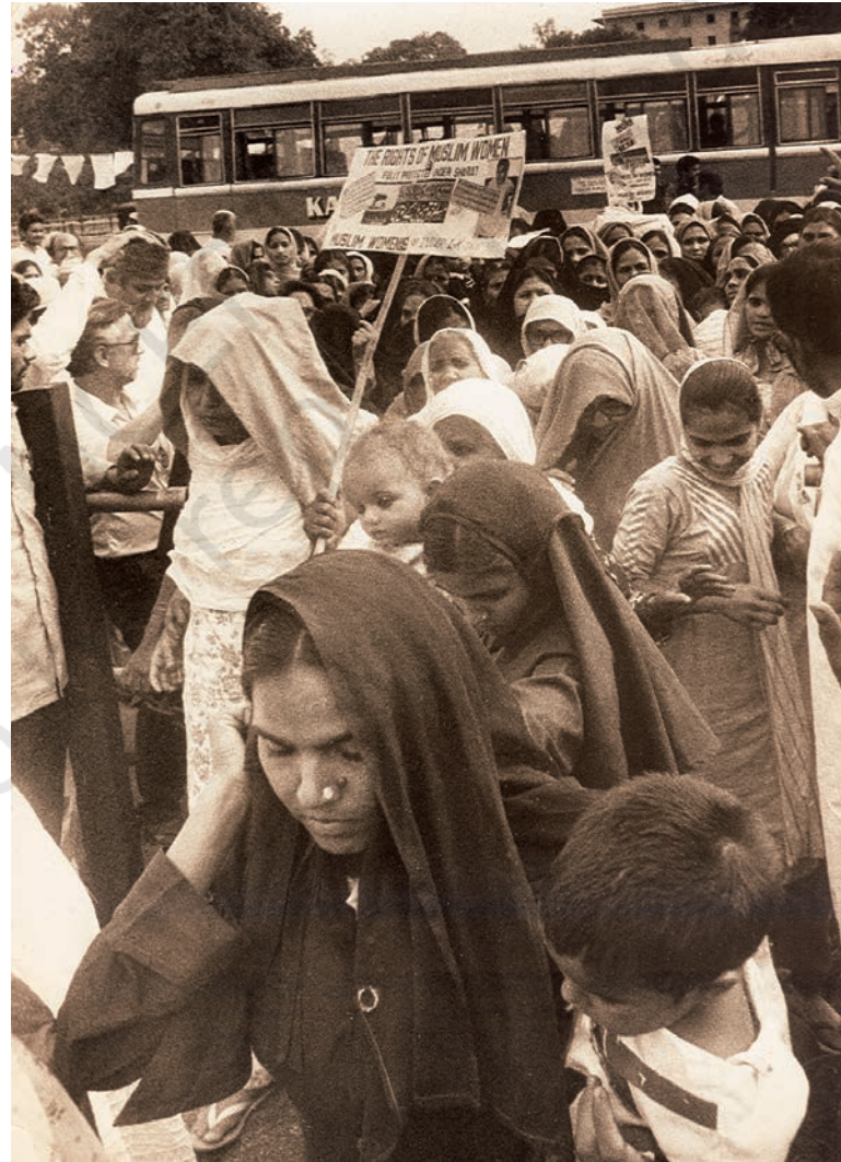
अपने अधिकारों की माँग करती हुई औरतें

है जो हम सभी को एक भारतीय के रूप में जोड़ती है। प्रत्येक व्यक्ति को समान अधिकार और समान अवसर प्राप्त हैं। अस्पृश्यता यानी छुआछूत को अपराध की तरह देखा जाता है और इसे कानूनी रूप से खत्म कर दिया गया है। लोग अपनी पसंद का काम चुनने के लिए बिल्कुल आज़ाद हैं। नौकरियाँ सभी लोगों के लिए खुली हुई हैं। इन सबके अलावा संविधान ने सरकार पर यह विशेष ज़िम्मेदारी डाली