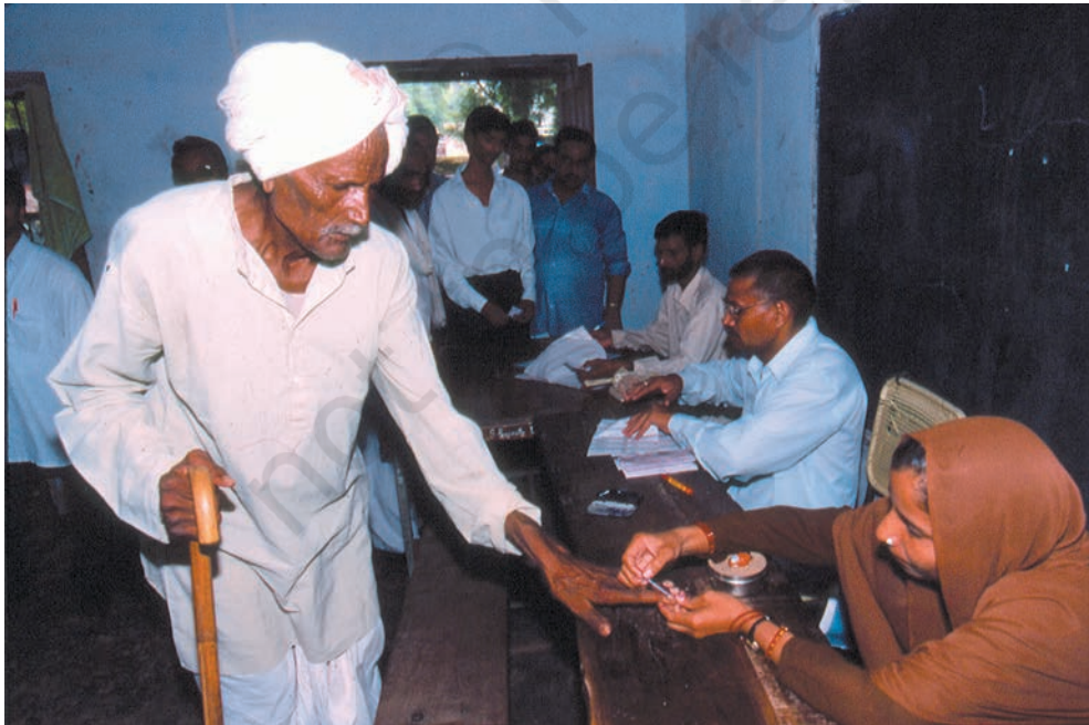
मतदान के समय मतदाता की उँगली पर स्याही से निशान लगाया जाता है ताकि वह केवल एक वोट दे सके— ग्रामीण मतदान केंद्र का दृश्य

लोकतंत्र में मूलभूत विचार यह है कि लोग नियमों को बनाने में भागीदार बनकर खुद ही शासन करें। आज के समय में लोकतांत्रिक सरकार को प्रायः प्रतिनिधि लोकतंत्र कहते हैं। प्रतिनिधि लोकतंत्र में लोग सीधे