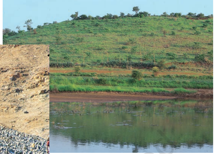
जल संवर्धन विकास कार्यक्रम ने केवल दो वर्षों में इस बंजर ज़मीन को हरे-भरे मैदान में बदल दिया है

पंचायती राज व्यवस्था एक ऐसी प्रक्रिया है जिसके द्वारा लोग अपनी सरकार में भाग लेते हैं। ग्रामीण क्षेत्रों में ग्राम पंचायत लोकतांत्रिक सरकार का पहला स्तर है। ग्राम पंचायत ग्राम सभा के प्रति जवाबदेह होती है क्योंकि ग्राम सभा के लोग ही उसको चुनते हैं।