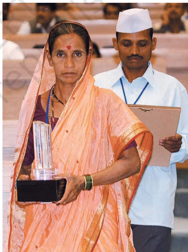
महाराष्ट्र के दो पंच, जिन्हें 2005 में अपनी पंचायत में उल्लेखनीय काम करने के लिए 'निर्मल ग्राम पुरस्कार' से सम्मानित किया गया।

ग्राम पंचायत की नियमित रूप से बैठक होती है। उसका मुख्य काम उसके क्षेत्र में आने वाले गाँवों में विकास कार्यक्रम लागू करवाना होता है। जैसा कि आपने देखा ग्राम सभा ही पंचायत के काम को स्वीकृति देती है तभी पंचायत अपना काम कर पाती है।