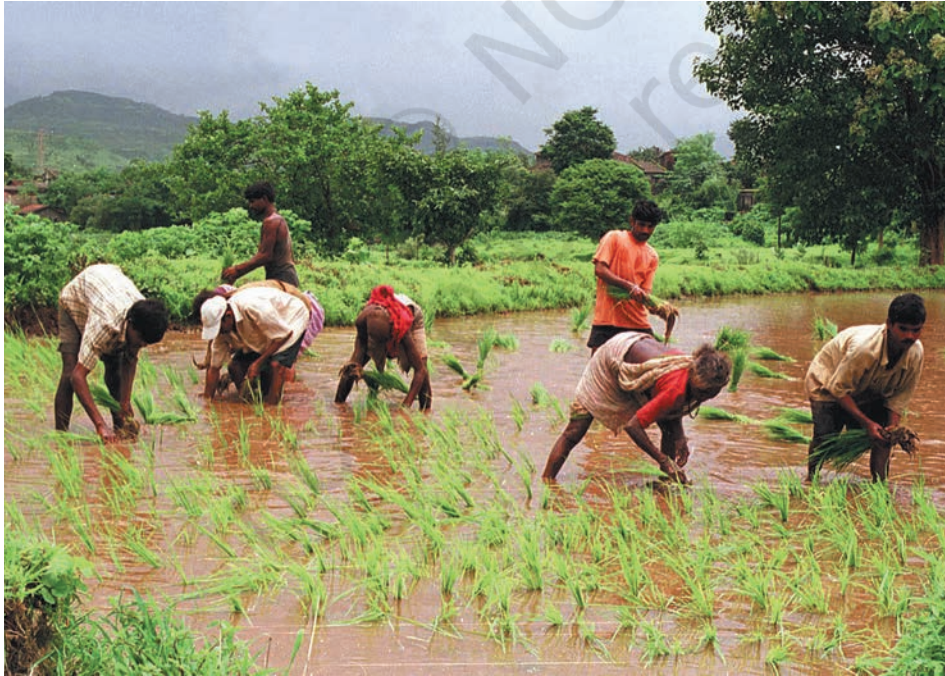
धान की रोपाईं कमरतोड़ काम होता है

कलपट्टु में कुछ लोग नर्स, शिक्षक, धोबी, बुनकर, नाई, साइकिल ठीक करने वाले और लोहार के रूप में अपनी सेवाएँ देते हैं। यहाँ कुछ दुकानदार एवं व्यापारी भी हैं। जो मुख्य गली है वह बाज़ार की तरह दिखती है। उसमें आपको तरह-तरह की कई छोटी दुकानें दिखेंगी, जैसे — चाय, सब्जी, कपड़े की दुकान तथा दो दुकानें बीज और खाद की। चार दुकानें चाय की हैं जहाँ 'टिफ़िन' भी मिलता है। यहाँ