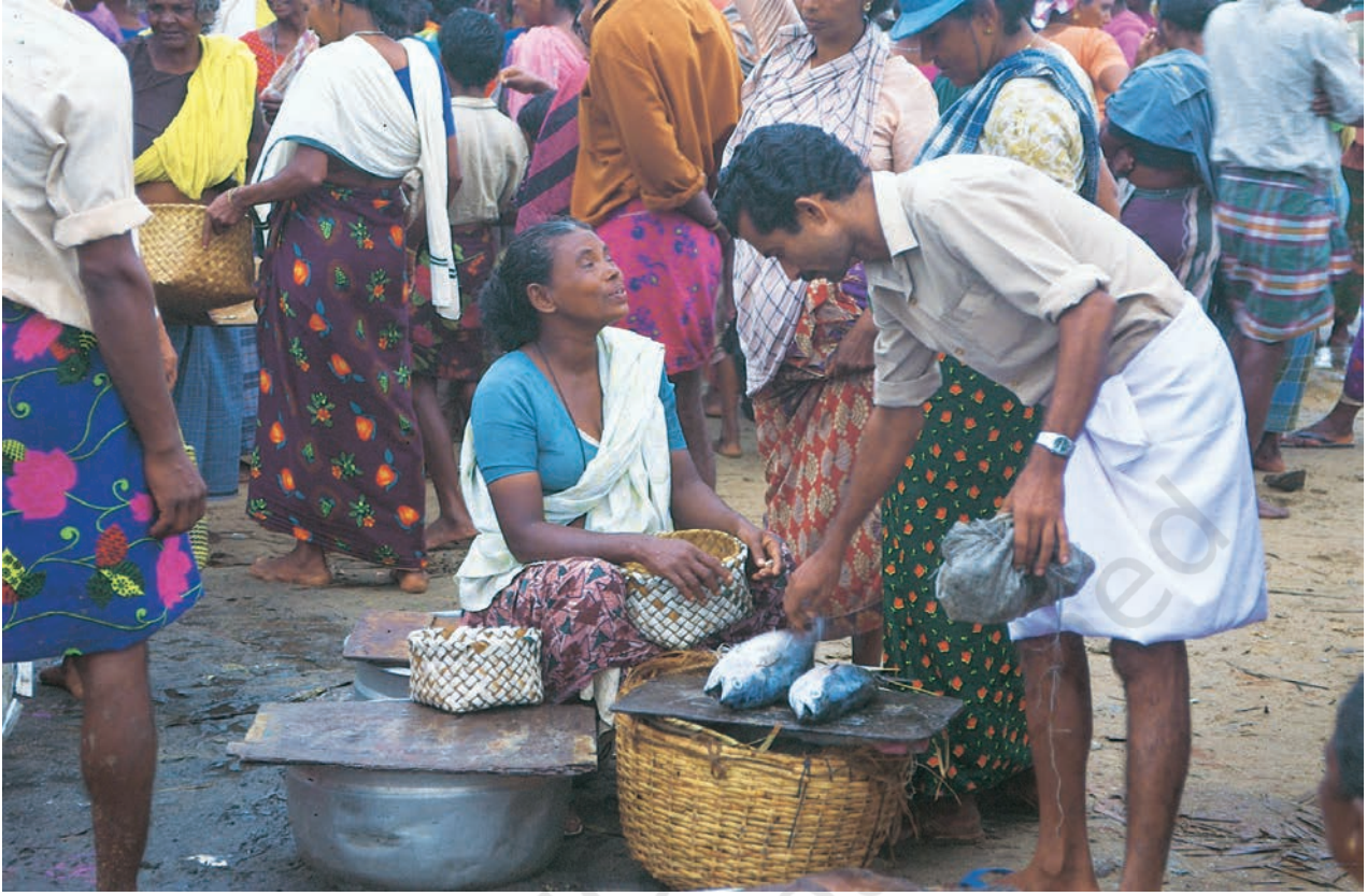
स्थानीय बाज़ार में मछलियाँ बेचती हुई मछुआरिनें