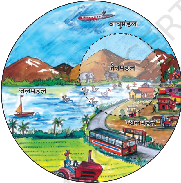
चित्र 1.2 : पर्यावरण के क्षेत्र

स्थलमंडल वह क्षेत्र है, जो हमें वन, कृषि एवं मानव बस्तियों के लिए भूमि, पशुओं को चरने के लिए घासस्थल प्रदान करता है। यह खनिज संपदा का भी एक स्रोत है।