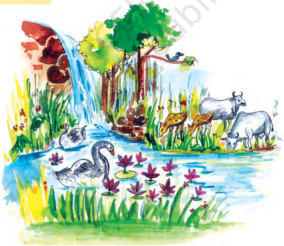
चित्र 1.3 : एक ताल का पारितंत्र

तभी जैसलमेर के रहने वाले हीरा ने आश्चर्य से कहा, “हमारे यहाँ वर्षा होती ही नहीं है। हमें तो दूर-दूर तक केवल कीकर एवं रेत ही नज़र आती है।” “लेकिन वहाँ ऊँट भी तो मिलते हैं,” रवि ने कहा।