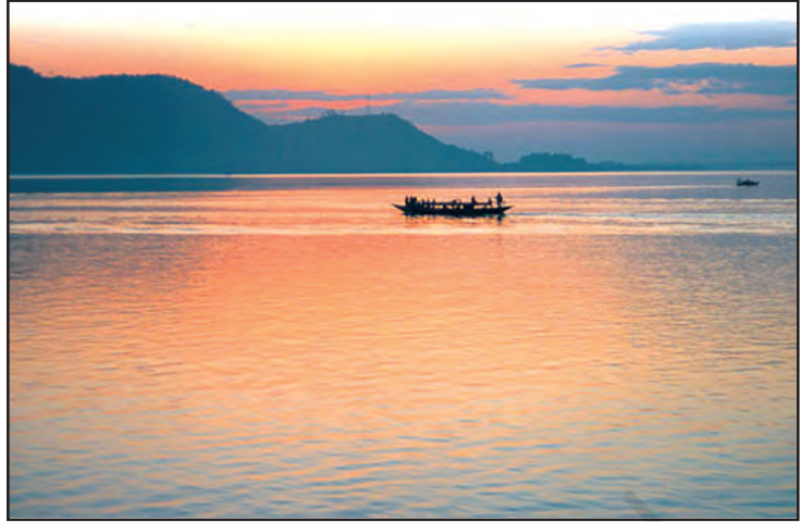
चित्र 6.7 : ब्रह्मपुत्र नदी

गंगा एवं ब्रह्मपुत्र के मैदान, पर्वत एवं हिमालय के गिरिपाद तथा सुंदरवन डेल्टा