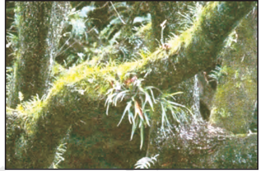
चित्र 6.3 : अमेज़न वन

इन प्रदेशों में अत्यधिक वर्षा के कारण यहाँ की भूमि पर सघन वन उग जाते हैं (चित्र 6.3)। वन इतने सघन होते हैं कि पत्तियों तथा शाखाओं से 'छत' सी बन जाती है जिसके कारण सूर्य का प्रकाश धरातल तक नहीं पहुँच पाता है। यहाँ की भूमि प्रकाश रहित एवं नम बनी रहती है। यहाँ केवल वही वनस्पति पनप सकती है जिसमें छाया में बढ़ने की क्षमता हो। परजीवी पौधों के रूप में यहाँ आर्किड एवं ब्रोमिलायड पैदा होते हैं।