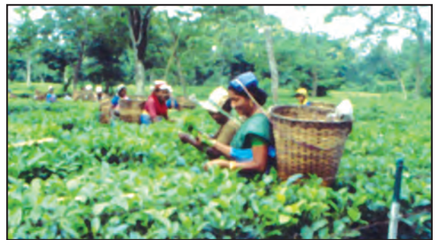
चित्र 6.10 : असम में चाय बागान