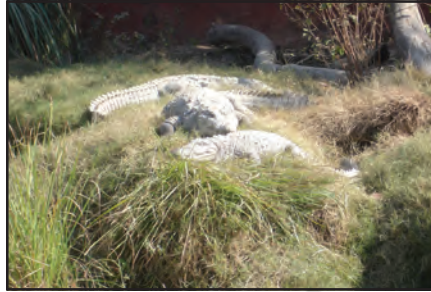
चित्र 6.12 : मगर