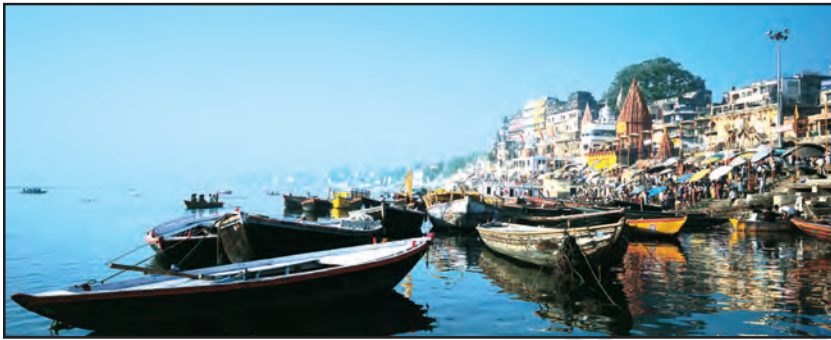
चित्र 6.13 : गंगा नदी के तट पर स्थित वाराणसी शहर

गंगा-ब्रह्मपुत्र के मैदानों में कई बड़े शहर एवं कस्बे स्थित हैं। इलाहाबाद, कानपुर, वाराणसी, लखनऊ, पटना एवं कोलकाता जैसे 10 लाख से अधिक आबादी वाले शहर गंगा नदी के तट पर ही स्थित हैं (चित्र 6.13)। इन शहरों तथा यहाँ स्थित उद्योगों का गंदा पानी बहकर नदी में ही जाता है जिससे नदी प्रदूषित होती है।