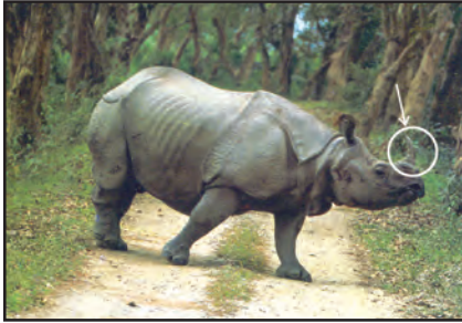
चित्र 6.11 : एक सींग वाला गैंडा

बेसिन में विविध प्रकार के वन्यजीव पाए जाते हैं। इनमें हाथी, बाघ, हिरण एवं बंदर आदि सामान्य रूप से पाए जाने वाले जीव हैं। एक सींग वाला गैंडा ब्रह्मपुत्र के मैदानों में पाया जाता है (चित्र 6.11)। डेल्टा क्षेत्र में बंगाल टाइगर एवं मगर पाए जाते हैं (चित्र 6.12)। नदी के साफ़ जल, झील एवं बंगाल की खाड़ी में प्रचुर मात्रा में जलीय जीव पाए जाते हैं। रोहू, कतला एवं हिलसा मछलियों की सबसे लोकप्रिय प्रजातियाँ हैं। मछली एवं चावल इस क्षेत्र में रहने वाले लोगों का मुख्य आहार है।