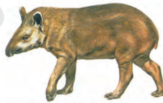
चित्र 6.5 : टैपीर

विभिन्न प्रजातियाँ भी इन वनों में पाई जाती हैं। मगर, साँप, अजगर तथा एनाकोंडा एवं बोआ कुछ ऐसी ही प्रजातियाँ हैं। इसके अतिरिक्त हज़ारों कीड़े-मकोड़े भी इस बेसिन में निवास करते हैं। मांस खाने वाली पिरान्या मत्स्य समेत मछलियों की विभिन्न प्रजातियाँ भी अमेज़न नदी में पाई जाती हैं। इस प्रकार जीवों की विविधता की दृष्टि से यह बेसिन असाधारण रूप से समृद्ध है।