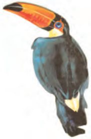
चित्र 6.4 : टूकन

वर्षावन में प्राणिजात की प्रचुरता होती है। टूकन, गुंजन पक्षी, रंगीन पक्षित वाले मकाओ एवं भोजन के लिए बड़ी चोंच वाले विभिन्न प्रकार के पक्षी जो भारत में पाए जाने वाले सामान्य पक्षियों से भिन्न होते हैं यहाँ पाए जाते हैं। प्राणियों में बंदर, स्लॉथ एवं चीटीं खाने वाले टैपीर भी यहाँ पाए जाते हैं। साँप एवं सरीसर्प की