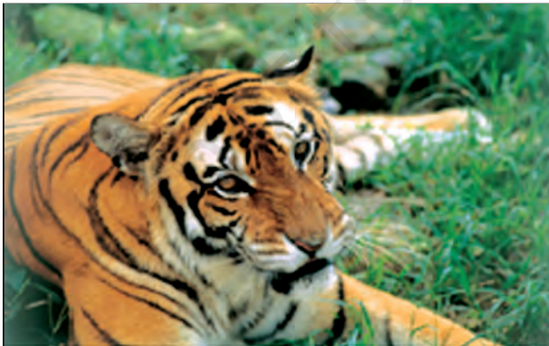
चित्र 6.14 : मानस वन्य प्राणी अभयवन में बाघ

बेसिन में यातायात का सुविकसित तंत्र उपस्थित है। आप देख सकते हैं कि गंगा-ब्रह्मपुत्र बेसिन में यातायात के चार मार्ग सुविकसित हैं। मैदानी इलाकों के लोग सड़कमार्ग एवं रेलमार्ग द्वारा एक स्थान से दूसरे स्थान तक जाते हैं। नदी के तटीय क्षेत्रों में जलमार्ग यातायात का प्रभावशाली माध्यम है। कोलकाता हुगली नदी पर स्थित एक महत्वपूर्ण पत्तन है। मैदानी क्षेत्र में कई बड़े हवाई पत्तन भी स्थित हैं।