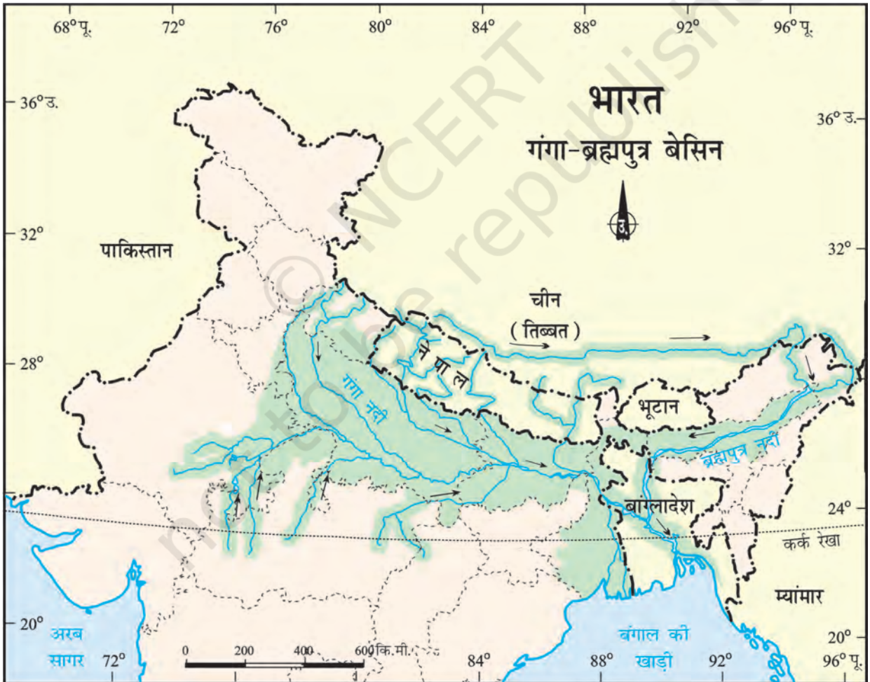
चित्र 6.8 : गंगा-ब्रह्मपुत्र बेसिन

मानव-पर्यावरण अन्योन्यक्रिया: उष्णकटिबंधीय एवं उपोष्ण प्रदेश 43