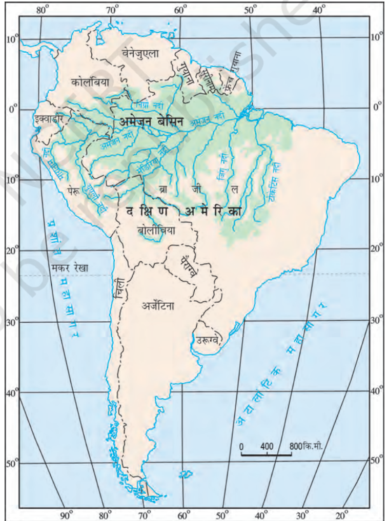
चित्र 6.2 : दक्षिण अमेरिका में अमेज़न बेसिन

क्या आप इस बेसिन में स्थित उन देशों के नाम बता सकते हैं जिनसे भूमध्य रेखा गुजरती है?