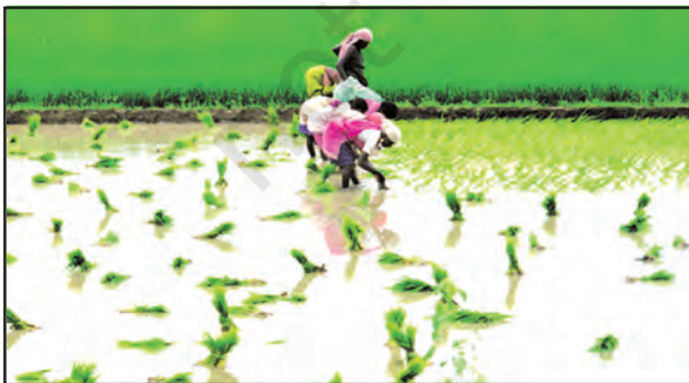
चित्र 6.9 : धान की कृषि

विभिन्न भू-आकृतियों के अनुसार वनस्पति में भी विभिन्नता पायी जाती है। गंगा-ब्रह्मपुत्र के मैदानों में सागवान, साखू एवं पीपल के साथ उष्णकटिबंधीय पर्णपाती पेड़ भी पाए जाते हैं। ब्रह्मपुत्र के मैदानी क्षेत्रों में घने बाँस के घने झुरमुट पाए जाते हैं। डेल्टा क्षेत्र मैंग्रोव वन से घिरा है। उत्तराखंड, सिक्किम एवं अरुणाचल प्रदेश की ठंडी जलवायु एवं तीव्र ढाल वाले भागों में चीड़, देवदार एवं फर जैसे शंकुधारी पेड़ पाए जाते हैं।