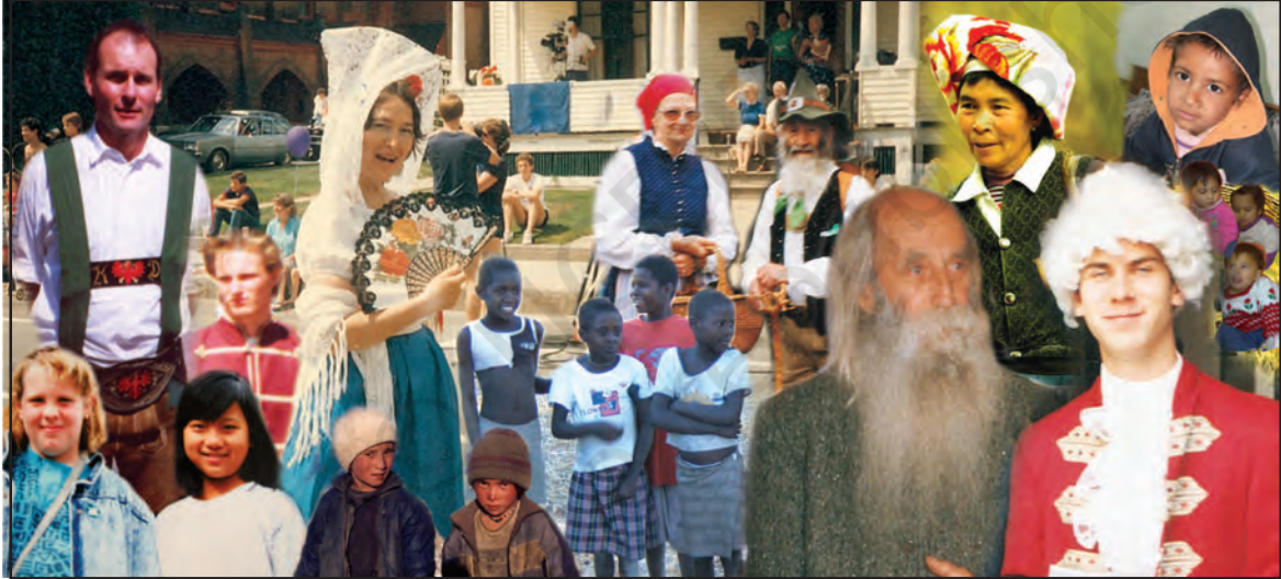
चित्र 6.1 : विश्व के विभिन्न भागों के निवासी

रेणुका बहुत उत्साहित थी। उसके चाचा श्रीकांत लगभग चार महीने के बाद आज घर में थे। वह एक वन्यजीव फोटोग्राफर थे तथा बहुत यात्रा करते थे। बहुत छोटी उम्र से ही रेणुका की रुचि वन्यजीव एवं वनों में थी जब उसके चाचा ने प्रकृति संबंधी पुस्तकों से उसका परिचय कराया। दूरस्थ भूस्थल एवं वहाँ रहने वाले लोगों की तसवीरें उसे हमेशा आकर्षित करती थीं।