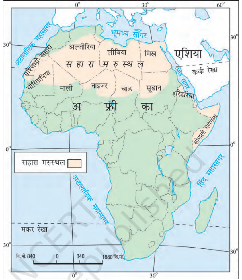
चित्र 7.2 : अफ्रीका महाद्वीप में सहारा

आपको यह जानकर आश्चर्य होगा कि आज का सहारा रेगिस्तान एक समय में पूर्णतया हरा-भरा मैदान था। सहारा की गुफाओं से प्राप्त चित्रों से ज्ञात होता है कि यहाँ नदियाँ तथा मगर पाए जाते थे। हाथी, शेर, जिराफ़, शतुरमुर्ग, भेड़, पशु तथा बकरियाँ सामान्य जानवर थे। परंतु यहाँ के जलवायु परिवर्तन ने इसे बहुत गर्म व शुष्क प्रदेश में बदल दिया है।