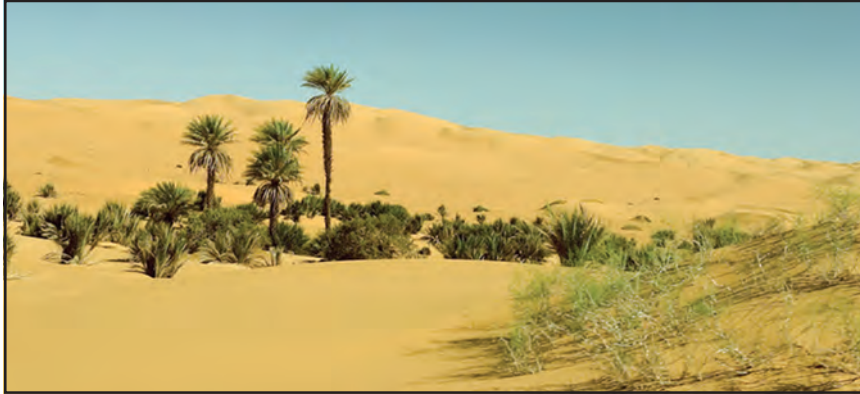
चित्र 7.3 : सहारा रेगिस्तान में मरूद्यान

ऊँट, लकड़बग्घा, सियार, लोमड़ी, बिच्छू, साँपों की विभिन्न जातियाँ एवं छिपकलियाँ यहाँ के प्रमुख जीव-जंतु हैं।