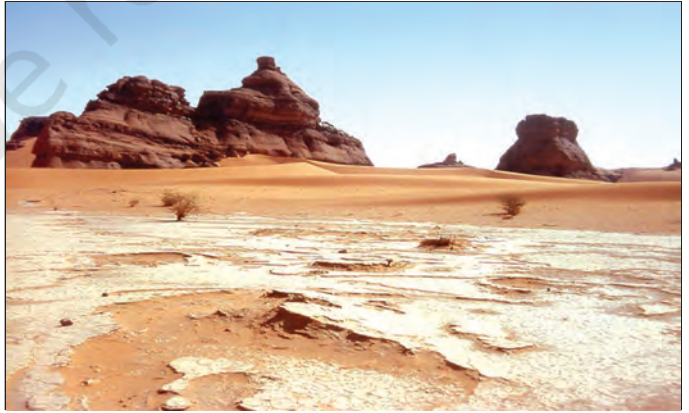
चित्र 7.1 : सहारा रेगिस्तान

विश्व एवं अफ्रीका महाद्वीप के मानचित्र को देखिए। उत्तरी अफ्रीका के बड़े भू-भाग पर फैले सहारा के रेगिस्तान का पता लगाएँ। यह विश्व का सबसे बड़ा रेगिस्तान है। यह लगभग 8.54 लाख वर्ग किलोमीटर के क्षेत्र में फैला हुआ है। क्या आपको याद है कि भारत का क्षेत्रफल 32.8 लाख वर्ग किलोमीटर है? सहारा रेगिस्तान ग्यारह देशों से घिरा हुआ है। ये देश हैं-अल्जीरिया, चाड, मिस्र, लीबिया, माली, मौरितानिया, मोरक्को, नाइजर, सूडान, ट्यूनिशिया एवं पश्चिमी सहारा।