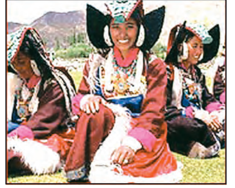
चित्र 7.6 : पारंपरिक वेशभूषा में लद्दाखी महिलाएँ

आधुनिकीकरण के फलस्वरूप यहाँ के जनजीवन में परिवर्तन आ रहा है। लेकिन लद्दाख के लोगों ने शताब्दियों से प्रकृति के साथ समन्वय एवं संतुलन करना सीखा है। जल एवं ईंधन जैसे संसाधनों की कमी के कारण ये आवश्यकतानुसार एवं मितव्ययिता से ही इनका उपयोग करते हैं और कुछ भी व्यर्थ नहीं करते।