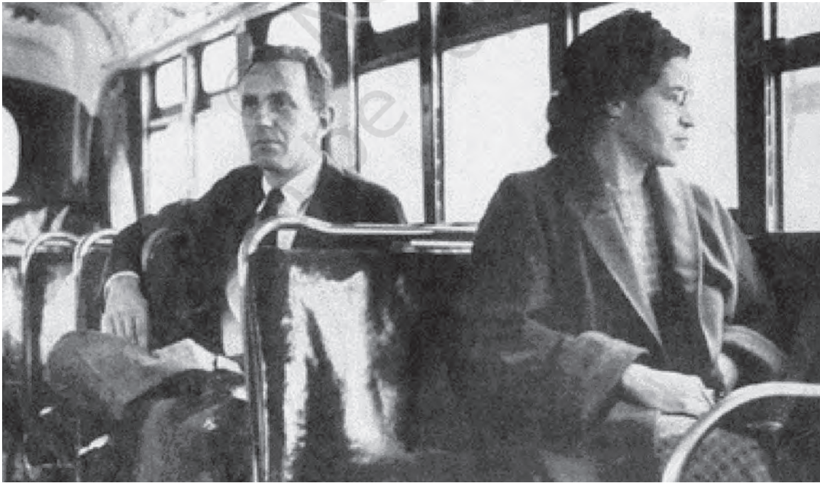
रोज़ा पार्क्स, एक अफ्रीकी-अमेरिकन औरत, जिनकी एक विद्रोही प्रतिक्रिया ने अमेरिकी इतिहास की दिशा बदल दी।

रोज़ा पार्क्स (1913–2005) एक अफ्रीकी-अमेरिकन महिला थीं। 1 दिसंबर 1955 को दिन भर काम करके थक जाने के बाद बस में उन्होंने अपनी सीट एक गोरे व्यक्ति को देने से मना कर दिया। उस दिन उनके इंकार से अफ्रीकी-अमेरिकनों के साथ असमानता को लेकर एक विशाल आंदोलन प्रारंभ हो गया, जो नागरिक अधिकार आंदोलन (सिविल राइट्स मूवमेंट) कहलाया। 1964 के नागरिक अधिकार अधिनियम ने नस्ल, धर्म और राष्ट्रीय मूल के आधार पर भेदभाव का निषेध कर दिया। इसने यह भी कहा कि अफ्रीकी-अमेरिकन बच्चों के लिए सब स्कूलों के दरवाज़े खोले जाएँ और उन्हें उन अलग स्कूलों में नहीं जाना पड़ेगा, जो विशेष रूप से केवल उन्हीं के लिए खोले गए थे। इतना होने के बावजूद भी अधिकांश अफ्रीकी-अमेरिकन गरीब हैं। अधिकतर अफ्रीकी-अमेरिकन बच्चे केवल ऐसे सरकारी स्कूलों में प्रवेश लेने की ही सामर्थ्य रखते हैं, जहाँ कम सुविधाएँ हैं और कम योग्यता वाले शिक्षक हैं; जबकि गोरे विद्यार्थी निजी स्कूलों में जाते हैं या उन क्षेत्रों में रहते हैं, जहाँ के सरकारी स्कूलों का स्तर निजी स्कूलों जैसा ही ऊँचा है।