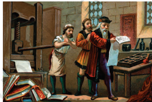
एक चित्रकार की नज़र में बाइबल के पहले पन्ने की छपाई करते हुए गुटेनबर्ग

पृष्ठ 64 पर दिए गए कोलाज में से संचार माध्यमों के छह अलग-अलग प्रकारों को छाँटिए।