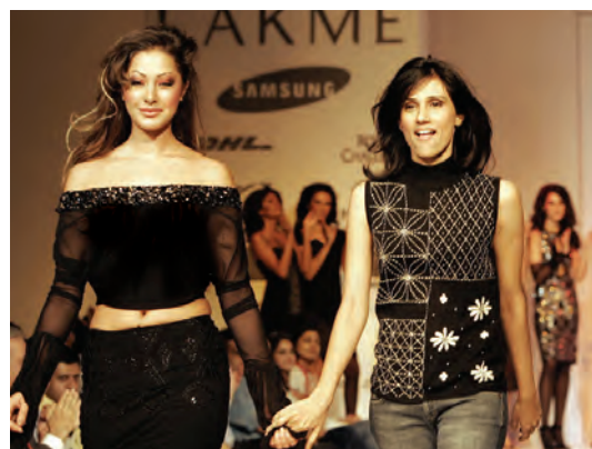
संचार माध्यमों में फ़ैशन शो बहुत लोकप्रिय हुए हैं

कई बार ऐसी घटनाएँ हो जाती हैं, जब संचार माध्यम उन विषयों पर हमारा ध्यान केंद्रित कराने में असफल रहते हैं, जो हमारे जीवन के लिए महत्वपूर्ण हैं, उदाहरण के लिए— पीने का पानी हमारे देश की एक बड़ी समस्या है। प्रतिवर्ष हज़ारों लोग कष्ट सहते हैं और मर जाते हैं, क्योंकि उन्हें पीने के लिए सुरक्षित पानी नहीं मिलता, फिर भी संचार माध्यम हमें इस विषय पर बहुत कम ही चर्चा करते हुए दिखाते हैं। एक सुविख्यात भारतीय पत्रकार ने लिखा है कि कैसे वस्त्रों को नया रूपाकार देने वाले डिज़ाइनरों ने 'फ़ैशन वीक' में धनवानों के समक्ष अपने नए वस्त्र प्रदर्शित करके सभी समाचारपत्रों के मुख्य पृष्ठ पर स्थान पा लिया, जबकि उसी सप्ताह मुंबई में अनेक झोपड़पट्टियों को गिरा दिया गया पर किसी ने इस पर ज़रा सा भी ध्यान नहीं दिया।