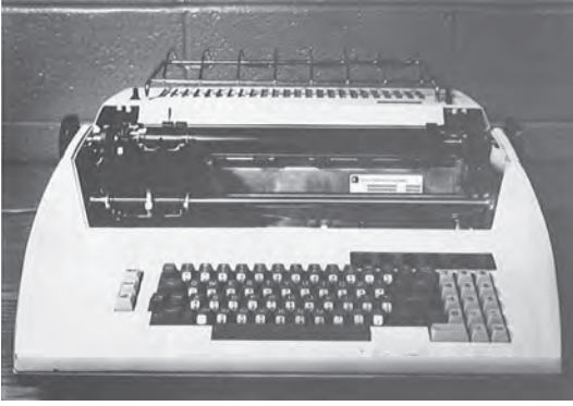
1940 के दशक में इलेक्ट्रॉनिक टाइपराइटर के आ जाने से पत्रकारिता की दुनिया में एक बड़ा बदलाव आया।