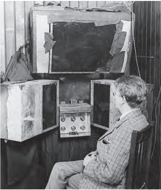
(यह यंत्र 'टेलीवाइजर', टेलीविजन का प्रारंभिक रूप था। अपने इस आविष्कार के सामने बैठे हैं— जॉन एल बेडी इस यंत्र के द्वारा उन्होंने रॉयल इंस्टीट्यूट के समक्ष अपने आविष्कार का प्रदर्शन किया था।

अपने प्रिय टी.वी. कार्यक्रम के दौरान विज्ञापित होने वाली तीन चीजों की सूची बनाइए।