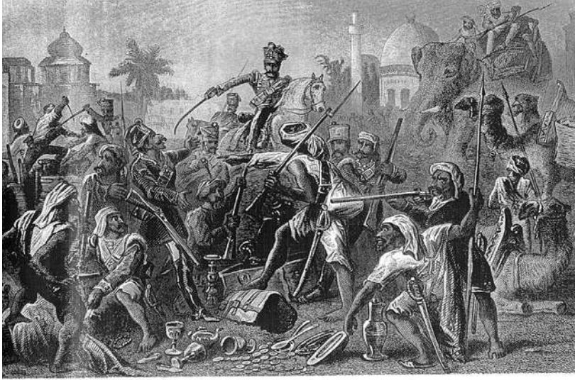
चित्र 7 - 1857 के विद्रोही।

तसवीरों को भी बहुत ध्यान से देखना चाहिए। उनसे हमें चित्रकार की सोच पता चलती है। 1857 के विद्रोह के बाद अंग्रेजों द्वारा तैयार की गई सचित्र पुस्तकों में यह तसवीर कई जगह दिखाई देती है। इस तसवीर के नीचे लिखा होता था — “बागी सिपाही लूट-खसोट में लगे हुए हैं”। अंग्रेजों की नज़र में विद्रोही जनता लालची, दुष्ट और बेरहम थी। इस विद्रोह के बारे में आप अध्याय 5 में पढ़ेंगे।