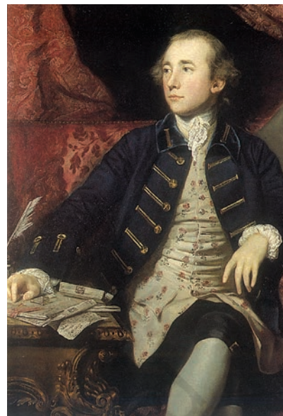
चित्र 3 - वॉरेन हेस्टिंग्स 1773 में पहले गवर्नर-जनरल बने।

मिल को लगता था कि सारे एशियाई समाज सभ्यता के मामले में यूरोप से पीछे हैं। इतिहास की उनकी समझदारी ये थी कि भारत में अंग्रेजों के आने से पहले यहाँ हिंदू और मुसलमान तानाशाहों का ही राज चलता था। यहाँ चारों ओर केवल धार्मिक बैर, जातिगत बंधनों और अंधविश्वासों का ही बोलबाला था।