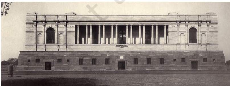
चित्र 4 - भारतीय राष्ट्रीय अभिलेखागार 1920 के दशक में बनाया गया।

उन्नीसवीं सदी की शुरुआत में प्रशासन की एक शाखा से दूसरी शाखा के पास भेजे गए पत्रों और ज्ञापनों को आप आज भी अभिलेखागारों में देख सकते हैं। वहाँ आप ज़िला अधिकारियों द्वारा तैयार किए गए नोट्स और रिपोर्ट पढ़ सकते हैं या ऊपर बैठे अफ़सरों द्वारा प्रांतीय अधिकारियों को भेजे गए निर्देश और सुझाव देख सकते हैं। उन्नीसवीं सदी के शुरुआती सालों में इन दस्तावेजों की सावधानीपूर्वक नकलें बनाई जाती थीं।