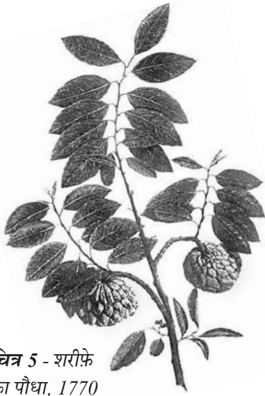
चित्र 5 - शरीफे का पौधा, 1770 का दशक।

अंग्रेजों द्वारा बनाए गए वानस्पतिक उद्यान और प्राकृतिक इतिहास के संग्रहालयों में विभिन्न पौधों के नमूने और उनसे संबंधित जानकारीयें इकट्ठा की जाती थीं। इन नमूनों के चित्र स्थानीय कलाकारों से बनवाए जाते थे। अब इतिहासकार इस बात पर ध्यान दे रहे हैं कि इस तरह की जानकारी किस तरह इकट्ठा की जाती थी और इससे उपनिवेशवाद के बारे में क्या पता चलता है।