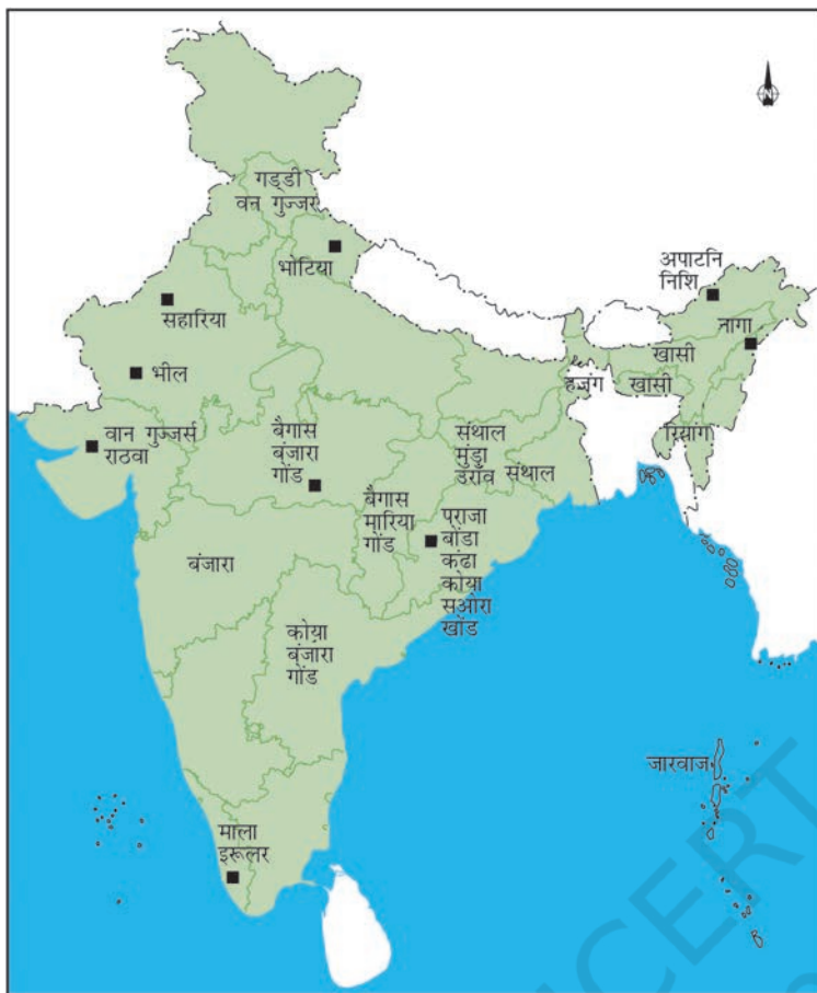
चित्र 3 - भारत में कुछ आदिवासी समुदायों के इलाके।

कुसुम और पलाश के फूलों की ज़रूरत होती थी तो वे खोंड समुदाय के लोगों से ही कहते थे।