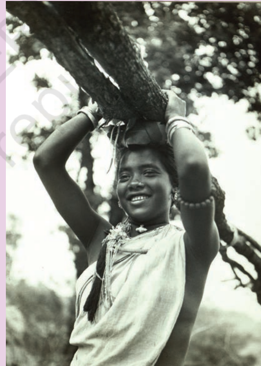
चित्र 4 - ईंधन की लकड़ी ले जाती एक संथाल लड़की, बिहार, 1946

वेरियर ऐल्विन द्वारा लिखित बैगा (1939) और ऐल्विन की अप्रकाशित रचना 'नोट्स ऑन द खोंड्स' (वेरियर ऐल्विन पेपर्स, नेहरू स्मृति संग्रहालय एवं पुस्तकालय) पर आधारित