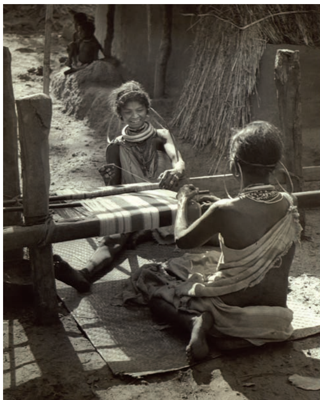
चित्र 8 - गोदारा औरतें बुनाई करती हुईं

वर्तमान झारखंड में स्थित हजारीबाग के आसपास रहने वाले संधाल रेशम के कीड़े पालते थे। रेशम के व्यापारी अपने ऐजेंटों को भेजकर आदिवासियों को कर्जे देते थे और उनके कृमिकोषों को इकट्ठा कर लेते थे। एक हजार कृमिकोषों के लिए 3-4 रुपये मिलते थे। इसके बाद इन कृमिकोषों को बर्दवान या गया भेज दिया जाता था जहाँ उन्हें पाँच गुना कीमत पर बेचा जाता था। निर्यातकों और रेशम उत्पादकों के बीच कड़ी का काम करने वाले बिचौलियों को जमकर मुनाफ़ा होता था। रेशम उत्पादकों को बहुत मामूली फ़ायदा मिलता था। स्वाभाविक है कि बहुत सारे आदिवासी समुदाय बाजार और व्यापारियों को अपना सबसे बड़ा दुश्मन मानने लगे थे।