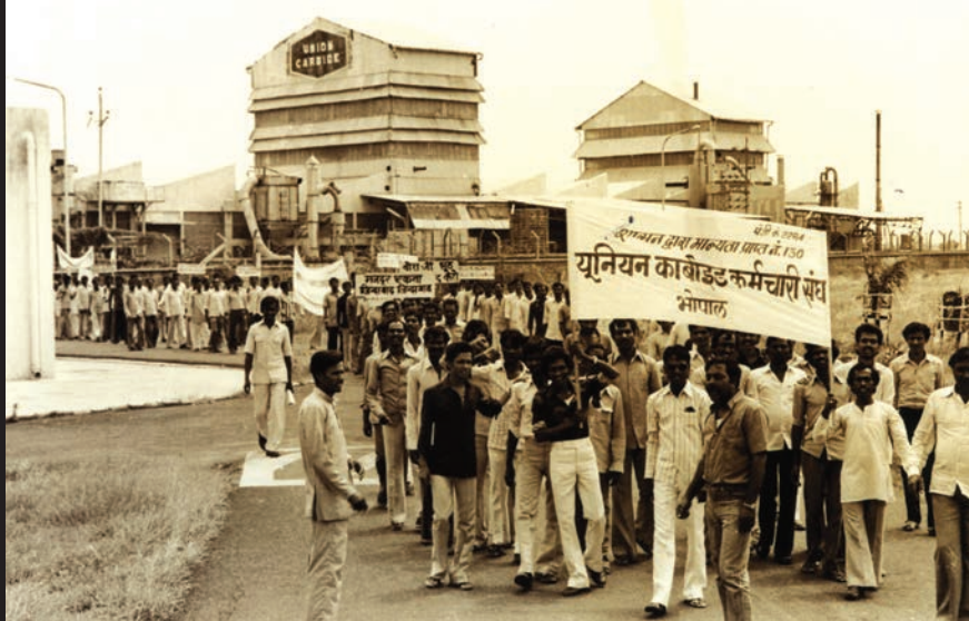
यूनिन कार्बाइड कर्मचारी यूनिन के सदस्यों का आंदोलन

यह तबाही कोई दुर्घटना नहीं थी। यूनिन कार्बाइड ने पैसा बचाने के लिए सुरक्षा उपायों को जानबूझकर नज़रअंदाज़ किया था। 2 दिसंबर की त्रासदी से बहुत पहले भी कारखाने में गैस का रिसाव हो चुका था। इन घटनाओं में एक मजदूर की मौत हुई थी जबकि बहुत सारे घायल हुए थे।