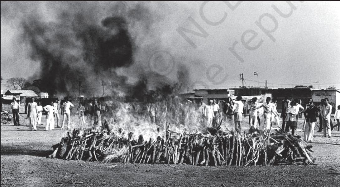
सामूहिक अंतिम संस्कार

तीन दिन के भीतर 8,000 से ज्यादा लोग मौत के मुँह में चले गए। लाखों लोग गंभीर रूप से प्रभावित हुए।