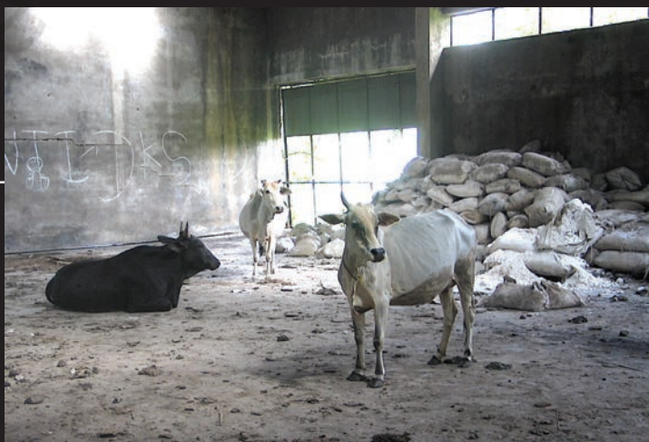
यूनिन कार्बाइड संयंत्र के इर्द-गिर्द बिखरे पड़े रसायनों के बोरे

यूनिन कार्बाइड ने कारखाना तो बंद कर दिया, लेकिन भारी मात्रा में विषैले रसायन वहीं छोड़ दिए। ये रसायन रिस-रिस कर ज़मीन में जा रहे हैं जिससे वहाँ का पानी दूषित हो रहा है। अब यह संयंत्र डाओ कैमिकल नामक कंपनी के कब्ज़े में है जो इसकी साफ़-सफ़ाई का जिम्मा उठाने को तैयार नहीं है।