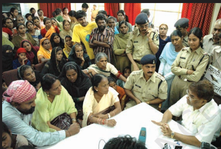
गैस राहत मंत्री से बात करते गैस पीड़ित।

सबूतों से पूरी तरह साफ़ था कि इस महाविनाश के लिए यूनिन कार्बाइड ही दोषी है, लेकिन कंपनी ने अपनी गलती मानने से इनकार कर दिया।