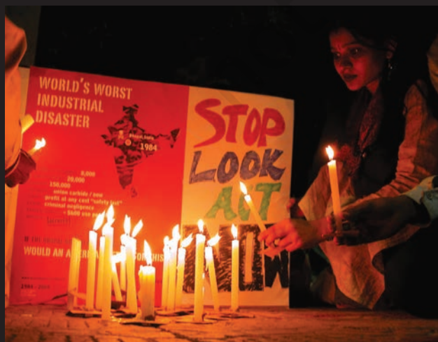
इंसाफ़ की लड़ाई अभी जारी है...।

24 साल बाद भी लोग न्याय के लिए संघर्ष कर रहे हैं। वे पीने के साफ़ पानी, स्वास्थ्य सुविधाओं और यूनिन कार्बाइड के जहर से ग्रस्त लोगों के लिए नौकरियों की माँग कर रहे हैं। उन्होंने यूनिन कार्बाइड के चेयरमैन एंडरसन को सज़ा दिलाने के लिए भी आंदोलन चलाया है।