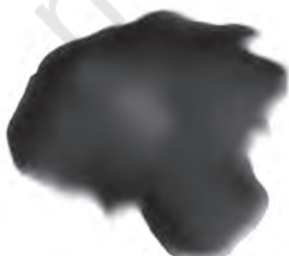
चित्र 3.3 : कोलतार।

यह एक अप्रिय गंध वाला काला गाढ़ा द्रव होता है (चित्र 3.3)। यह लगभग 200 पदार्थों का मिश्रण