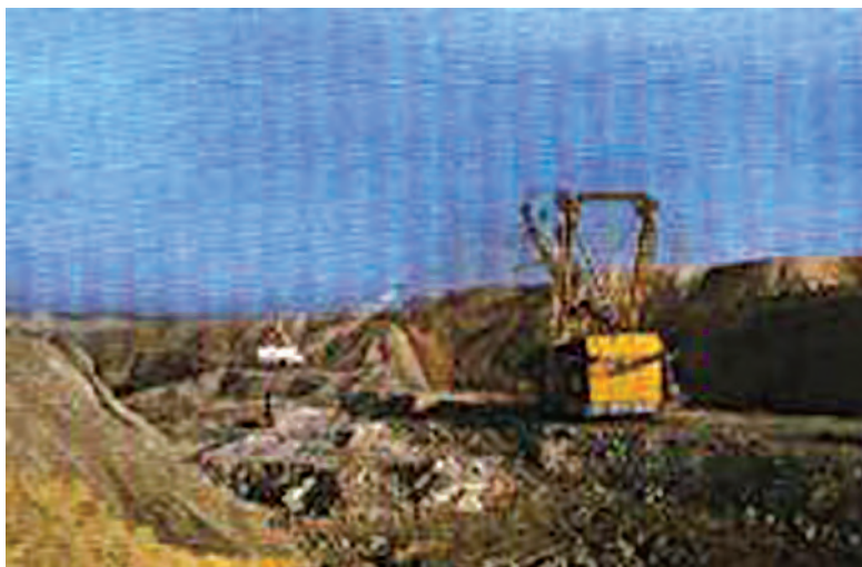
चित्र 3.2 : कोयले की एक खान।

वायु में गर्म करने पर कोयला जलता है और मुख्य रूप से कार्बन डाइऑक्साइड गैस उत्पन्न करता है।