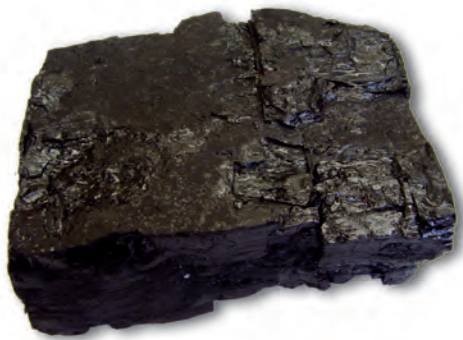
चित्र 3.1 : कोयला।

में वृद्धि के साथ-साथ दूसरी और तीसरी पीढ़ी में उपभोक्ताओं की संख्या अधिक है। प्रत्येक समूह के लिए मेज़ पर एक पूरा भरा पात्र रख दीजिए। प्रत्येक समूह की पहली पीढ़ी के उपभोक्ताओं से कहिए कि वे अपने समूह के पात्र से वस्तुओं का उपभोग करें। अब प्रत्येक समूह की दूसरी पीढ़ी को भी वैसा ही करने को कहिए। विद्यार्थियों से कहिए कि वे प्रत्येक पात्र में वस्तुओं की उपलब्धता को ध्यान से देखें। यदि पात्रों में कुछ शेष बचा है तो प्रत्येक समूह की तीसरी पीढ़ी को इसका उपभोग करने के लिए कहिए। अब अन्तिम रूप से देखिए कि तीसरी पीढ़ी के सभी उपभोक्तों को खाने हेतु कुछ मिला या नहीं। यह भी देखिए कि क्या पात्रों में अब भी कुछ शेष बच गया है।