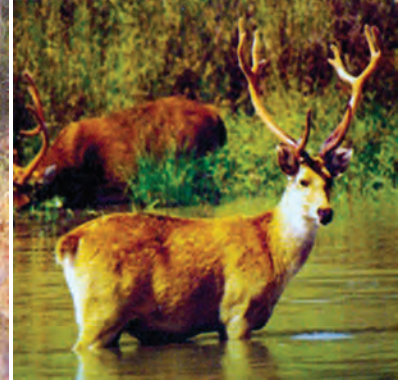
चित्र 5.6 : बारहसिंघा।