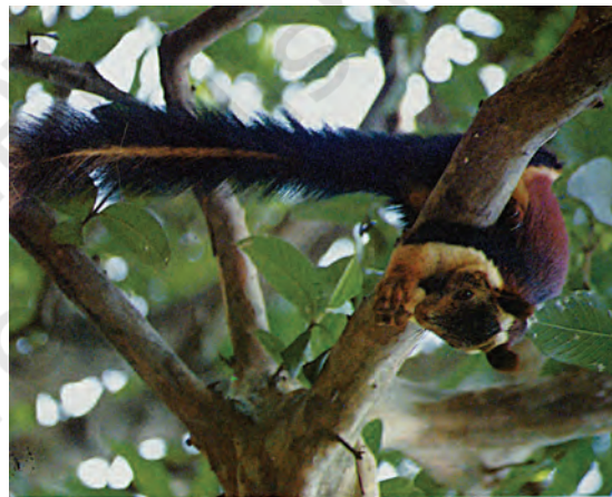
चित्र 5.3(b) : विशाल गिलहरी।