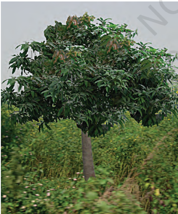
चित्र 5.3(a) : जंगली आम।

माधवजी ने पचमढी जैवमण्डल आरक्षित क्षेत्र में स्थित साल और जंगली आम [चित्र 5.3(a)] के पेड़ को