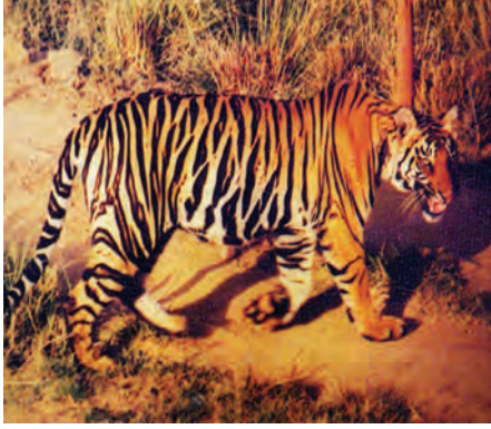
चित्र 5.4 : बाघ।