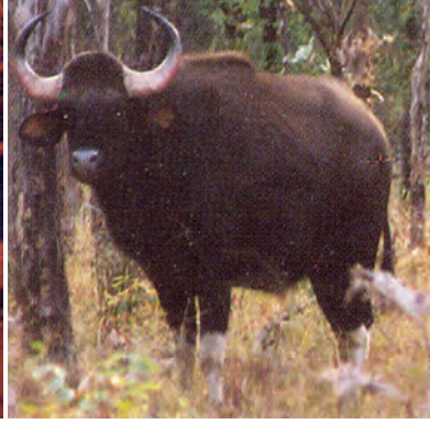
चित्र 5.5 : जंगली भैंसा।