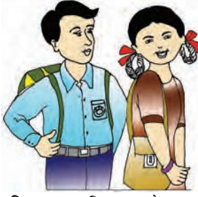
चित्र 2.4 : विद्यालय के छात्र-छात्रा

करती है और प्रशासन की कार्य-क्षमता बढ़ाती है। प्राथमिक शिक्षा में सार्वजनिक पहुँच, धारण और गुणवत्ता प्रदान करने का प्रावधान किया गया है और इस मामले में लड़कियों पर विशेष जोर दिया गया है। प्रत्येक जिले में नवोदय विद्यालय जैसे