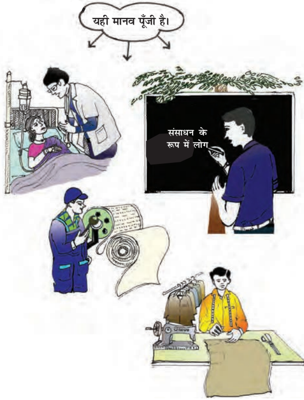
चित्र 2.1 : मानव पूँजी