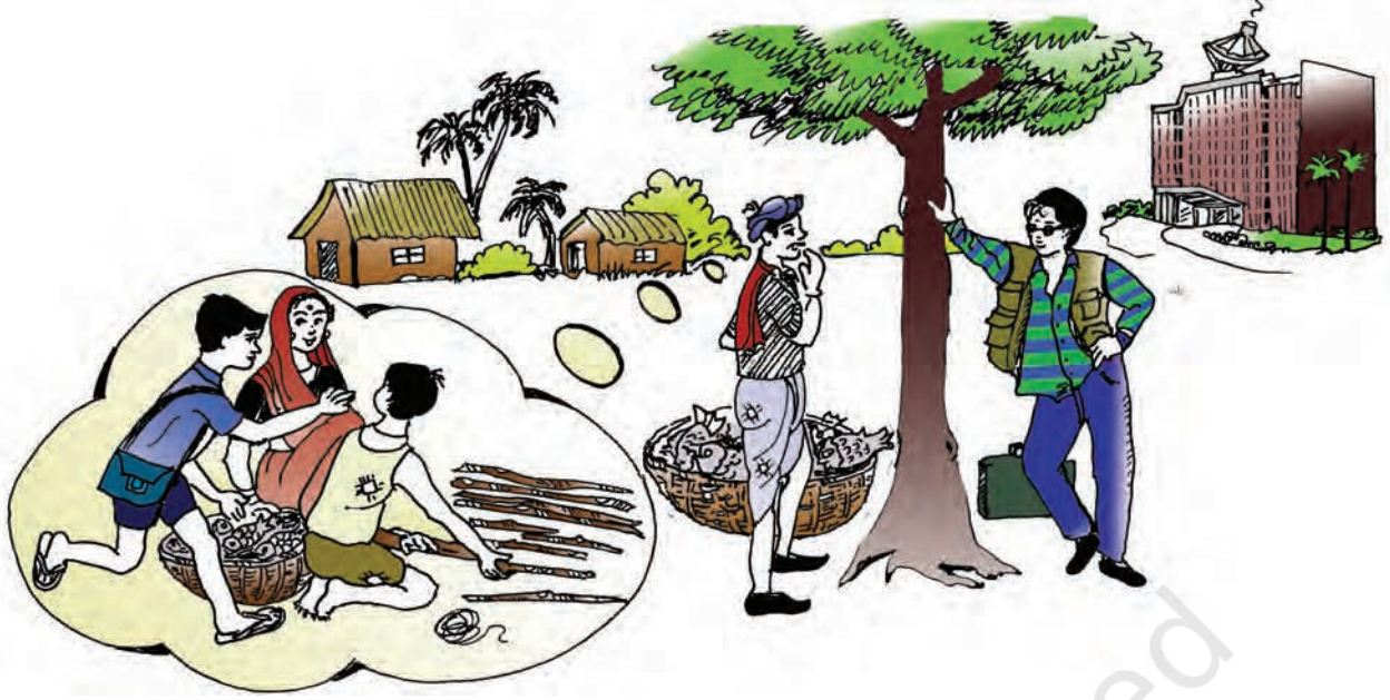
चित्र 2.2 : विलास एवं सकल की कहानियाँ