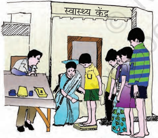
चित्र 2.5 : स्वास्थ्य की जाँच के लिए एक पंक्ति में खड़े हुए बच्चे

किसी व्यक्ति का स्वास्थ्य उसे अपनी क्षमता को प्राप्त करने और बीमारियों से लड़ने की ताकत देता है। ऐसा कोई भी अस्वस्थ स्त्री/पुरुष संगठन के समग्र विकास में अपने योगदान