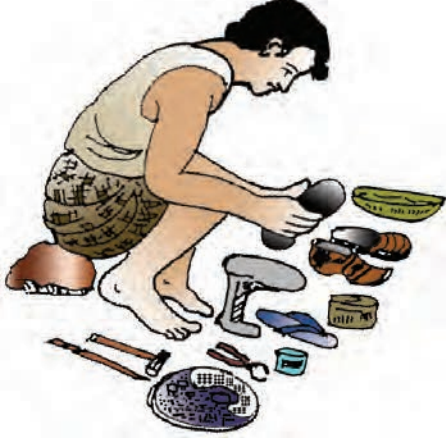
चित्र 2.6 : क्या आपको स्मरण है कि जब आपने अपने जूते या चप्पल ठीक कराए थे, तो कितना भुगतान किया था?

इसके अतिरिक्त, प्राथमिक क्षेत्रक में स्वरोजगार एक विशेषता है। यद्यपि सभी लोगों की आवश्यकता नहीं होती है, फिर भी पूरा परिवार खेतों में काम करता है। इस तरह कृषि क्षेत्रक