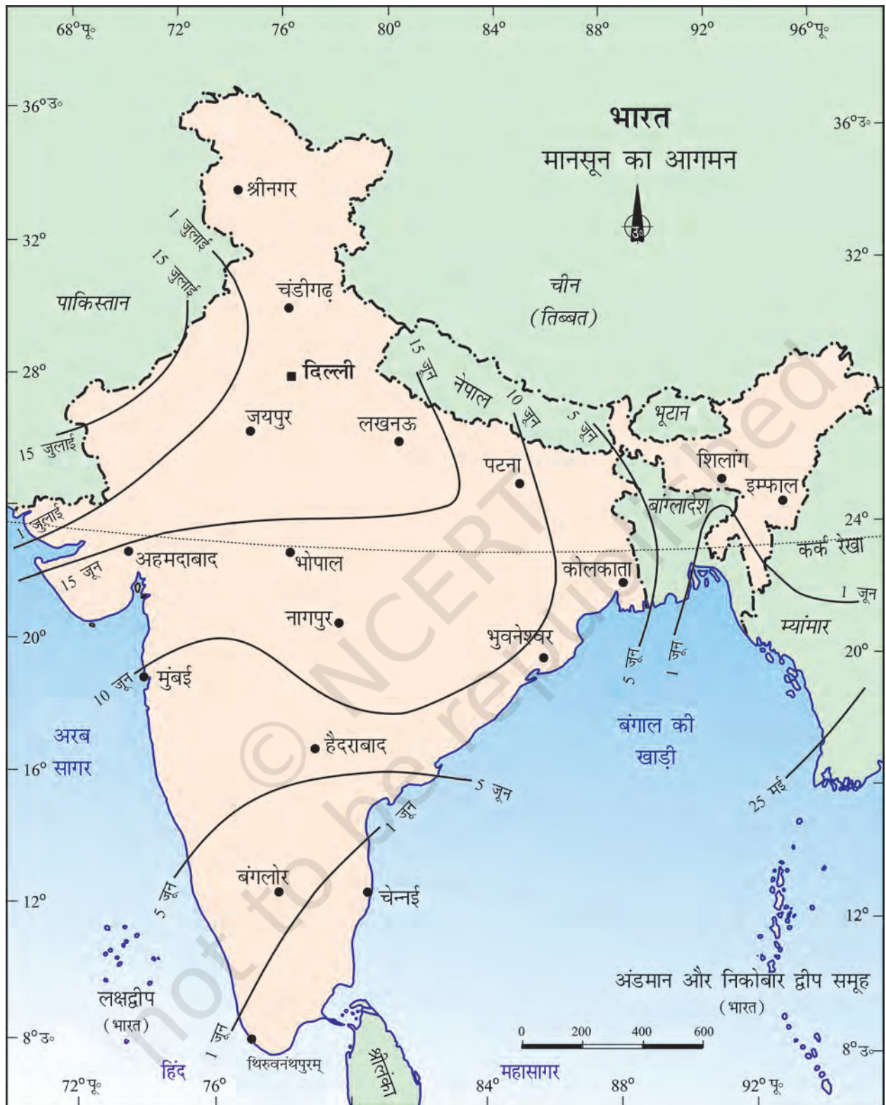
चित्र 4.1 : मानसून का आगमन