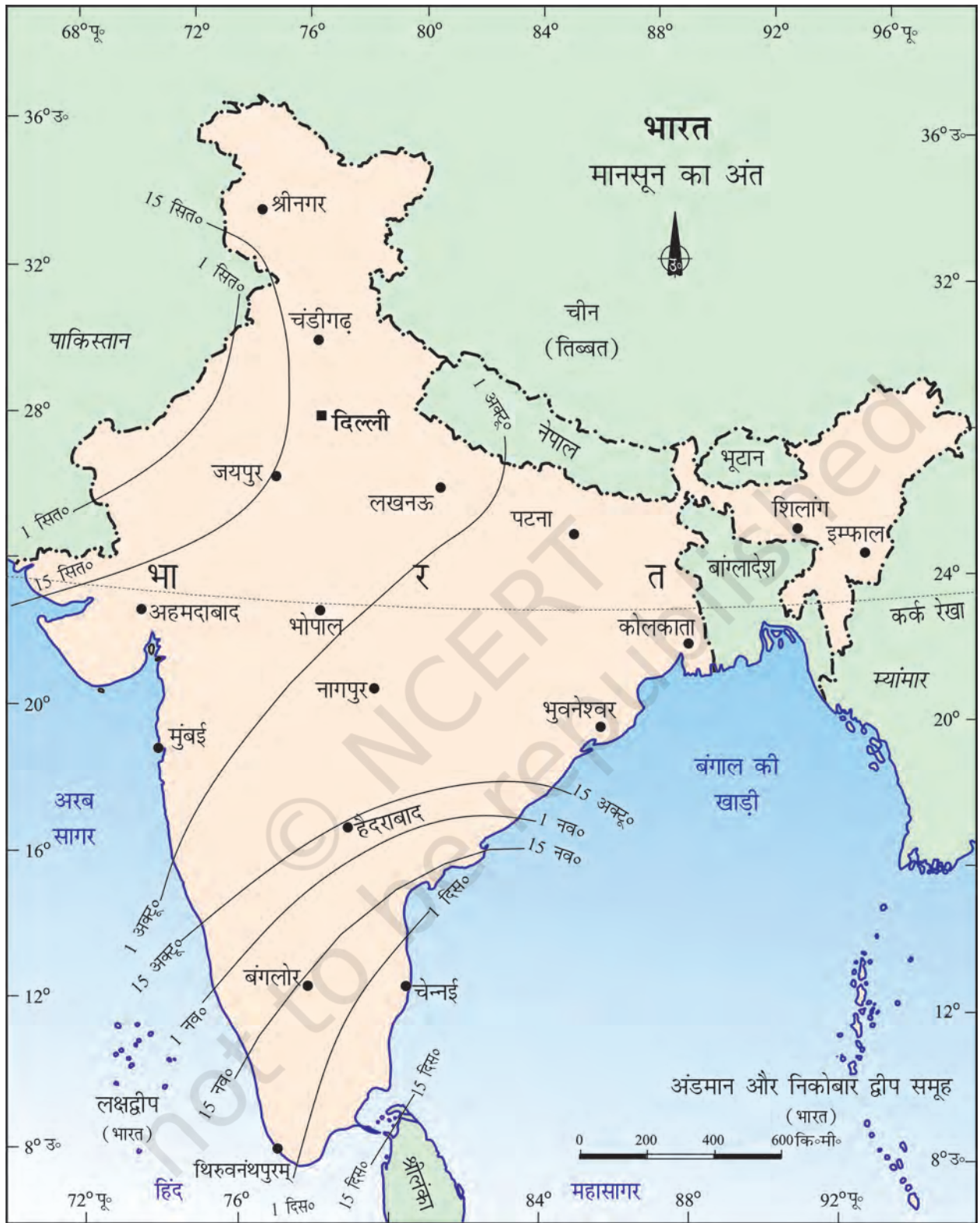
चित्र 4.2 : मानसून का अंत