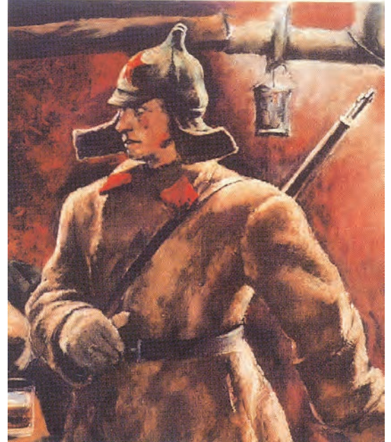
चित्र 12 - सोवियत टोपी (बुदियोनोव्का) पहने एक सिपाही.

बोलशेविक पार्टी का नाम बदल कर रूसी कम्युनिस्ट पार्टी (बोलशेविक) रख दिया गया। नवंबर 1917 में बोलशेविकों ने संविधान सभा के लिए चुनाव कराए लेकिन इन चुनावों में उन्हें बहुमत नहीं मिल पाया। जनवरी 1918 में असेंबली ने बोलशेविकों के प्रस्तावों को खारिज कर दिया और लेनिन ने असेंबली बर्खास्त कर दी। उनका मत था कि अनिश्चित परिस्थितियों में चुनी गई असेंबली के मुकाबले अखिल रूसी सोवियत कांग्रेस कहीं ज़्यादा लोकतांत्रिक संस्था है। मार्च 1918 में अन्य राजनीतिक सहयोगियों की असहमति के बावजूद बोलशेविकों ने ब्रेस्ट लिटोव्स्क में जर्मनी से संधि कर ली। आने वाले सालों में बोलशेविक पार्टी अखिल रूसी सोवियत कांग्रेस के लिए होने वाले चुनावों में हिस्सा लेने वाली एकमात्र पार्टी रह गई। अखिल रूसी सोवियत कांग्रेस को अब देश की संसद का दर्जा दे दिया गया था। रूस एक-दलीय राजनीतिक व्यवस्था वाला देश बन गया। ट्रेड यूनियनों पर पार्टी का नियंत्रण रहता था। गुप्तचर पुलिस (जिसे पहले चेका और बाद में ओजीपीयू तथा एनकेवीडी का नाम दिया गया) बोलशेविकों की आलोचना करने वालों को दंडित करती थी। बहुत सारे युवा लेखक और कलाकार भी पार्टी की तरफ़ आकर्षित हुए क्योंकि वह समाजवाद और परिवर्तन के प्रति समर्पित थी। अक्टूबर 1917 के बाद ऐसे कलाकारों और लेखकों ने कला और वास्तुशिल्प के क्षेत्र में नए प्रयोग शुरू किए। लेकिन पार्टी द्वारा थोपी गई सेंसरशिप के कारण बहुत सारे लोगों का पार्टी से मोह भंग भी होने लगा था।