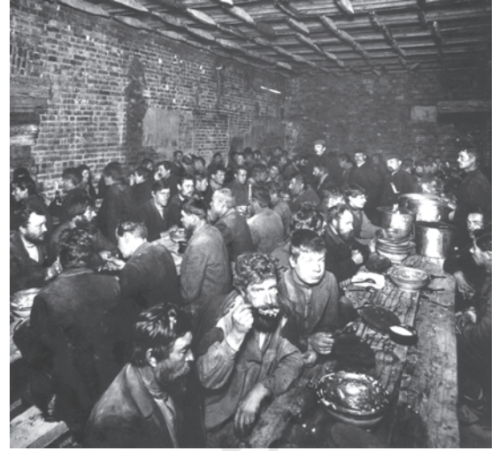
चित्र 5 - युद्ध से पहले सेंट पीटर्सबर्ग में बेरोजगार किसान. बहुत सारे लोग धर्मार्थ लंगरों में खाना खाते थे और खस्ताहाल मकानों में रहते थे।

सामाजिक स्तर पर मजदूर बँटे हुए थे। कुछ मजदूर अपने मूल गाँवों के साथ अभी भी गहरे संबंध बनाए हुए थे। बहुत सारे मजदूर स्थायी रूप से शहरों में ही बस चुके थे। उनके बीच योग्यता और दक्षता के स्तर पर भी काफी फ़र्क था। सेंट पीटर्सबर्ग के एक धातु मजदूर ने कहा था : 'धातुकर्मी मजदूरों में खुद को साहब मानते थे। उनके काम में ज्यादा प्रशिक्षण और निपुणता की जरूरत जो रहती थी...।' 1914 में फैक्ट्री मजदूरों में औरतों की संख्या 31 प्रतिशत थी लेकिन उन्हें पुरुष मजदूरों के मुकाबले कम वेतन मिलता था (मर्दों की तनखाह के मुकाबले आधे से तीन-चौथाई तक)। मजदूरों के बीच मौजूद फ़ासला उनके पहनावे और व्यवहार में भी साफ़ दिखाई देता था। यद्यपि कुछ मजदूरों ने बेरोजगारी या आर्थिक संकट के समय एक-दूसरे की मदद करने के लिए संगठन बना लिए थे लेकिन ऐसे संगठन बहुत कम थे।