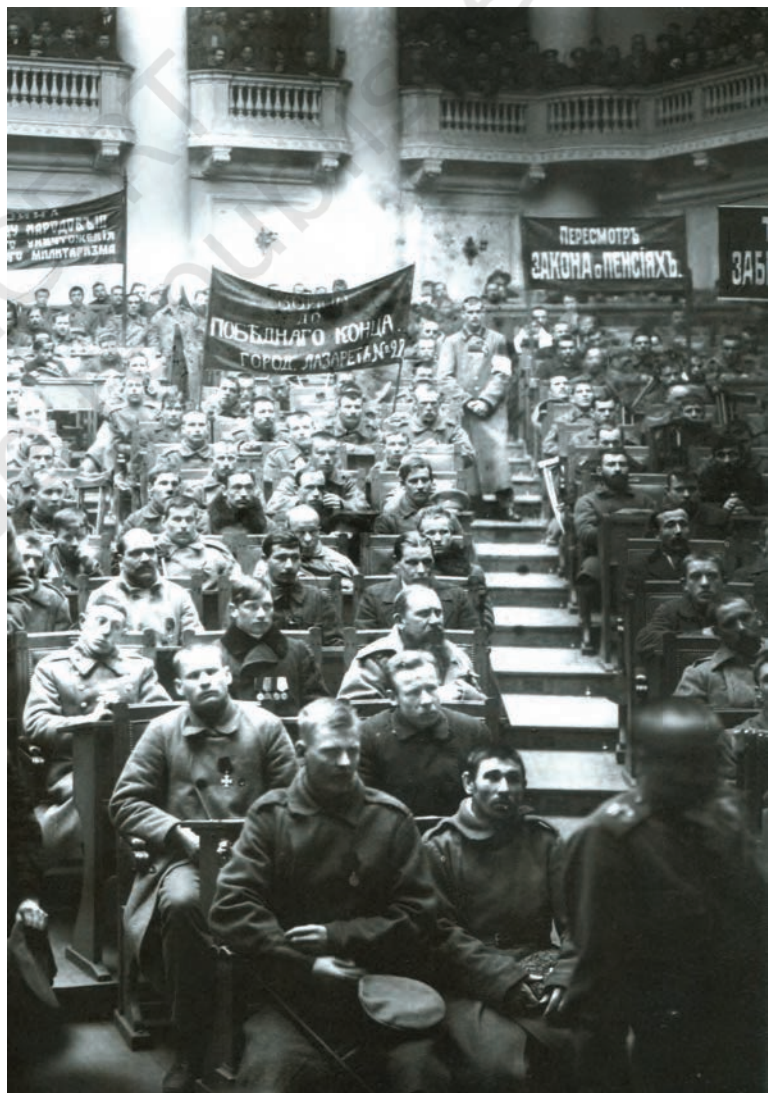
चित्र 8 - ड्यूमा में पेत्रोग्राद सोवियत की बैठक, फरवरी 1917.

बॉक्स 2 देखें और वर्तमान कैलेंडर के हिसाब से अंतर्राष्ट्रीय महिला दिवस की तिथि का पता लगाएँ।