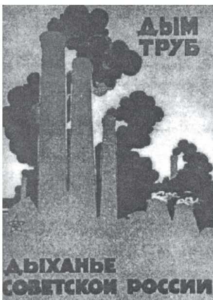
चित्र 14 - कारखानों को समाजवाद के प्रतीक की तरह माना जाता था. पोस्टर में लिखा है: 'चिमनियों से निकलता धुआँ ही सोवियत रूस की साँस है।'