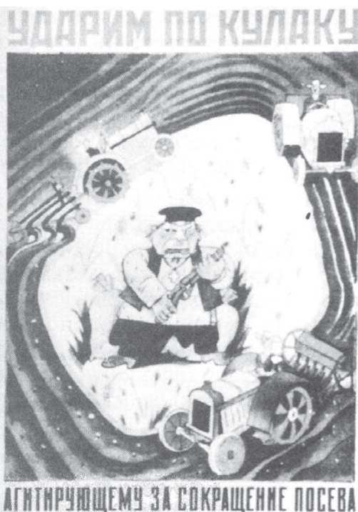
चित्र 18 - सामूहिकीकरण के दौर का एक पोस्टर.

वी. सोकोलोव (सं.), ऑब्श्चेस्त्वो 1 व्लास्त, वी 1930-ये गोदी (मास्को, 1997)।