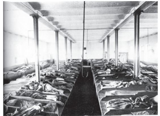
चित्र 6 - क्रांति-पूर्व रूस में एक डॉर्मिटरी में बने बंकर में सोते मजदूर. वे पालियों में बारी-बारी से सोते थे और परिवार को साथ नहीं रख सकते थे।