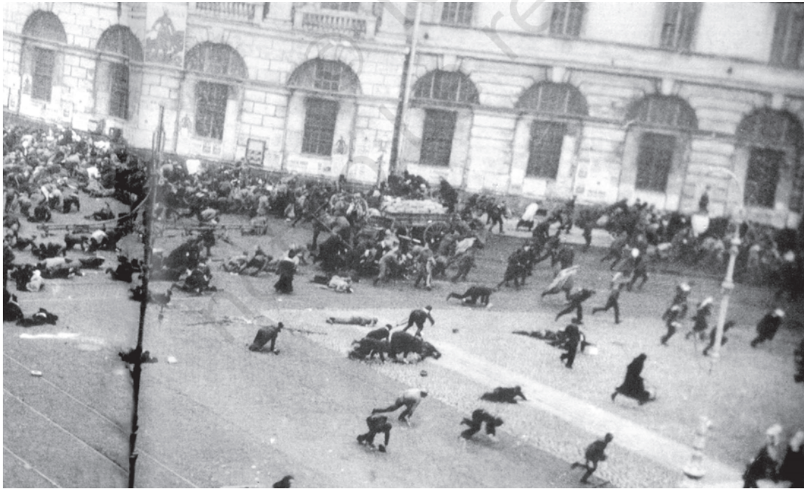
चित्र 10 - जुलाई के दिन .

17 जुलाई 1917 को बोल्शेविक समर्थक प्रदर्शनकारियों पर सेना द्वारा गोलीबारी का दृश्य।