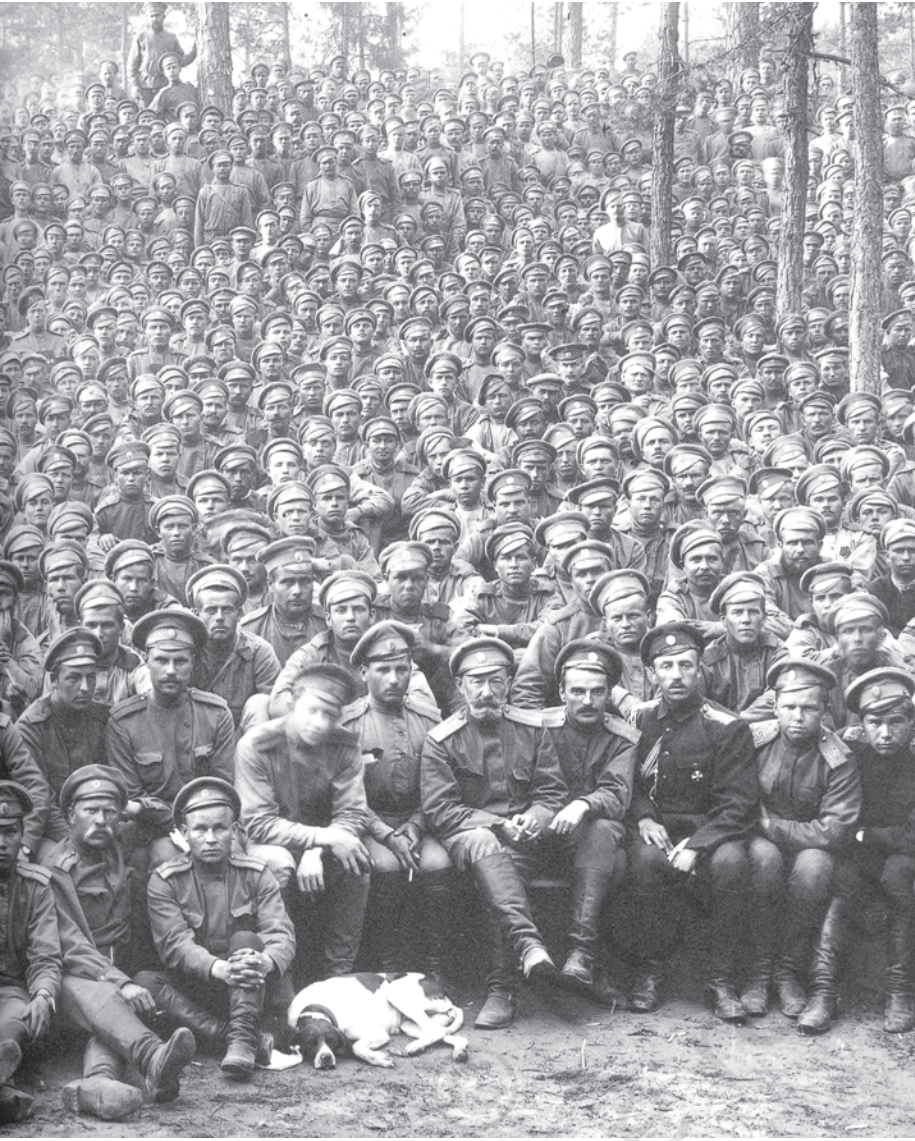
चित्र 7 - पहले विश्वयुद्ध के दौरान रूसी सिपाही . शाही रूसी सेना को 'रूसी स्टीमरोलर' कहा जाता था। यह दुनिया की सबसे बड़ी सशस्त्र सेना थी। जब इस सेना ने अपनी निष्ठा बदल कर क्रांतिकारियों को समर्थन देना शुरू कर दिया तो जार की सत्ता भी ढह गई।

युद्ध से उद्योगों पर भी बुरा असर पड़ा। रूस के अपने उद्योग तो वैसे भी बहुत कम थे, अब तो बाहर से मिलने वाली आपूर्ति भी बंद हो गई क्योंकि बाल्टिक समुद्र में जिस रास्ते से विदेशी औद्योगिक सामान आते थे उस पर जर्मनी का कब्जा हो चुका था। यूरोप के बाकी देशों के मुकाबले रूस के औद्योगिक उपकरण ज़्यादा तेजी से बेकार होने लगे। 1916 तक रेलवे लाइनें टूटने लगीं। अच्छी सेहत वाले मर्दों को युद्ध में झोंक दिया गया। देश भर में मज़दूरों की कमी पड़ने लगी और ज़रूरी सामान बनाने वाली छोटी-छोटी वर्कशॉप्स ठप्प होने लगीं। ज़्यादातर अनाज सैनिकों का पेट भरने के लिए मोर्चे पर भेजा जाने लगा। शहरों में रहने वालों के लिए रोटी और आटे की किल्लत पैदा हो गई। 1916 की सर्दियों में रोटी की दुकानों पर अकसर दंगे होने लगे।