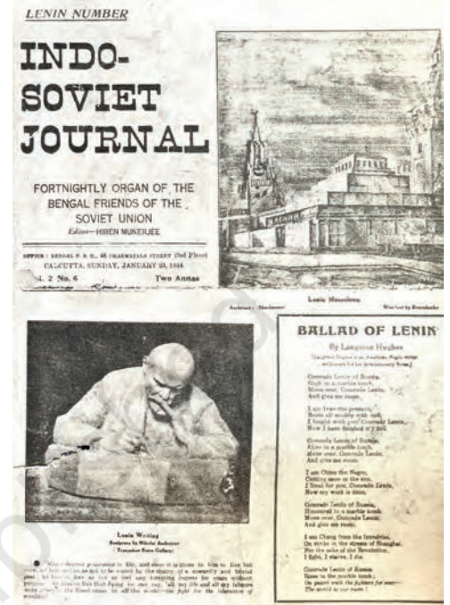
चित्र 20 - इंडो-सोवियत जर्नल का लेनिन विशेषांक । दूसरे विश्वयुद्ध के दौरान भारतीय कम्युनिस्टों ने सोवियत संघ के लिए जनमत निर्माण किया।