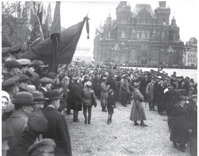
चित्र 13 - मास्को में मई दिवस का प्रदर्शन, 1918.