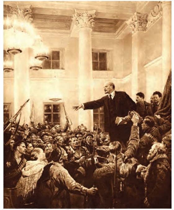
चित्र 9 - अप्रैल 1917 में मज़दूरों को संबोधित करते लेनिन की एक बोल्शेविक छवि .

गांवों में किसान और उनके समाजवादी क्रांतिकारी नेता भूमि पुनर्वितरण के लिए दबाव डालने लगे थे। इस काम के लिए भूमि समितियाँ बना दी गई थीं। सामाजिक क्रांतिकारियों से प्रेरणा और प्रोत्साहन लेते हुए जुलाई से सितंबर के बीच किसानों ने बहुत सारी ज़मीन पर कब्ज़ा कर लिया।