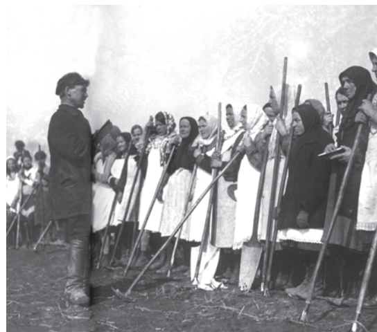
चित्र 19 - विशाल सामूहिक फ़ार्मों में काम करने के लिए जुटी किसान औरतें.

वी. सोकोलोव (सं.), ऑब्खाचेस्त्वो I व्लास्त, वी 1930-ये गोदी