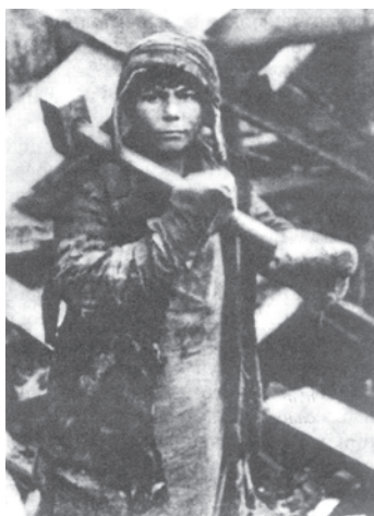
चित्र 16 - पहली पंचवर्षीय योजना के दौरान मैग्नीटोगोस्क का एक बच्चा. यह बच्चा सोवियत रूस के लिए काम कर रहा है।