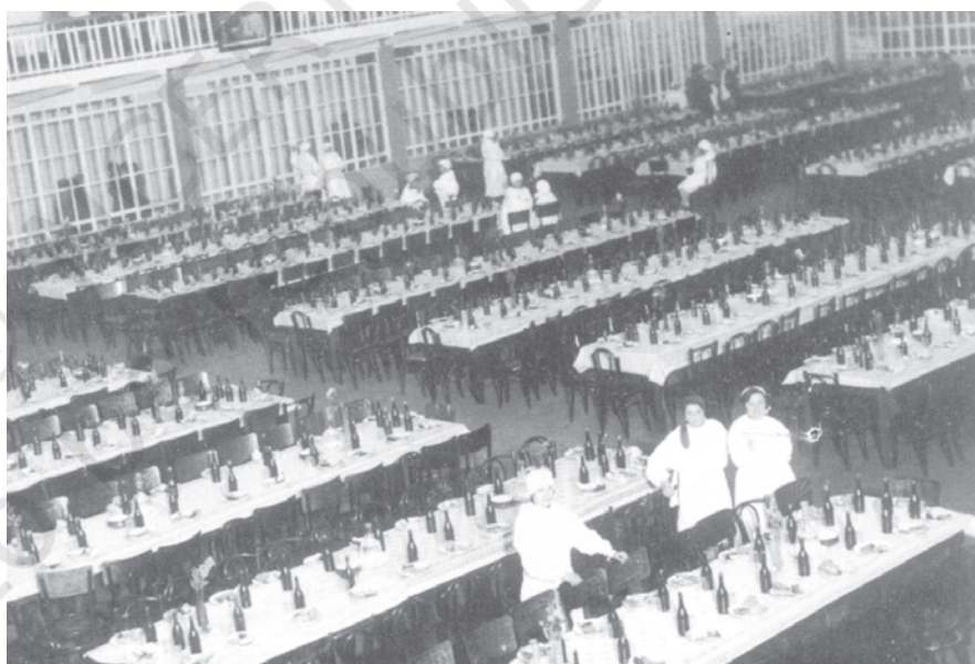
चित्र 17 - तीस के दशक में एक कारखाने का भोजन कक्ष.