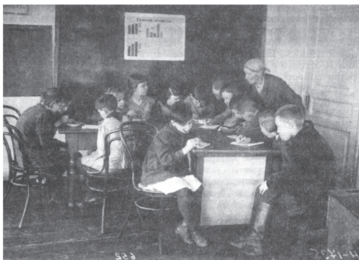
चित्र 15 - तीस के दशक में सोवियत रूस के एक स्कूल में पढ़ते बच्चे. बच्चे सोवियत अर्थव्यवस्था का अध्ययन कर रहे हैं।