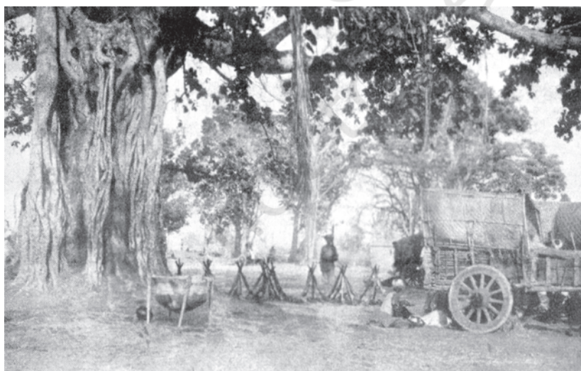
चित्र 19 - बस्तर में सेना का कैंप 1910.

1947 में बस्तर रियासत को काँकर रियासत में मिला दिया गया और यह पूरा क्षेत्र मध्य प्रदेश का बस्तर ज़िला बना। 1998 में इस ज़िले को एक बार फिर काँकर, बस्तर और दांतेवाड़ा ज़िलों में बाँट दिया गया। 2000 में ये जिले छत्तीसगढ़ का हिस्सा बन गए। 1990 का विद्रोह काँकर वन क्षेत्र (घेरे में) से ही शुरू हुआ था और जल्दी ही राज्य के अन्य क्षेत्रों में फैल गया।