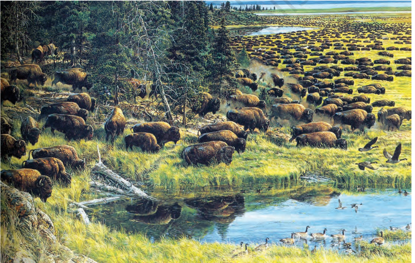
चित्र 2 - हेन द वैलीज़ वर फुल ( जब घाटियाँ भरी पड़ी थीं )। जॉन डॉसन की पेंटिंग।

सन् 1600 में हिंदुस्तान के कुल भू-भाग के लगभग छठे हिस्से पर खेती होती थी। आज यह आँकड़ा बढ़ कर आधे तक पहुँच गया है। इन सदियों के दौरान जैसे-जैसे आबादी बढ़ती गयी और खाद्य पदार्थों की माँग में भी वृद्धि हुई, वैसे-वैसे किसान भी जंगलों को साफ़ करके खेती की सीमाओं को विस्तार देते गए। औपनिवेशिक काल में खेती में तेज़ी से फैलाव आया।