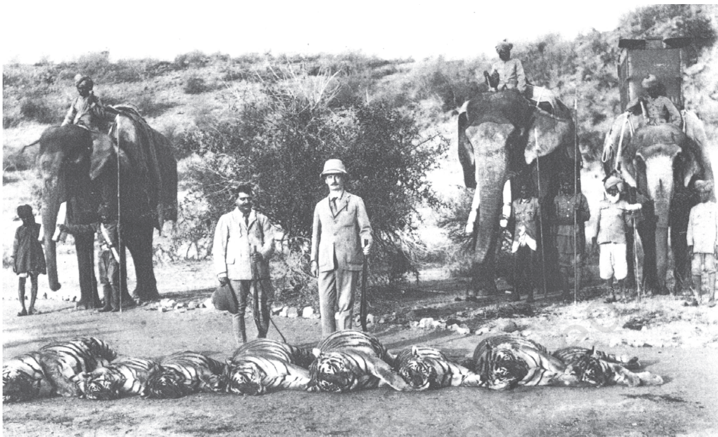
चित्र 18 - नेपाल में शिकार के बाद लॉर्ड रीडिंग.

फ़ोटो में मृत बाघों की गिनती करें। ब्रिटिश औपनिवेशिक अफ़सर और राजा जब शिकार के लिए जाते तब उनके साथ नौकरों की एक पूरी फ़ौज होती थी। गाँव के कुशल शिकारी हाँका लगाते थे और साहब को बस गोली भर चलाना होता था।