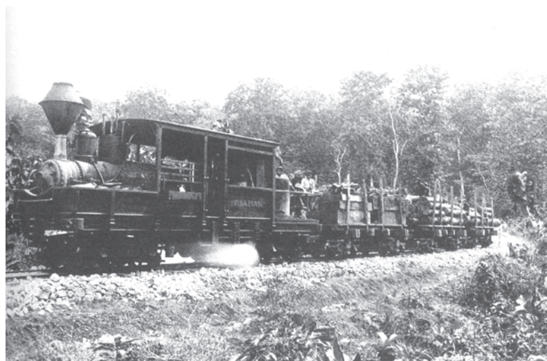
चित्र 21 - जंगल से सागौन की लकड़ी ले जाती मालगाड़ी, औपनिवेशिक शासन का अंतिम दौर.

भारत की ही तरह यहाँ भी जहाज़ और रेल-लाइनों के निर्माण ने वन-प्रबंधन और वन-सेवाओं को लागू करने की आवश्यकता पैदा कर दी। 1882 में अकेले जावा से ही 2,80,000 स्लीपरों का निर्यात किया गया। ज़ाहिर है कि पेड़ काटने, लट्टों को ढोने और स्लीपर