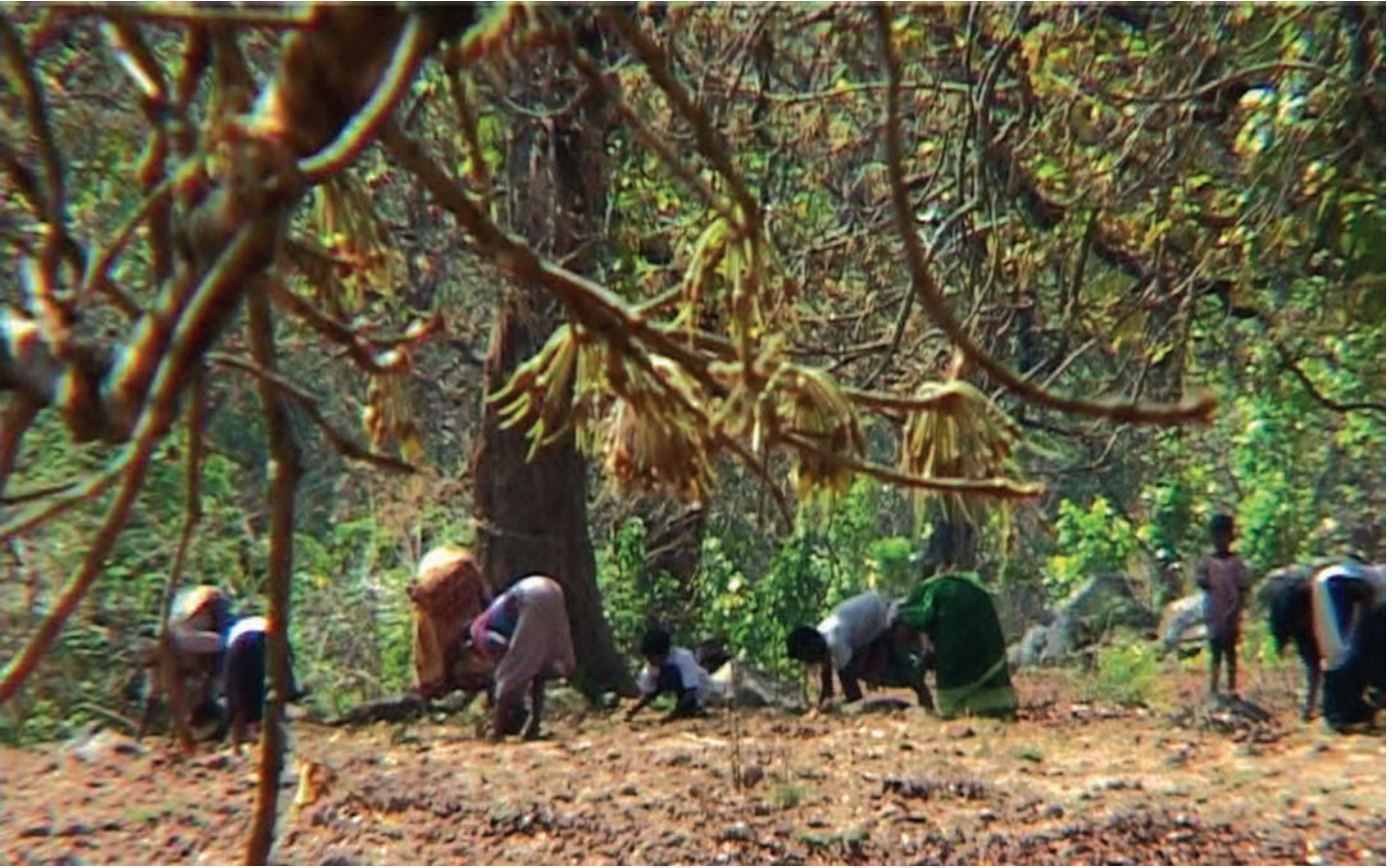
चित्र 12 - जंगलों से महुआ ( Madhuca Indica ) बीनना.

गाँव वाले उजाला होने के पहले ही उठकर जमीन पर गिरे हुए महुआ के फूलों को बीनने के लिए जंगल चले जाते। महुआ के पेड़ बेशकीमती हैं। महुआ के फूल खाए भी जा सकते हैं और इनका इस्तेमाल शराब बनाने के लिए भी किया जा सकता है। इसके बीजों से तेल भी बनाया जाता है।