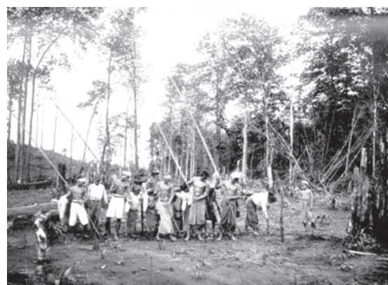
चित्र 15 - टोंग्या खेती एक ऐसी व्यवस्था थी जहाँ किसानों को कुछ समय के लिए बागानों में ही खेती करने की आज़ादी थी। 1921 में बर्मा के थरावाड़ी डिवीज़न से लिए गए इस चित्र में किसान धान बो रहे हैं। लोहे के छोर वाले लंबे बाँसों की सहायता से पुरुष धरती में छेद बनाते थे। औरतें प्रत्येक छेद में धान बोती थीं।

यूरोपीय वन रक्षकों की नज़र में यह तरीका जंगलों के लिए नुकसानदेह था। उन्होंने महसूस किया कि जहाँ कुछेक सालों के अंतर पर खेती की जा रही हो ऐसी ज़मीन पर रेलवे के लिए इमारती लकड़ी वाले पेड़ नहीं उगाए