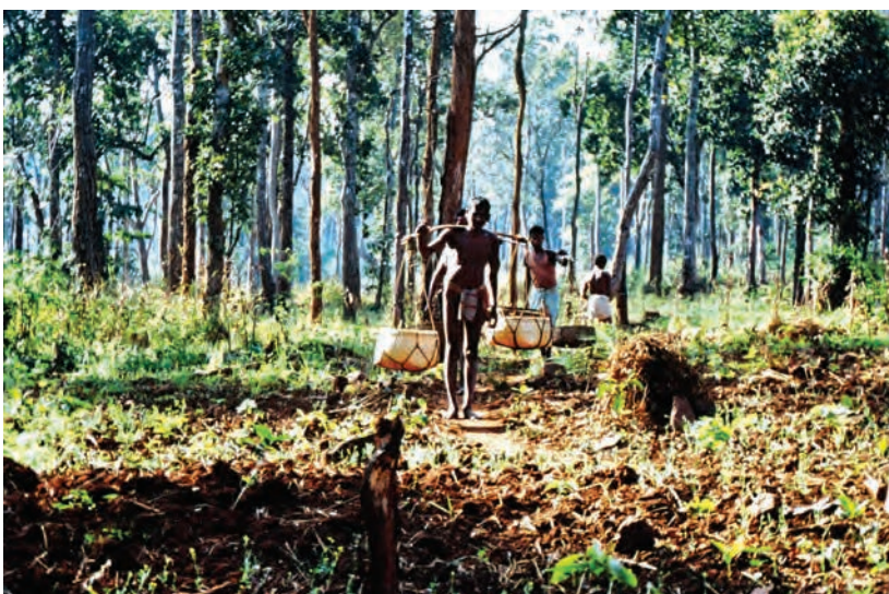
चित्र 14 - खलिहानों से अनाज लाते हुए.

खलिहानों से पुरुष टोकरियों में अनाज ला रहे हैं। पुरुष अपने कंधों के आर-पार एक छड़ी में बंधी टोकरियों को लाते हैं जबकि औरतें इन टोकरियों को अपने सिर पर रख कर लाती हैं।