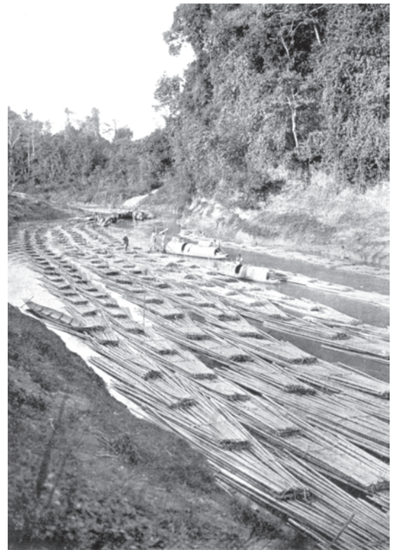
चित्र 4 - बाँस के बेड़े कासालाँग नदी में बह कर जाते हुए, चिडुगाँव पर्वतीय पट्टी.

भारत में रेल-लाइनों का जाल 1860 के दशक से तेज़ी से फैला। 1890 तक लगभग 25,500 कि.मी. लंबी लाइनें बिछायी जा चुकी थीं। 1946 में इन लाइनों की लंबाई 7,65,000 कि.मी. तक बढ़ चुकी थी। रेल लाइनों के प्रसार के साथ-साथ बड़ी तादाद में पेड़ भी काटे गए। अकेले मद्रास प्रेसीडेंसी में 1850 के दशक में प्रतिवर्ष 35,000 पेड़ स्लीपरों के लिए काटे गए। सरकार ने आवश्यक मात्रा की आपूर्ति के लिए निजी ठेके दिए। इन ठेकेदारों ने बिना सोचे-समझे पेड़ काटना शुरू कर दिया। रेल लाइनों के इर्द-गिर्द जंगल तेज़ी से गायब होने लगे।