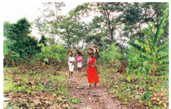
चित्र 6 - ईंधन की लकड़ी इकट्ठा कर घर को लौटती औरतें.