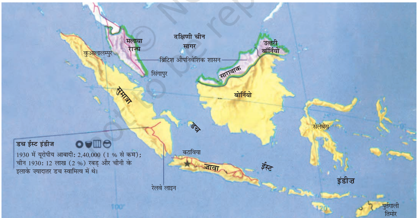
चित्र 22 - इंडोनेशिया के ज्यादातर जंगल सुमात्रा, कालिमांतान व पश्चिम इरियान में स्थित हैं। जावा ही वह जगह है जहाँ डचों ने अपनी 'वैज्ञानिक वानिकी' की शुरुआत की थी। यह द्वीप जो अब चावल उत्पादन के लिए मशहूर है, कभी सागौन के जंगलों से ढका रहता था।

डर्क वॉन होजेनडॉर्फ; पेलूसो, रिच फ़ॉरेस्ट्स, पुअर पीपुल, 1992 में उद्धृत।