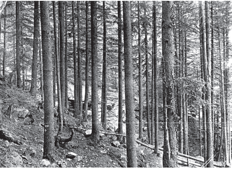
चित्र 10 - काँगड़ा का एक देवदार बागान, 1933. इंडियन फ़ॉरेस्ट रिकॉर्ड्स, भाग XV से।

किसी भी व्यक्ति को सजा का भागी बनना होगा। इस तरह ब्रैडिस ने 1864 में भारतीय वन सेवा की स्थापना की और 1865 के भारतीय वन अधिनियम को सूत्रबद्ध करने में सहयोग दिया। इम्पीरियल फ़ॉरेस्ट रिसर्च इंस्टीट्यूट की स्थापना 1906 में देहरादून में हुई। यहाँ जिस पद्धति की शिक्षा दी जाती थी उसे 'वैज्ञानिक वानिकी' (साइंटिफ़िक फ़ॉरेस्ट्री) कहा गया। लेकिन आज पारिस्थितिकी विशेषज्ञों सहित ज़्यादातर लोग मानते हैं कि यह पद्धति कतई वैज्ञानिक नहीं है।