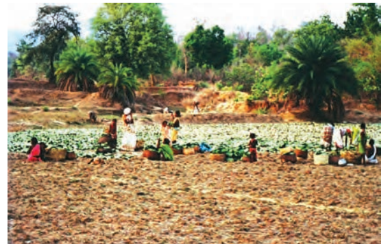
चित्र 13 - सूखते हुए तेंदू-पत्ते.

वन्य इलाकों में लोग कंद-मूल-फल, पत्ते आदि वन-उत्पादों का विभिन्न जरूरतों के लिए उपयोग करते हैं। फल और कंद अत्यंत पोषक खाद्य हैं, विशेषकर मॉनसून के दौरान जब फसल कट कर घर न आयी हो। दवाओं के लिए जड़ी-बूटियों का इस्तेमाल होता है, लकड़ी का प्रयोग हल जैसे खेती के औजार बनाने में किया जाता है, बाँस से बेहतरीन बाड़ें बनायी जा सकती हैं और इसका उपयोग छतरी तथा टोकरी बनाने के लिए भी किया जा सकता है। सूखे हुए कुम्हड़े के खोल का प्रयोग पानी की बोतल के रूप में किया जा सकता है। जंगलों में लगभग सब कुछ उपलब्ध है - पत्तों को जोड़-जोड़ कर 'खाओ-फेंको' किस्म के पत्तल और दोने बनाए जा सकते हैं, सियादी ( Bauharia vahili ) की लताओं से रस्सी बनायी जा सकती है, सेमूर (सूती रेशम) की काँटेदार छाल पर सब्जियाँ छीली जा सकती हैं, महुए के पेड़ से खाना पकाने और रोशनी के लिए तेल निकाला जा सकता है।