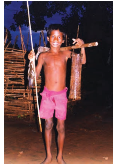
चित्र 17 - मछली मारने वाला लड़का.

जहाँ एक तरफ़ वन कानूनों ने लोगों को शिकार के परंपरागत अधिकार से वंचित किया, वहीं बड़े जानवरों का आखेट एक खेल बन गया। हिंदुस्तान में बाघों और दूसरे जानवरों का शिकार करना सदियों से दरबारी और नवाबी संस्कृति का हिस्सा रहा था। अनेक मुगल कलाकृतियों में शहज़ादों और सम्राटों को शिकार का मज़ा लेते हुए दिखाया गया है। किंतु औपनिवेशिक शासन के दौरान शिकार का चलन इस पैमाने तक बढ़ा कि कई प्रजातियाँ