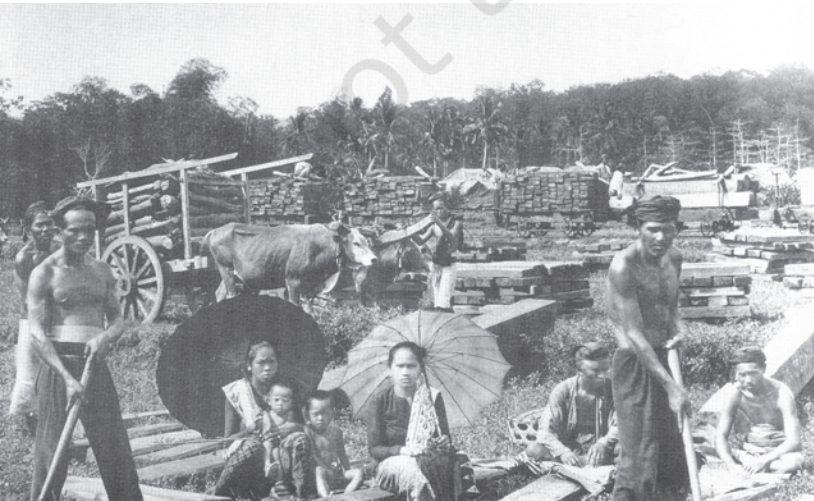
चित्र 24 - डच औपनिवेशिक शासन के अधीन रेमबैंग में लट्ठों का गोदाम.

अस्सी के दशक से एशिया और अफ्रीका की सरकारों को यह समझ में आने लगा कि वैज्ञानिक वानिकी और वन समुदायों को जंगलों से बाहर रखने की नीतियों के चलते बार-बार टकराव पैदा होते हैं। परिणामस्वरूप, वनों से इमारती लकड़ी हासिल करने के बजाय जंगलों का संरक्षण ज़्यादा महत्वपूर्ण लक्ष्य बन गया है। सरकार ने यह भी मान लिया है कि इस लक्ष्य को हासिल करने के लिए वन प्रदेशों में रहने वालों की मदद लेनी होगी। मिज़ोरम से लेकर केरल तक हिंदुस्तान में हर कहीं घने जंगल सिर्फ इसलिए बच पाए कि ग्रामीणों ने सरना, देवराकुडु, कान, राई इत्यादि नामों से पवित्र बगीचा समझ कर इनकी रक्षा की। कुछ गाँव तो वन-रक्षकों पर निर्भर रहने के बजाय अपने जंगलों की चौकसी आप करते रहे हैं - इसमें हर परिवार बारी-बारी से अपना योगदान देता है। स्थानीय वन-समुदाय और पर्यावरणविद् अब वन-प्रबंधन के वैकल्पिक तरीकों के बारे में सोचने लगे हैं।