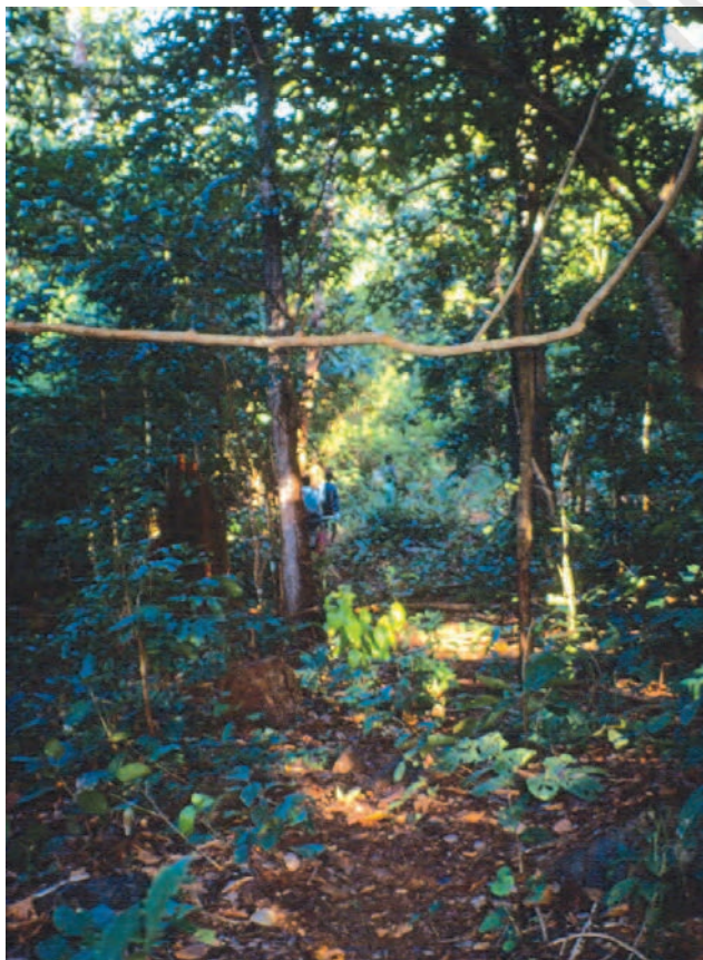
चित्र 1 - यह छत्तीसगढ़ का एक साल वन है।

यह विविधता तेज़ी से लुप्त होती जा रही है। औद्योगिकीकरण के दौर में सन् 1700 से 1995 के बीच 139 लाख वर्ग किलोमीटर जंगल यानी दुनिया के कुल क्षेत्रफल का 9.3 प्रतिशत भाग औद्योगिक इस्तेमाल, खेती-बाड़ी, चरागाहों व ईंधन की लकड़ी के लिए साफ़ कर दिया गया।