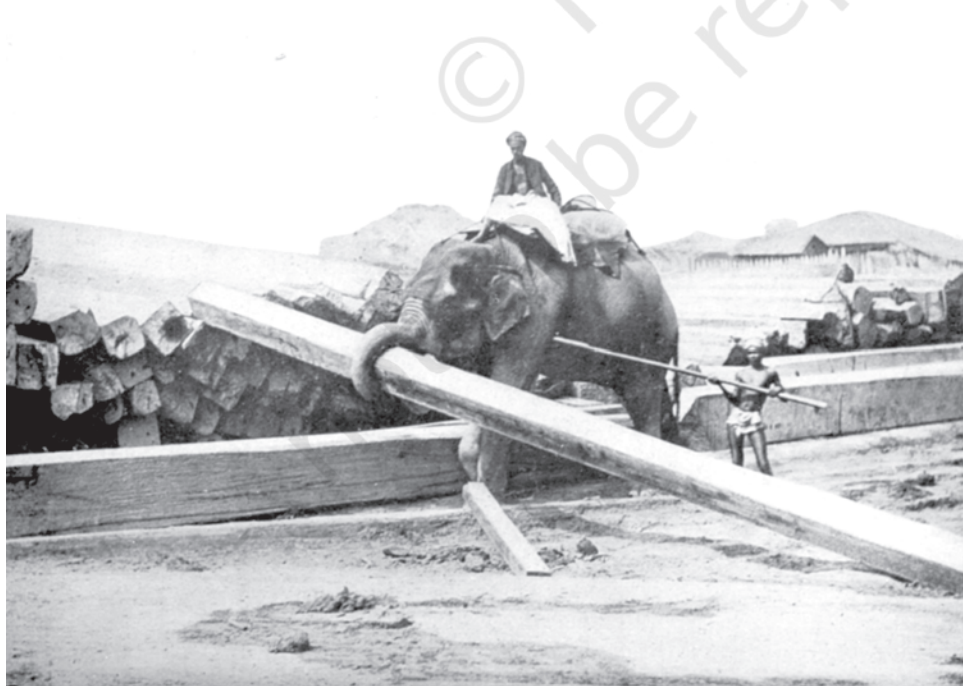
चित्र 5 - रंगून के एक लकड़ी गोदाम में लकड़ी के शहतीर सहेजता हुआ हाथी.

औपनिवेशिक दौर में अक्सर हाथियों का इस्तेमाल जंगलों और लकड़ी के गोदामों में भारी-भरकम लकड़ी को उठाने के लिए किया जाता था।