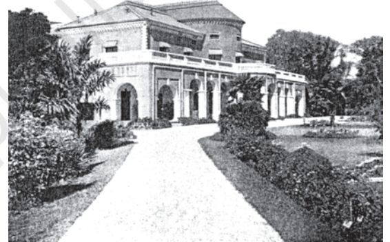
चित्र 11 - दि इम्पीरियल फ़ॉरेस्ट स्कूल देहरादून, भारत. ब्रिटिश साम्राज्य में खुला पहला वानिकी स्कूल।

एक अच्छा जंगल कैसा होना चाहिए इसके बारे में वनपालों और ग्रामीणों के विचार बहुत अलग थे। जहाँ एक तरफ ग्रामीण अपनी अलग-अलग ज़रूरतों,