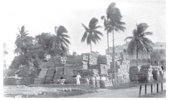
चित्र 23 - इंडियन म्यूनिशन्स बोर्ड, सूले पैगोड़ा पर एकत्रित जहाज़ों में लादने को तैयार वॉर टिम्बर स्लीपर, 1917 .

पहले और दूसरे विश्वयुद्ध का जंगलों पर गहरा असर पड़ा। भारत में तमाम चालू कार्ययोजनाओं को स्थगित करके वन विभाग ने अंग्रेजों की जंगी ज़रूरतों को पूरा करने के लिए बेतहाशा पेड़ काटे। जावा पर जापानियों के कब्जे से ठीक पहले डचों ने 'भस्म-कर-भागो नीति' (Scorched Earth Policy) अपनायी जिसके तहत आरा-मशीनों और सागौन के विशाल लट्ठों के ढेर जला दिए गए जिससे वे जापानियों के हाथ न लग पाएँ। इसके बाद जापानियों ने वनवासियों को जंगल काटने के लिए बाध्य करके अपने युद्ध उद्योग के लिए जंगलों का निर्मम दोहन किया। बहुत सारे गाँव वालों ने इस अवसर का लाभ उठा कर जंगल में अपनी खेती का विस्तार किया। जंग के बाद इंडोनेशियाई वन सेवा के लिए इन ज़मीनों को वापस हासिल कर पाना कठिन था। हिंदुस्तान की ही तरह यहाँ भी खेती योग्य भूमि के प्रति लोगों की चाह और ज़मीन को नियन्त्रित करने तथा लोगों को उससे बाहर रखने की वन विभाग की ज़िद के बीच टकराव पैदा हुआ।