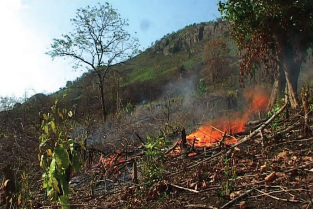
चित्र 16 - जंगल के पेदा या पोदू हिस्सों को जलाना.

घुमंतू खेती में जंगलों को साफ़ किया जाता है। सामान्यतः चट्टानों की ढलानों पर पेड़ों को काटने के बाद राख के लिए इन्हें जला दिया जाता है। इसके बाद इस क्षेत्र में फिर बीज बिखेर दिए जाते हैं और वर्षा से सिंचाई के लिए इन्हें छोड़ दिया जाता है।