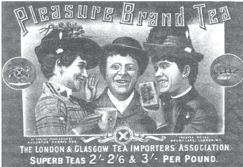
चित्र 8 - प्लेज़र ब्रांड चाय

यूरोप में चाय, कॉफ़ी और रबड़ की बढ़ती माँग को पूरा करने के लिए इन वस्तुओं के बागान बने और इनके लिए भी प्राकृतिक वनों का एक भारी हिस्सा साफ़ किया गया। औपनिवेशिक सरकार ने जंगलों को अपने कब्जे में लेकर उनके विशाल हिस्सों को बहुत सस्ती दरों पर यूरोपीय बागान मालिकों को सौंप दिया। इन इलाकों की बाड़ाबंदी करके जंगलों को साफ़ कर दिया गया और चाय-कॉफ़ी की खेती की जाने लगी।