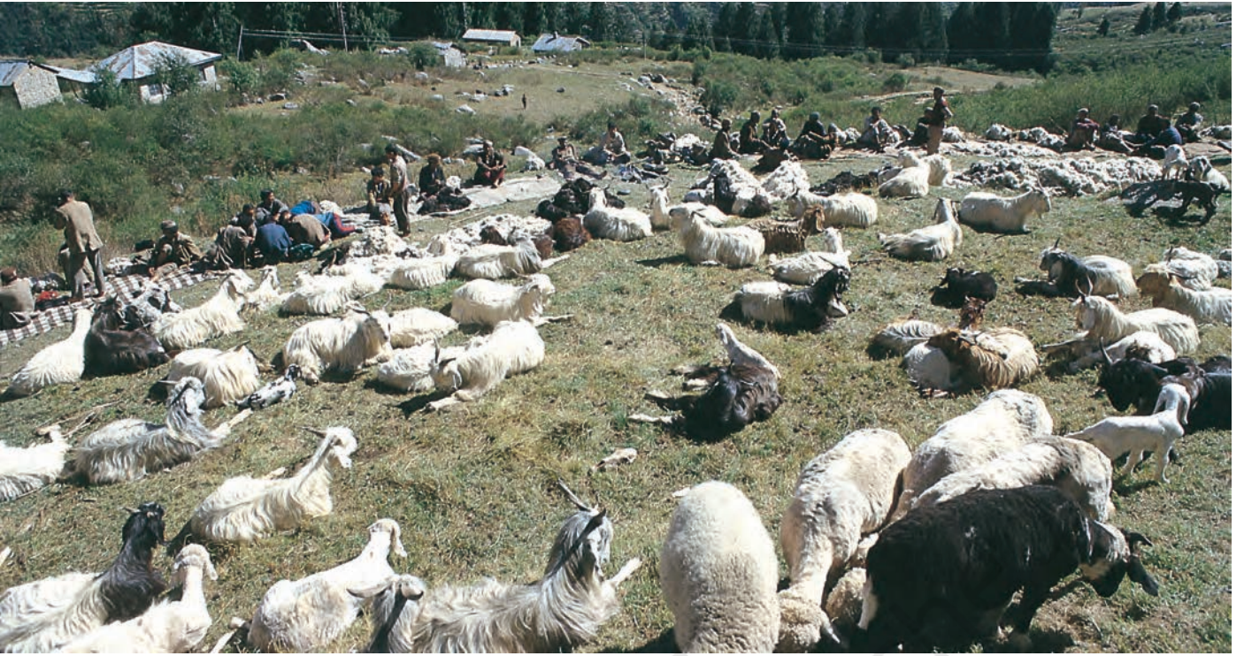
चित्र 3 - ऊन उतारने का इंतज़ार। हिमाचल प्रदेश स्थित पालमपुर के पास उहल घाटी।

और स्पीति के गाँवों में एक बार फिर कुछ समय के लिए रुकते। इस बीच वे गर्मियों की फ़सलें काटते और सर्दियों की फ़सलों की बुवाई करके आगे बढ़ जाते। यहाँ से वे अपने रेवड़ लेकर शिवालिक की पहाड़ियों में जाड़ों वाले चरागाहों में चले जाते और अगली अप्रैल में भेड़-बकरियाँ लेकर वे दोबारा गर्मियों के चरागाहों की तरफ़ रवाना हो जाते।