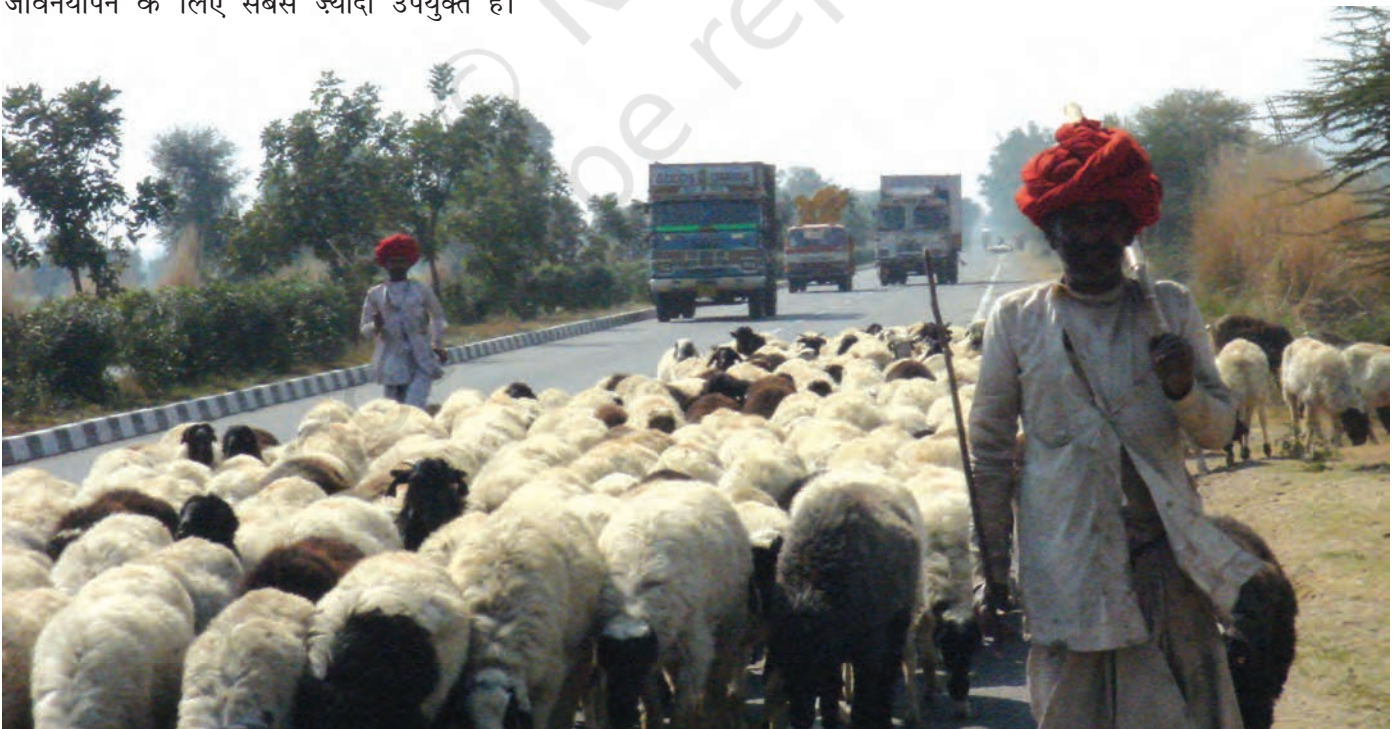
चित्र 18 - जयपुर राजमार्ग पर राइका गड़रिये.

चरवाहे अतीत के अवशेष नहीं हैं। वे ऐसे लोग नहीं हैं जिनके लिए आज की आधुनिक दुनिया में कोई जगह नहीं है। पर्यावरणवादी और अर्थशास्त्री अब इस बात को काफ़ी गंभीरता से मानने लगे हैं कि घुमंतू चरवाहों की जीवनशैली दुनिया के बहुत सारे पहाड़ी और सूखे इलाकों में जीवनयापन के लिए सबसे ज़्यादा उपयुक्त है।