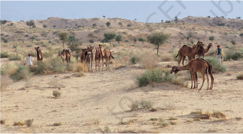
चित्र 5 - पश्चिमी राजस्थान के थार रेगिस्तान में चरते राइका समुदाय के ऊँट.

धंगर महाराष्ट्र का एक जाना-माना चरवाहा समुदाय है। बीसवीं सदी की शुरुआत में इस समुदाय की आबादी लगभग 4,67,000 थी। उनमें से ज्यादातर गड़रिये या चरवाहे थे हालाँकि कुछ लोग कम्बल और चादरें भी बनाते थे जबकि कुछ भैंस पालते थे। धंगर गड़रिये बरसात के दिनों में महाराष्ट्र के मध्य पठारों में रहते थे। यह एक अर्ध-शुष्क इलाका था जहाँ बारिश बहुत कम होती थी और मिट्टी भी खास उपजाऊ नहीं थी। चारों तरफ सिर्फ कंटैली झाड़ियाँ होती थीं। बाजरे जैसी सूखी फ़सलों के अलावा यहाँ और कुछ नहीं उगता था। मॉनसून में यह पट्टी धंगरों के जानवरों के लिए एक विशाल चरागाह बन जाती थी। अक्टूबर के आसपास धंगर बाजरे की कटाई करते थे और चरागाहों की तलाश में पश्चिम की तरफ चल पड़ते थे। करीब महीने भर पैदल चलने के बाद वे अपने रेवड़ों के साथ कोंकण के इलाके में जाकर डेरा डाल देते थे। अच्छी बारिश और उपजाऊ मिट्टी की बदौलत इस इलाके में खेती खूब होती थी। कोंकणी किसान भी इन चरवाहों का दिल खोलकर स्वागत करते थे। जिस समय धंगर कोंकण पहुँचते थे उसी समय कोंकण के किसानों को खरीफ़ की फ़सल काट कर अपने खेतों को रबी की फ़सल के लिए दोबारा उपजाऊ बनाना होता था।