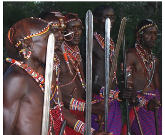
चित्र 16 - योद्धा गहरे लाल रंग की शुका और चमकदार मोतियों के आभूषण पहनते हैं तथा स्टील की नोक वाला पाँच फुट लंबा भाला रखते हैं। बारीकी से सँवारे गए उनके बाल गेरू से रंगे होते हैं। उगते सूरज को सम्मान देने के लिए वे पूर्व की ओर मुँह करके खड़े होते हैं। योद्धा अपने समुदाय की रक्षा करते हैं और लड़के पशुओं को चराते हैं। सूखे के मौसम में योद्धा और लड़के, दोनों ही पशु चराते हैं।

औपनिवेशिक काल में अफ्रीका के बाकी स्थानों की तरह मासाइलैंड में भी आए बदलावों से सारे चरवाहों पर एक जैसा असर नहीं पड़ा। उपनिवेश बनने से पहले मासाई समाज दो सामाजिक श्रेणियों में बँटा हुआ था – वरिष्ठ जन (एल्डर्स) और योद्धा (वॉरियर्स)। वरिष्ठ जन शासन चलाते थे। समुदाय से जुड़े मामलों पर विचार-विमर्श करने और अहम फैसले लेने के लिए वे समय-समय पर सभा करते थे। योद्धाओं में ज़्यादातर नौजवान होते थे जिन्हें मुख्य रूप से लड़ाई लड़ने और कबीले की हिफ़ाज़त करने के लिए तैयार किया जाता था। वे समुदाय की रक्षा करते थे और दूसरे कबीलों के मवेशी छीन कर लाते थे। जहाँ जानवर ही संपत्ति हो वहाँ हमला करके दूसरों के जानवर छीन लेना एक महत्वपूर्ण काम होता था। अलग-अलग चरवाहा समुदायों की ताकत इन्हीं हमलों से तय होती थी। युवाओं को योद्धा वर्ग का हिस्सा तभी माना जाता था जब वे दूसरे समूह के मवेशियों को छीन कर और