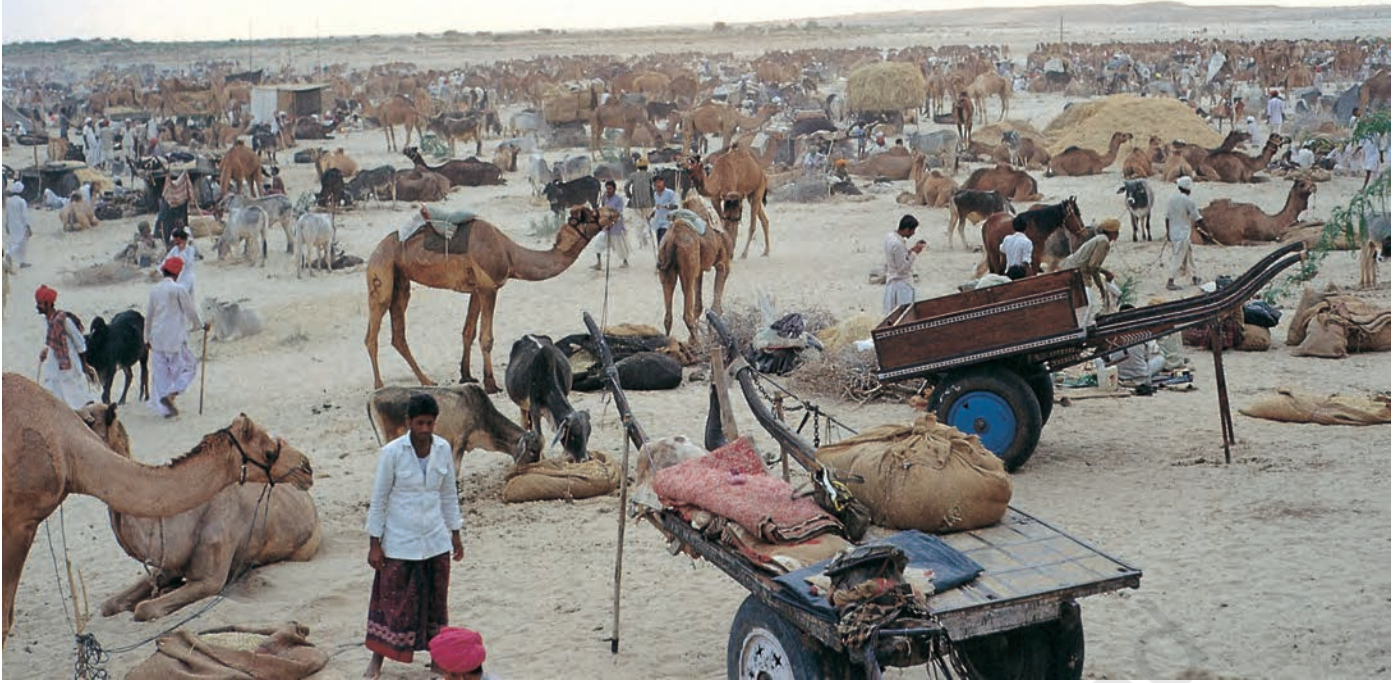
चित्र 7 - पश्चिमी राजस्थान में बलोतरा स्थित ऊँट मेला.

ऊँटपालक यहाँ ऊँटों की खरीद-फ़रोख़्त के लिए आते हैं। मेले में मारू राइका ऊँटों के प्रशिक्षण में अपनी महारत का भी प्रदर्शन करते हैं। इस मेले में गुजरात से घोड़े भी लाए जाते हैं।