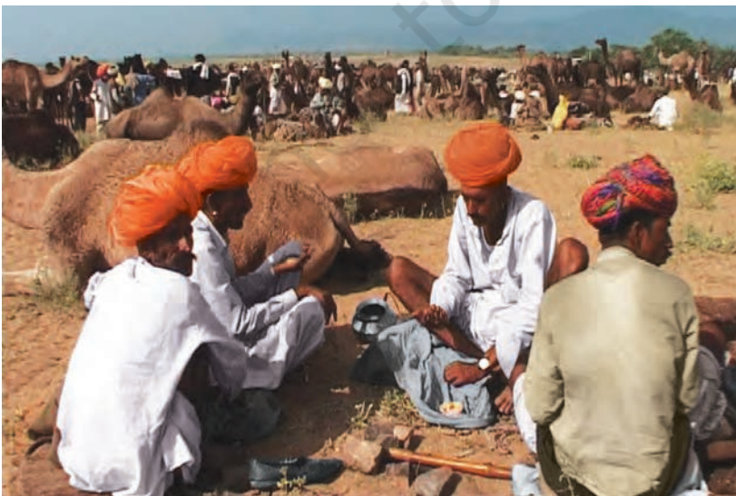
चित्र 8 - पुष्कर का ऊँट मेला.

आइए, अब देखें कि औपनिवेशिक शासन के दौरान यानी अंग्रेज़ों के ज़माने में चरवाहों का जीवन किस तरह बदला?