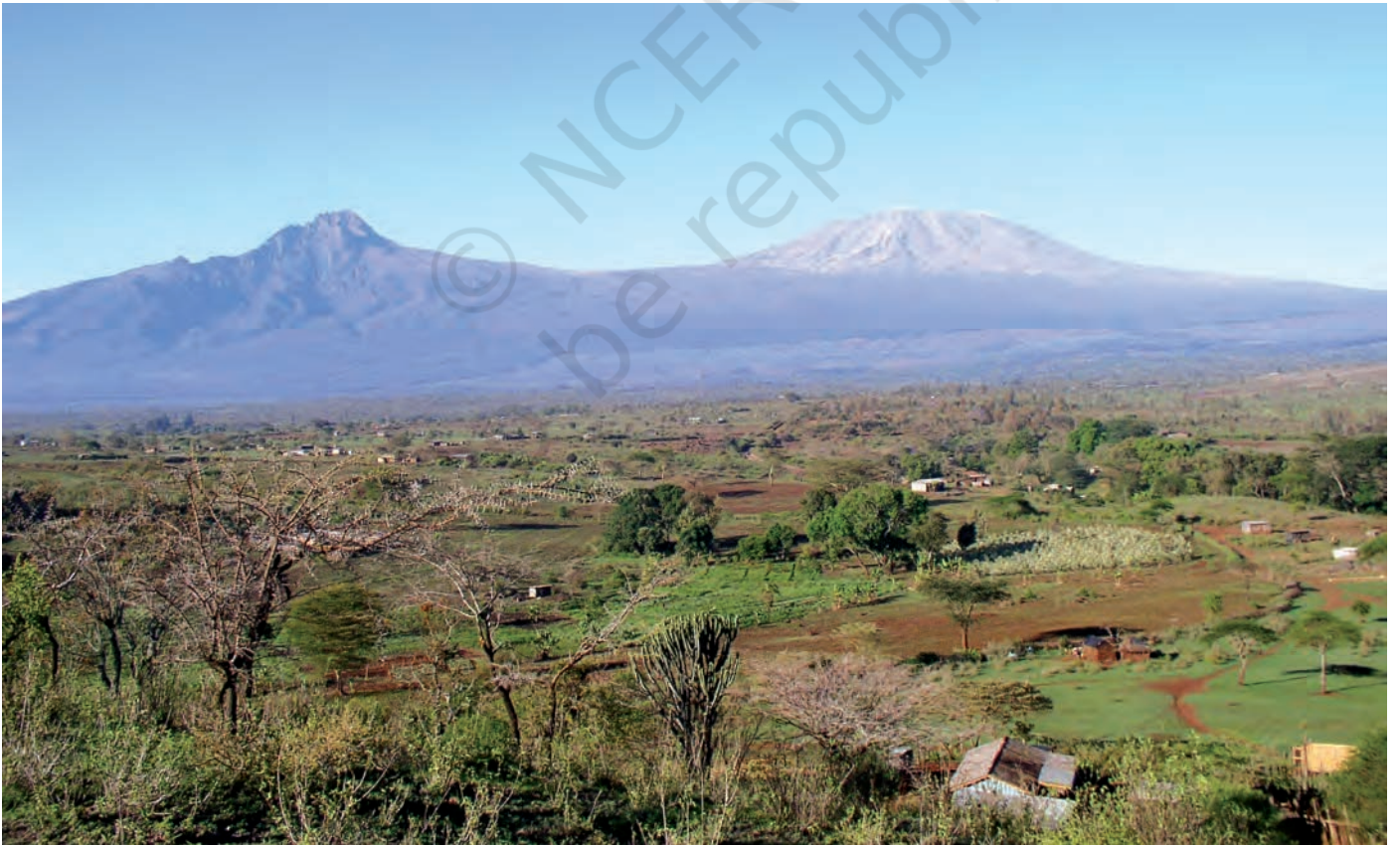
चित्र 12 - मासाई लैंड जिसके पीछे किलिमंजारो पहाड़ दिखाई दे रहे हैं।

हिंदुस्तान की तरह अफ्रीकी चरवाहों की ज़िंदगी में भी औपनिवेशिक और उत्तर-औपनिवेशिक काल में गहरे बदलाव आए हैं। आखिर क्या थे ये बदलाव?