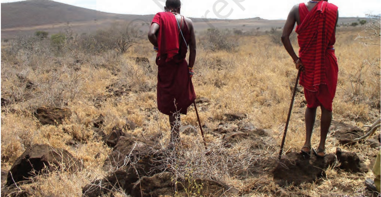
चित्र 14 - घास के बिना पशु (मवेशी, बकरियाँ और भेड़ें) कुपोषण का शिकार हो जाते हैं जिसका मतलब है कि चरवाहों के परिवारों और बच्चों के लिए भोजन कम पड़ने लगता है। सूखे और भोजन की सर्वाधिक कमी से ग्रस्त इलाका अम्बोसेली नैशनल पार्क के आसपास पड़ता है जिसकी पर्यटन से होने वाली आय पिछले साल लगभग 24 करोड़ कीनियन शिलिंग (लगभग 35 लाख अमेरिकी डॉलर) थी। किलिमंजारो जल परियोजना भी इसी इलाके से होकर जाती है लेकिन यहाँ रहने वाले समुदाय न तो पीने के लिए और न ही सिंचाई के लिए इस परियोजना के पानी का इस्तेमाल कर सकते हैं।

बहुत सारे चरागाहों को शिकारगाह बना दिया गया। कीनिया में मासाई मारा व साम्बूरू नैशनल पार्क और तंज़ानिया में सेरेन्गेटी पार्क जैसे शिकारगाह इसी तरह अस्तित्व में आए थे। इन आरक्षित जंगलों में चरवाहों का आना मना था। इन इलाकों में न तो वे शिकार कर सकते थे और न अपने जानवरों को चरा सकते थे। ऐसे बहुत सारे आरक्षित जंगलों में अब तक मासाई अपने ढोर-डंगर चराया करते थे। मिसाल के तौर पर सेरेन्गेटी नैशनल पार्क का 14,760 वर्ग किलोमीटर से भी ज़्यादा क्षेत्रफल मासाइयों के चरागाहों पर कब्ज़ा करके बनाया गया था।