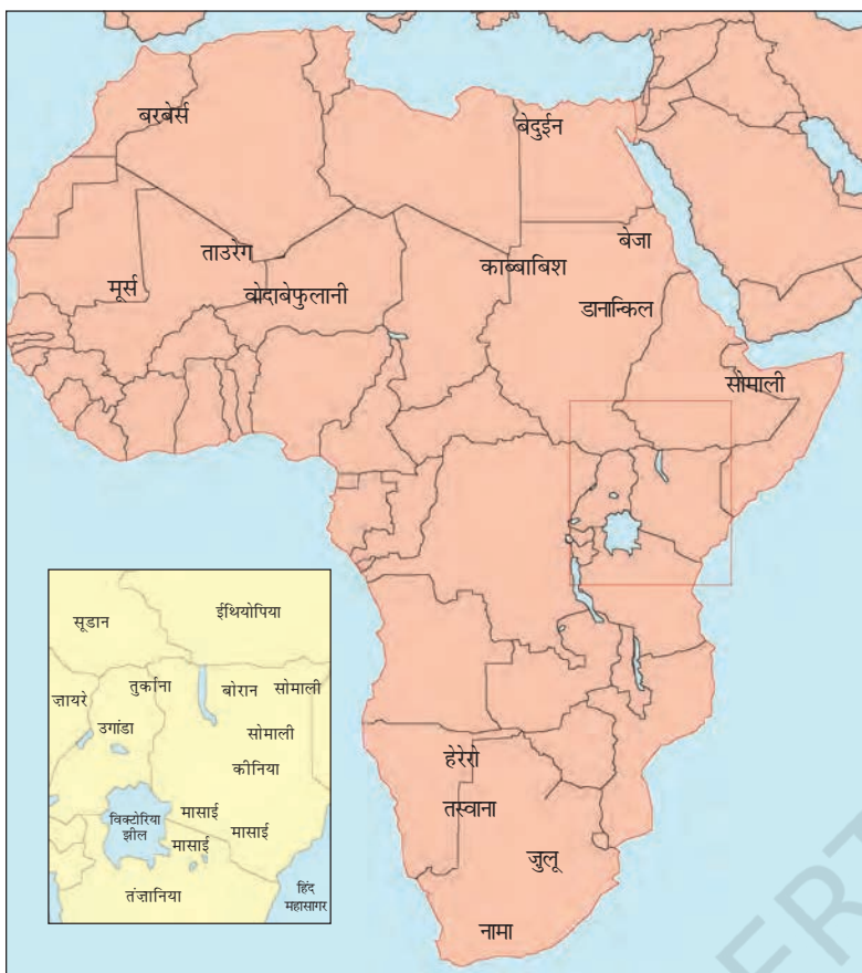
चित्र 13 - अफ्रीका के चरवाहा समुदाय.

छोटी तस्वीर (इनसेट) में कीनिया और तंज़ानिया में मासाइयों का इलाका दर्शाया गया है।