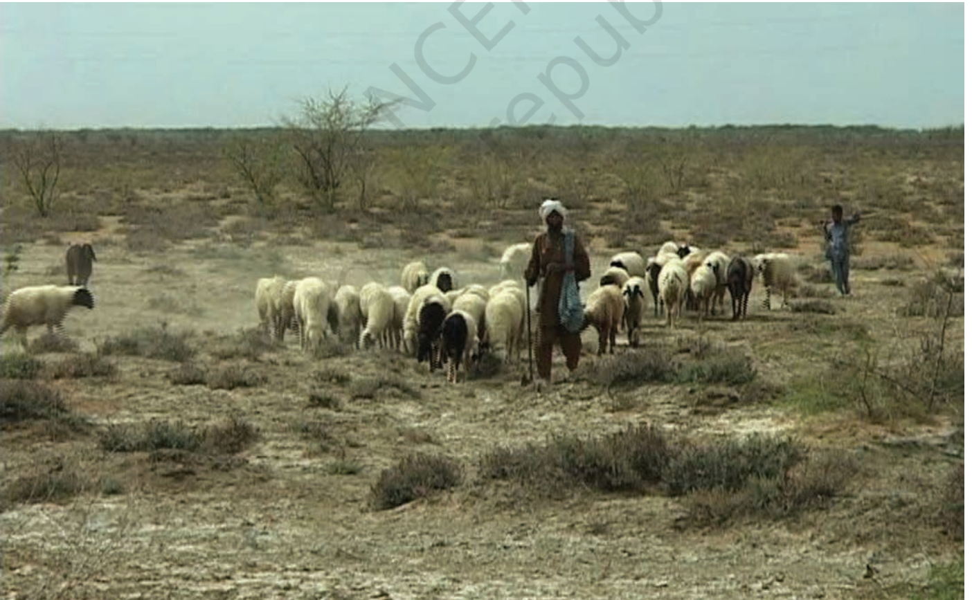
चित्र 10 - चरागाहों की तलाश में निकले मालधारी चरवाहे। उनके गाँव कच्छ की रन में स्थित हैं।

वंशावली बताने वाला समुदाय का इतिहास बताता है। इस तरह की मौखिक परंपराओं से चरवाहा समुदायों को अपनी पहचान का भाव मिलता है। इन परंपराओं से हम यह पता लगा सकते हैं कि कोई समूह अपने अतीत को किस तरह देखता है।