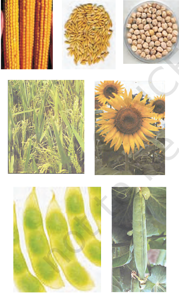
चित्र 12.1: विभिन्न प्रकार की फसलें

ऊर्जा की आवश्यकता के लिए अनाज; जैसे गेहूँ, चावल, मक्का, बाजरा तथा ज्वार से कार्बोहाइड्रेट प्राप्त होता है। दालें जैसे चना, मटर, उड़द, मूँग, अरहर, मसूर से प्रोटीन प्राप्त होती है और तेल वाले बीजों; जैसे सोयाबीन, मूँगफली, तिल, अरंड, सरसों, अलसी तथा सूरजमुखी से हमें आवश्यक वसा प्राप्त होती है (चित्र 12.1)। सब्जियाँ, मसाले तथा फलों से हमें विटामिन तथा खनिज लवण, कुछ मात्रा में प्रोटीन, वसा तथा कार्बोहाइड्रेट भी प्राप्त होते हैं। चारा फसलें; जैसे वर्सीम, जई अथवा सूडान घास का उत्पादन पशुधन के चारे के रूप में किया जाता है।