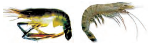
मेक्रोब्रेकियम रोजेन वर्गी (ताज़ा पानी) पीनस मोनडोन (समुद्री)

भविष्य में समुद्री मछलियों का भंडार (stock) कम होने की अवस्था में इन मछलियों की पूर्ति संवर्धन के द्वारा हो सकती है। इस प्रणाली को समुद्री संवर्धन (मेरीकल्चर) कहते हैं।