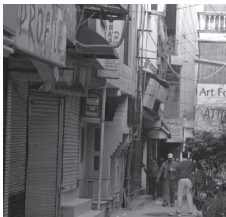
एक नगरीय गाँव का दृश्य

आजादी के बाद के दो दशकों में भारत में नगरीकरण की प्रक्रिया का प्रभाव स्पष्ट रूप से दिखने लगा था। नगरीकरण अनेक प्रकारों से हो रहा था। इस पर विचार व्यक्त करते हुए समाजशास्त्री एम. एस. ए. राव ने लिखा है कि भारत के कई गाँव भी तेजी से बढ़ रहे नगरीय प्रभाव में आ रहे थे। नगरीय प्रकृति का प्रभाव गाँवों का शहर या नगर से कैसा संबंध है पर निर्भर करता है। उन्होंने तीन भिन्न प्रकार के नगरीय प्रभावों की स्थिति की व्याख्या की है।