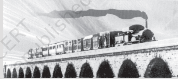
भारत में पहले क्रीक पुल जो कि थाणे के पास है। उसके ऊपर से गुजरती हुई रेलगाड़ी-1854

1861 और 1878 के बीच, 269 वर्ग मील का विस्तृत जंगल आरक्षित घोषित कर दिया गया। सन् 1894 तक यह क्षेत्र 3683 वर्गमील का हो गया। और यह बढ़ते-बढ़ते 19वीं सदी के अंत तक 20061 वर्ग मील का हो गया, (जिसमें कुल प्रांत का 42.2 प्रतिशत क्षेत्रफल था) इसमें से 3,609 वर्ग मील को आरक्षित रखा गया था। इसमें गौर करने की बात यह है कि जंगल का वो बड़ा क्षेत्र जिसमें आदिवासी समुदायों का निवास था और जो सदियों से वहाँ जीवनयापन करते आए थे, भी प्रशासकीय नियंत्रण में आ गया। पहाड़ी क्षेत्रों में आदिवासी जनजातीय समुदाय जंगलों से संबद्ध होकर प्रकृति के साथ मैत्रीपूर्ण जीवन जीते थे।