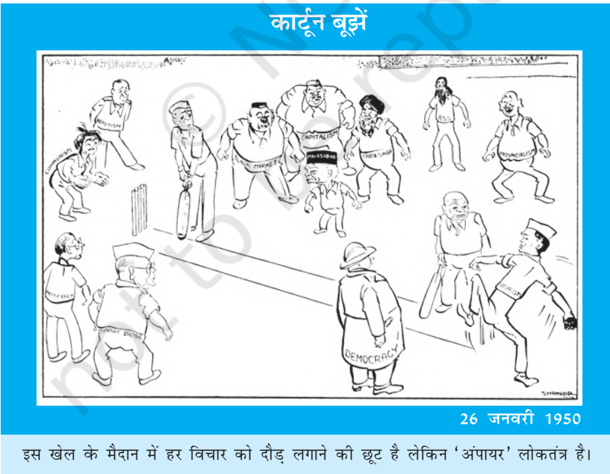
26 जनवरी 1950

यह कठिन है। हमें सीधे-सीधे क्यों नहीं बता दिया जाता कि इस संविधान का दर्शन क्या है? यदि यह दर्शन ऐसे छुपा रहेगा तो आम नागरिक इसे कैसे समझेगा?