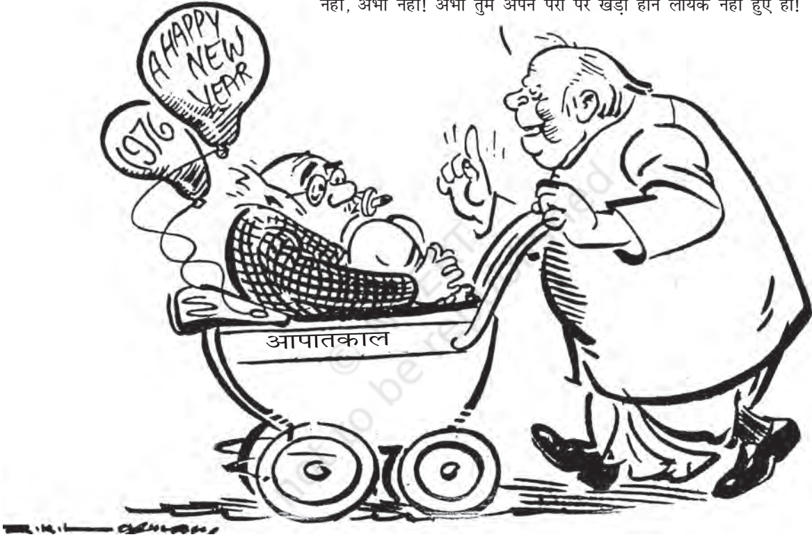
साभार: आर.के. लक्ष्मण, टाइम्स ऑफ़ इंडिया

नहीं, अभी नहीं! अभी तुम अपने पैरों पर खड़ा होने लायक नहीं हुए हो!