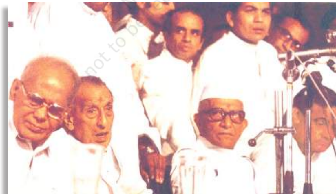
1977 में बनी गैर-कांग्रेसी सरकार का शपथ ग्रहण समारोह। चित्र में जयप्रकाश नारायण, जे. बी. कृपलानी, मोरारजी देसाई और अटलबिहारी वाजपेयी बैठे हुए नज़र आ रहे हैं।

बहरहाल अगर आप चुनावी नतीजों के नक्शे पर नज़र दौड़ाएँ, तो पाएँगे कि कांग्रेस देश में हर जगह चुनाव नहीं हारी थी। महाराष्ट्र, गुजरात और उड़ीसा में उसने कई सीटों पर अपना कब्ज़ा बरकरार रखा था और दक्षिण भारत के राज्यों में तो एक तरह से उसकी चुनावी विजय का चक्का बेरोक-टोक चला था। इसके कई कारण रहे। पहली बात तो यह थी कि आपातकाल का प्रभाव हर राज्य पर एकसमान नहीं पड़ा था। लोगों को ज़बरन उजाड़ने और विस्थापित करने अथवा ज़बरन नसबंदी करने का काम ज़्यादातर उत्तर भारत के राज्यों में हुआ था, लेकिन इससे भी ज़्यादा महत्वपूर्ण बात यह थी कि उत्तर भारत में राजनीतिक प्रतिद्वंद्विता की प्रकृति में दूरगामी बदलाव आए थे। उत्तर भारत का मध्यवर्ग कांग्रेस से दूर जाने लगा था