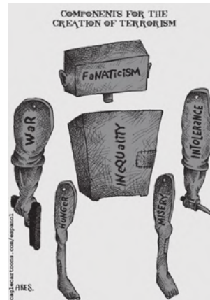
आतंकवाद के जन्म के कारण

संयुक्त राष्ट्र शैक्षणिक, वैज्ञानिक एवं सांस्कृतिक संगठन (यूनिसेफ) के संविधान ने उचित ही टिप्पणी की है कि, “चूँकि युद्ध का आरंभ