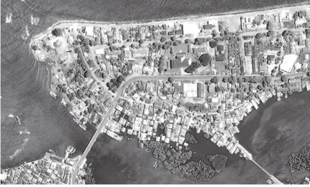
बंडा आसेह, जून 2004