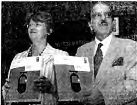
Water Resources Minister Saifuddin Soz (right) and Maxine Olson, UNDP Resident Representative in India, at the release of Human Development Report, 2006, in New Delhi on Thursday.

GOVT QUESTIONS REPORT PRESS TRUST OF INDIA New Delhi, 9 November India, which has been placed 126th in the UNDP Human Development Index, today questioned the ranking, saying comparisons should be between equals. "Just as you cannot compare Maldives with India, you cannot compare us with countries like Norway, Sweden or Singapore, which are far more developed," Union Minister of Water Resources Saifuddin Soz told reporters here while releasing the UNDP Human Development Report, 2006. Soz said India had made "spectacular progress" in many fields and it was not necessarily reflected by the index. "The ranking should be on the basis of comparisons between equal countries in terms of size and population," he said, adding UNDP had been comparing big countries like India and China with other smaller countries. Soz said in future UNDP should think about the ranking system and find new tools to give a more appropriate picture. The index, which measures achievements in terms of life expectancy, education and adjusted real income, ranked 177 countries with Norway on top and Niger at the bottom. UNDP Policy Specialist Arunabha Ghosh, however, said the rankings were limited to comparable data. "We do not use absolute numbers but percentage," he said.