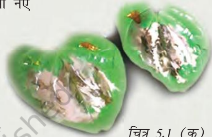
चित्र 5.1 (क) पान के पत्ते

महिलाओं और पुरुषों ने कार्य की तलाश में, प्राकृतिक आपदाओं से बचाव के लिए व्यापारियों, सैनिकों, पुरोहितों और तीर्थयात्रियों के रूप में या फिर साहस की भावना से प्रेरित होकर यात्राएँ की हैं। वे, जो किसी नए स्थान पर आते हैं अथवा बस जाते हैं, निश्चित रूप से एक ऐसी दुनिया को समझ पाते हैं जो भूदृश्य या भौतिक परिवेश के संदर्भ में और साथ ही लोगों की प्रथाओं, भाषाओं, आस्था तथा व्यवहार में भिन्न होती है। इनमें से कुछ इन भिन्नताओं के अनुरूप ढल जाते हैं और अन्य जो कुछ हद तक विशिष्ट होते हैं, इन्हें ध्यानपूर्वक अपने वृत्तांतों में लिख लेते हैं, जिनमें असामान्य तथा उल्लेखनीय बातों को अधिक महत्त्व दिया जाता है।