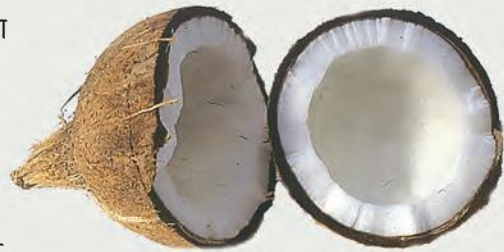
चित्र 5.1 (ख) नारियल

इस अध्याय में हम यह देखेंगे कि उपमहाद्वीप में आए यात्रियों द्वारा दिए गए सामाजिक जीवन के विवरणों के अध्ययन से किस प्रकार हम अपने अतीत के विषय में ज्ञान बढ़ा सकते हैं। इसके लिए हम तीन व्यक्तियों के वृत्तांतों पर ध्यान देंगे: अल-बिरूनी, जो ग्यारहवीं शताब्दी में उज्बेकिस्तान आया था, इब्न बतूता (चौदहवीं शताब्दी), मोरक्को से तथा फ्रांसीसी यात्री फ्रांस्वा बर्नियर (सत्रहवीं शताब्दी)।