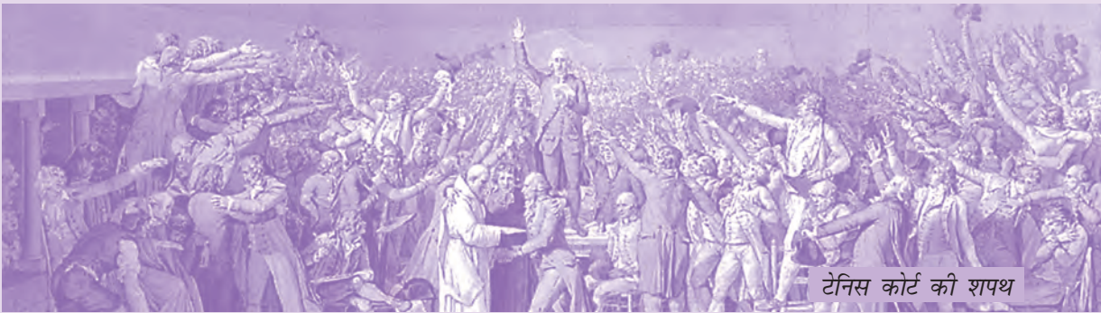
टेनिस कोर्ट की शपथ