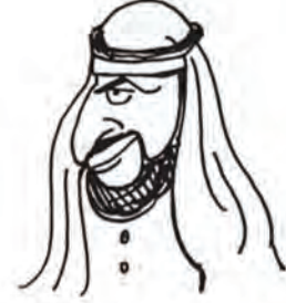
शेख पैट्रो डॉलर-उल्ला काला सोना मुल्क के सुल्तान

बेशकीमती चीजों की मैं कद्र करता हूँ। बिग ऑयल कहते हैं कि उनके राष्ट्रपति आजादी और जम्हूरियत को बड़ा कीमती मानते हैं इसीलिए मैंने भी अपने मुल्क में आजादी और जम्हूरियत को सात तालों के भीतर बंद करके रखा है।