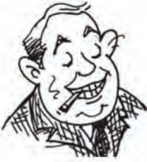
जनाब बिग ऑयल बिग ऑयल एंड संस के सीईओ

एक दिन मैंने खुद से पूछा कि आखिर मैं अपने मुल्क के किस काम आ सकता हूँ। मेरे मुल्क में तेल की भूख विकट है। वह कभी खत्म होने का नाम नहीं लेती, चलो, तो फिर तेल का इंतजाम करते हैं। मैं बाजार की आजादी का हामी हूँ। मतलब यह कि दूर के देशों में तेल के कुएँ खोदने की आजादी; धरती की आबो-हवा को मटियामेंट करने की आजादी और ऐसे कठपुतले तानाशाहों की ताजपोशी की आजादी जो अपनी ही जनता पर कोड़े फटकारे।