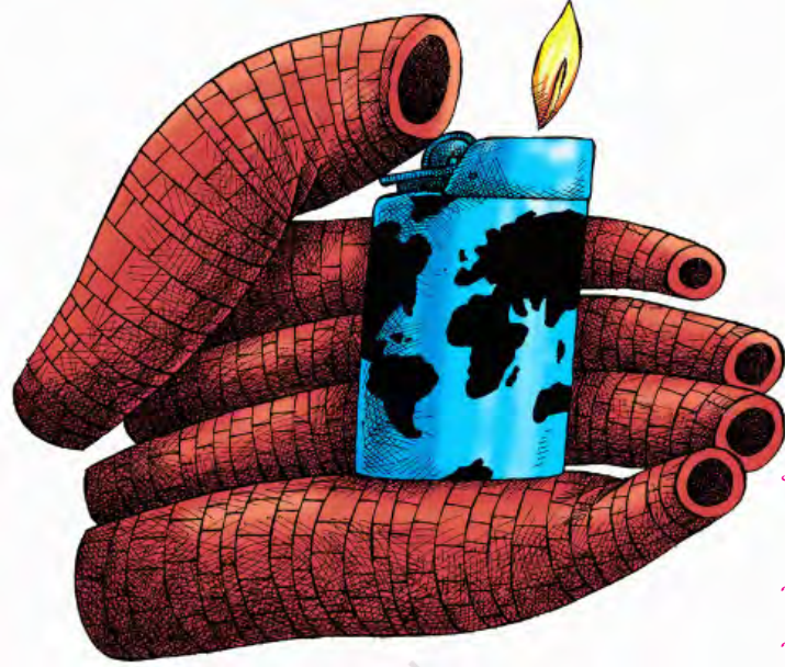
एसे, केगल्स कार्टून

हालाँकि पर्यावरण से जुड़े सरोकारों का लंबा इतिहास है लेकिन आर्थिक विकास के कारण पर्यावरण पर होने वाले असर की चिंता ने 1960 के दशक के बाद से राजनीतिक चरित्र ग्रहण किया। वैश्विक मामलों से सरोकार रखने वाले एक विद्वत् समूह 'क्लब ऑव रोम' ने 1972 में 'लिमिट्स टू ग्रोथ' शीर्षक से एक पुस्तक प्रकाशित की। यह पुस्तक दुनिया की