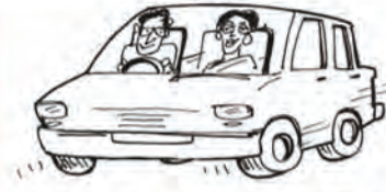
श्री एवं श्रीमती बड़बोले