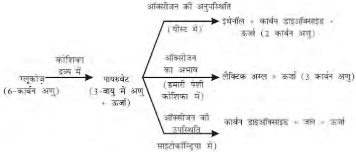
चित्र 6.8 भिन्न पथों द्वारा ग्लूकोज़ का विखंडन

• अवायवीय श्वसन- चूँकि यह प्रक्रम वायु की अनुपस्थिति में होता है, इसे अवायवीय श्वसन कहते हैं। यह प्रक्रम किण्वन के समय यीस्ट में होता है। इसके पश्चात पायरुवेट इथेनॉल तथा कार्बन डाइऑक्साइड में परिवर्तित हो सकता है।