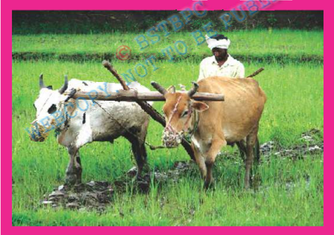
चित्र—10.2 हल चलाता किसान

बिहार के पूरब में पश्चिम बंगाल पश्चिम में उत्तर प्रदेश, उत्तर में नेपाल तथा दक्षिण में झारखंड है।