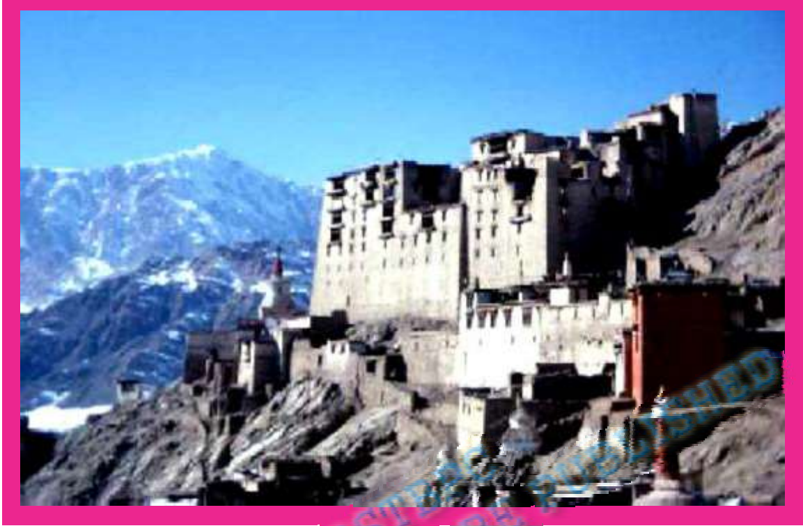
चित्र- बड़े लद्दाख का पिहायरी इलाका

उच्च भूमि है, जो तिब्बत के पठार का एक हिस्सा है। इस क्षेत्र की सामान्य ऊँचाई 3600 मीटर है। अधिक ऊँचाई के कारण जलवायु शीतल और हिमालय पहाड़ के वृष्टि छाया में पड़ने के कारण शुष्क है। यहाँ सालों भर खूब ठंड पड़ती है। दिसम्बर-जनवरी के महीने में पानी बर्फ हो जाता है। इसलिए वहाँ मई-जून के महीनों में भी गरम कपड़ों की जरूरत पड़ती है।