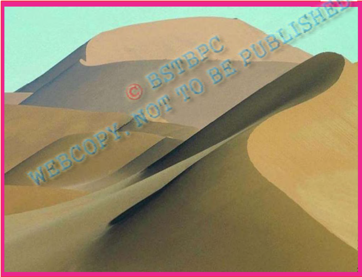
चित्र-9.2 बालू के टीले

शब्दावली— रेगिस्तान —यह एक शुष्क प्रदेश है जिसकी विशेषताएँ अत्यधिक उच्च या निम्न तापमान एवं विरल वनस्पति है।